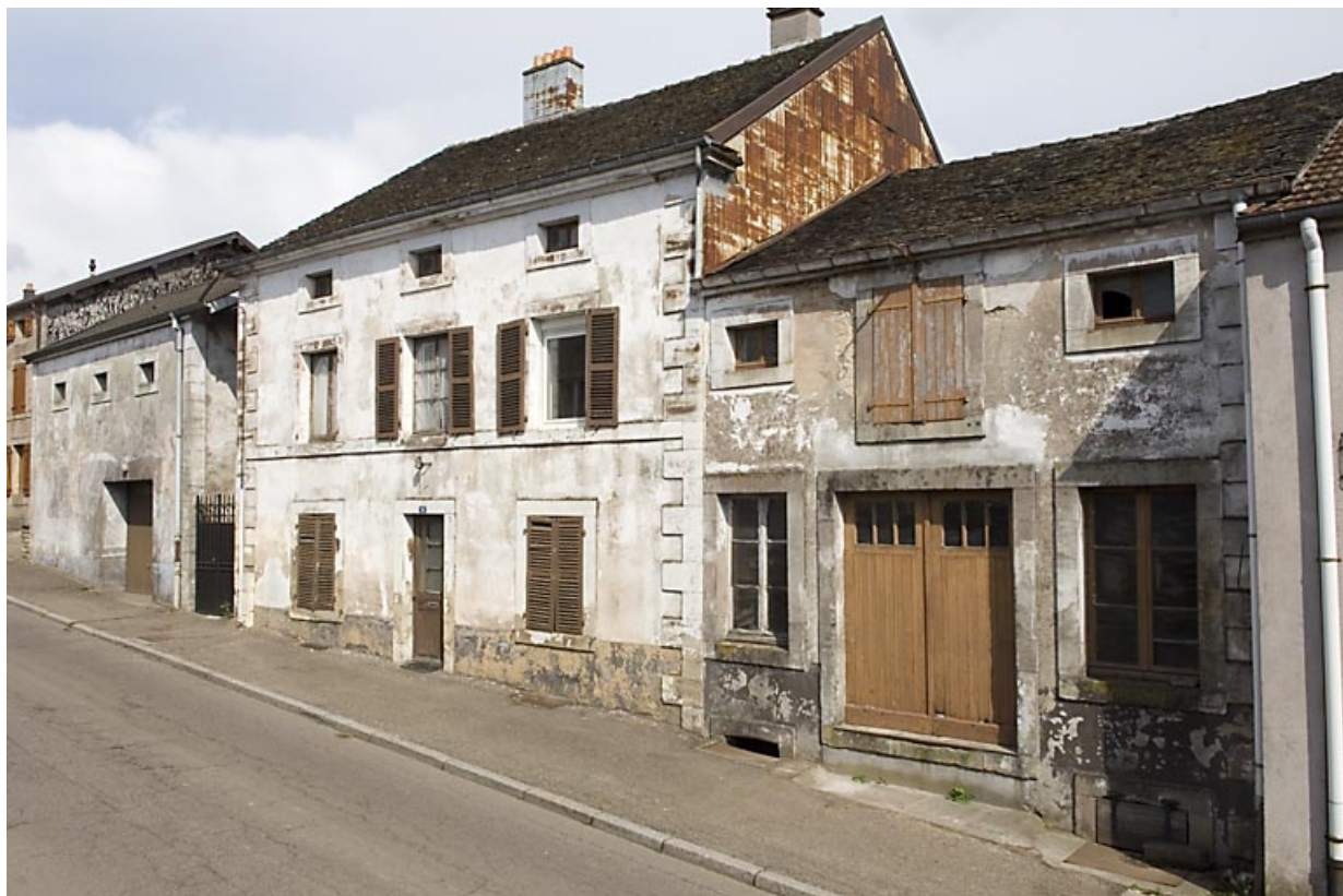
Vue d'ensemble depuis la rue de Plombières.