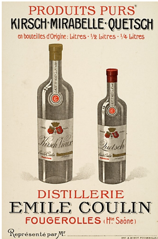
Carte publicitaire de la distillerie Emile Coulin. 70, Fougerolles, 18 rue de Plombières