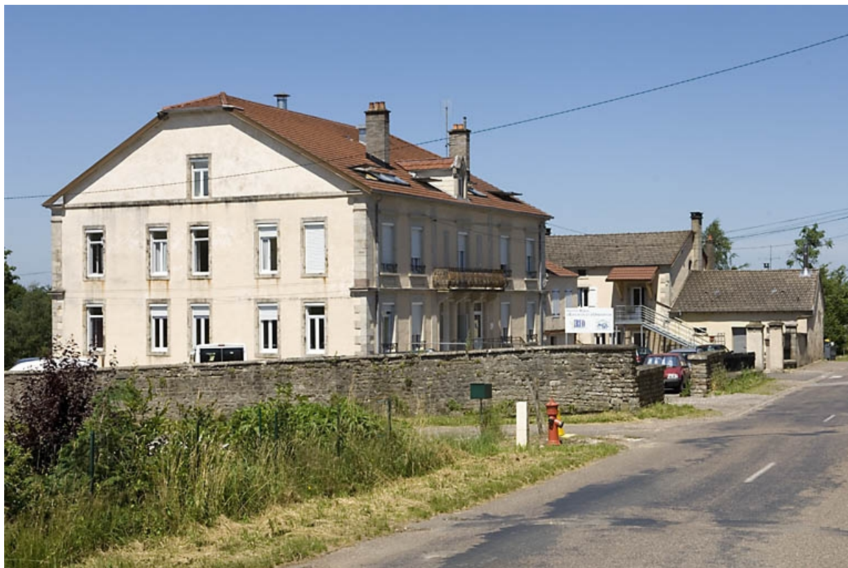
Vue d'ensemble depuis la route départementale.