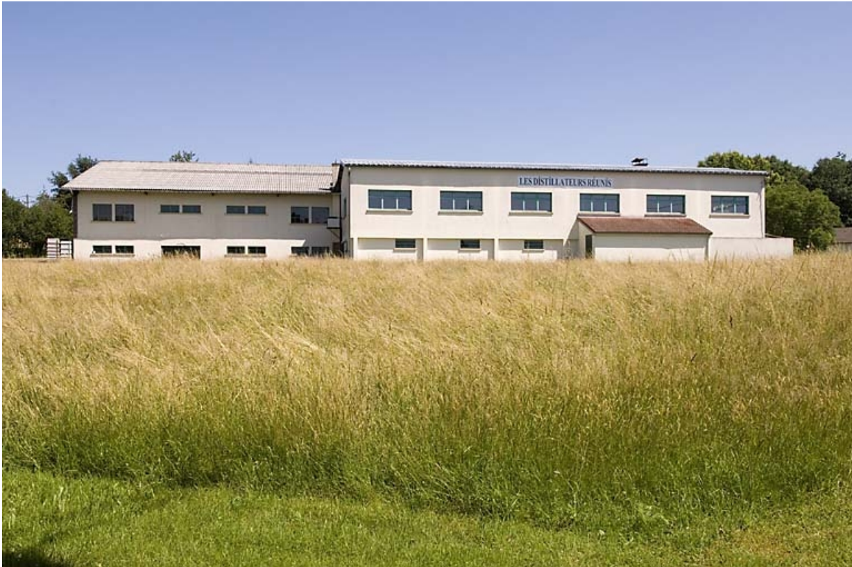
Vue d'ensemble de la nouvelle distillerie.