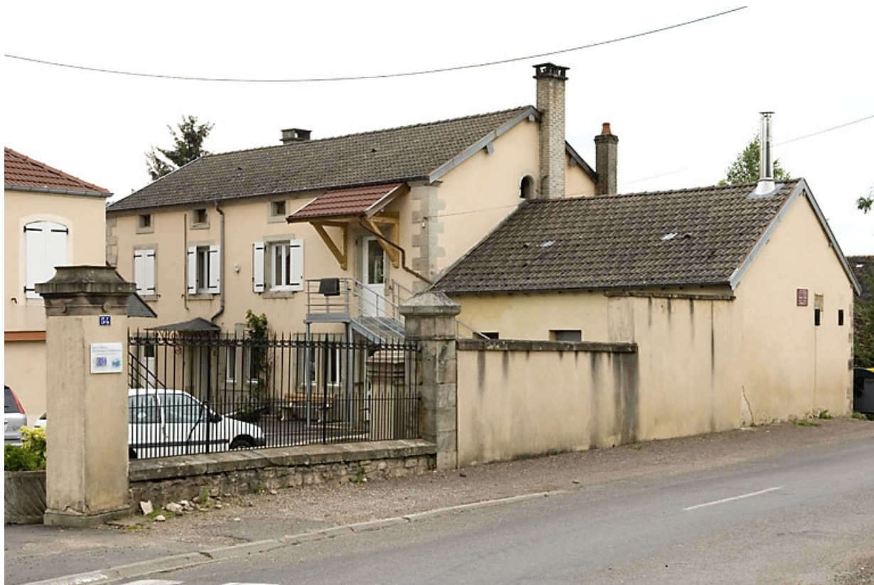
Ancien atelier de fabrication vu de trois quarts.