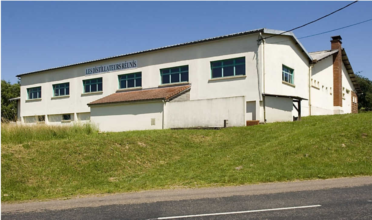
La nouvelle distillerie. Vue depuis la route.