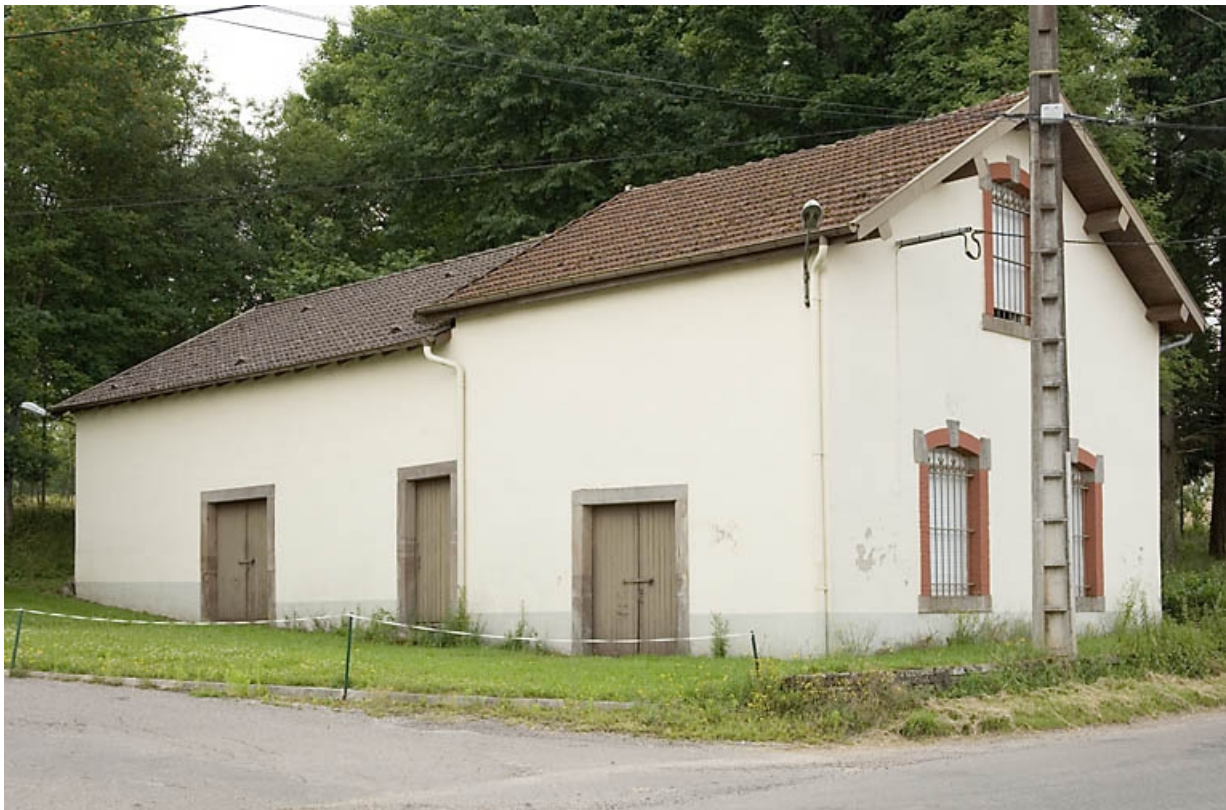
Ancien atelier de fabrication situé à l'est de la route départementale.