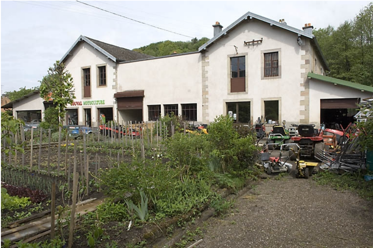
Chai et atelier de fabrication. Vue d'ensemble depuis le sud-est. 70, Fougerolles, 29 rue de Luxeuil, lieudit : Fougerolles-le-Château