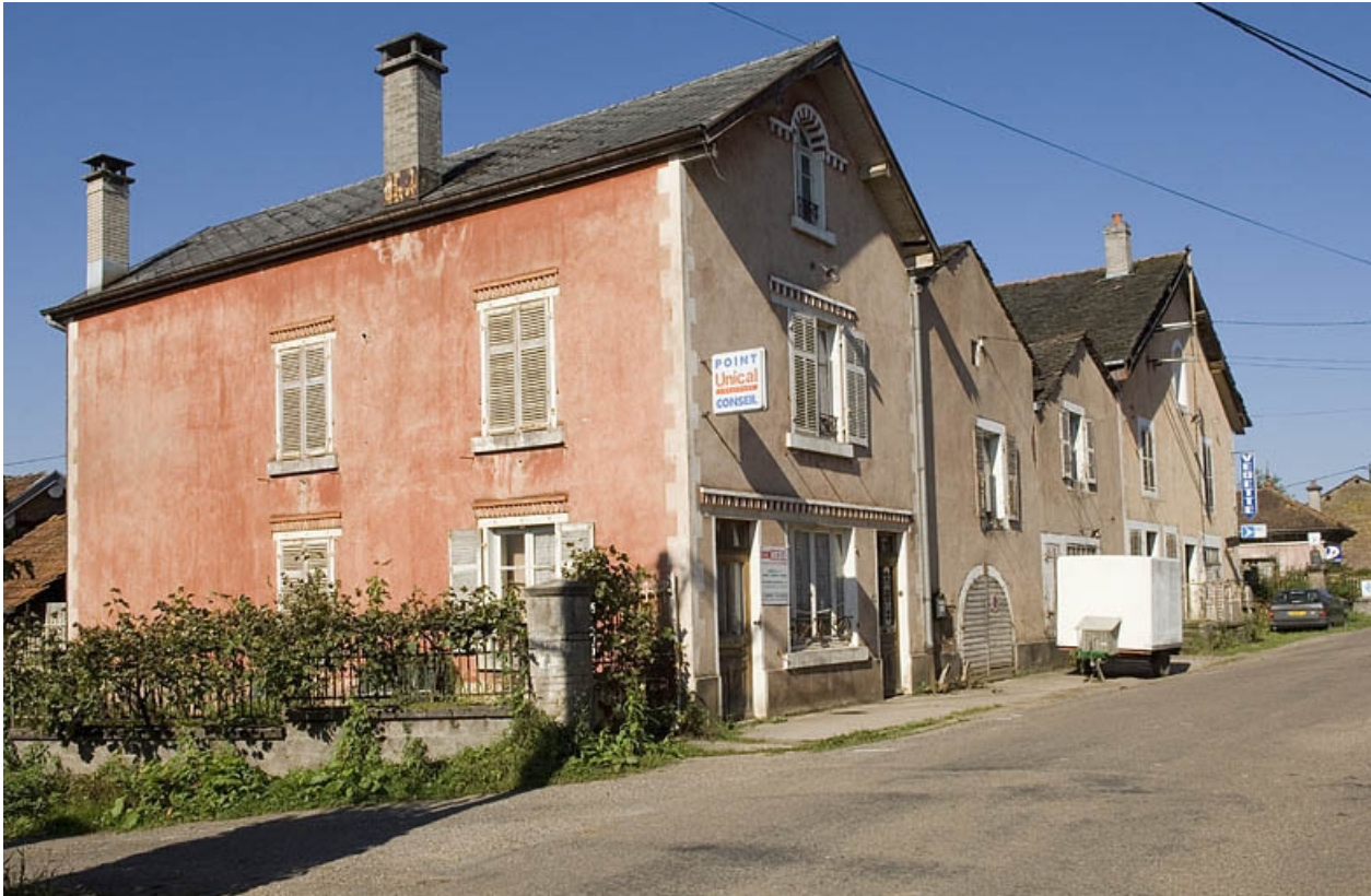
Vue de trois quarts depuis la route.

70, Fougerolles, lieudit : le Pré du Rupt