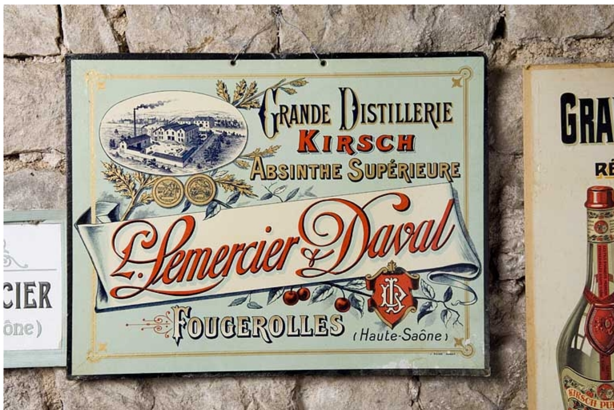
Grande distillerie Lemercier et Daval 70, Fougerolles, lieudit : le Pré du Rupt