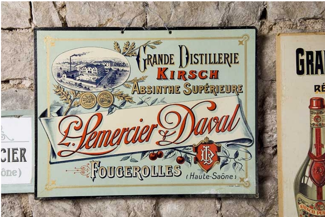
Grande distillerie Lemerrier et Daval 70, Fougerolles, lieudit : le Pré du Rupt