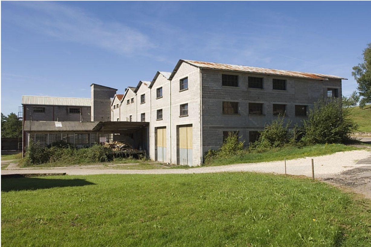
Vue de trois quarts arrière.

70, Aillevillers-et-Lyaumont, lieudit : les Granges de la Branleure