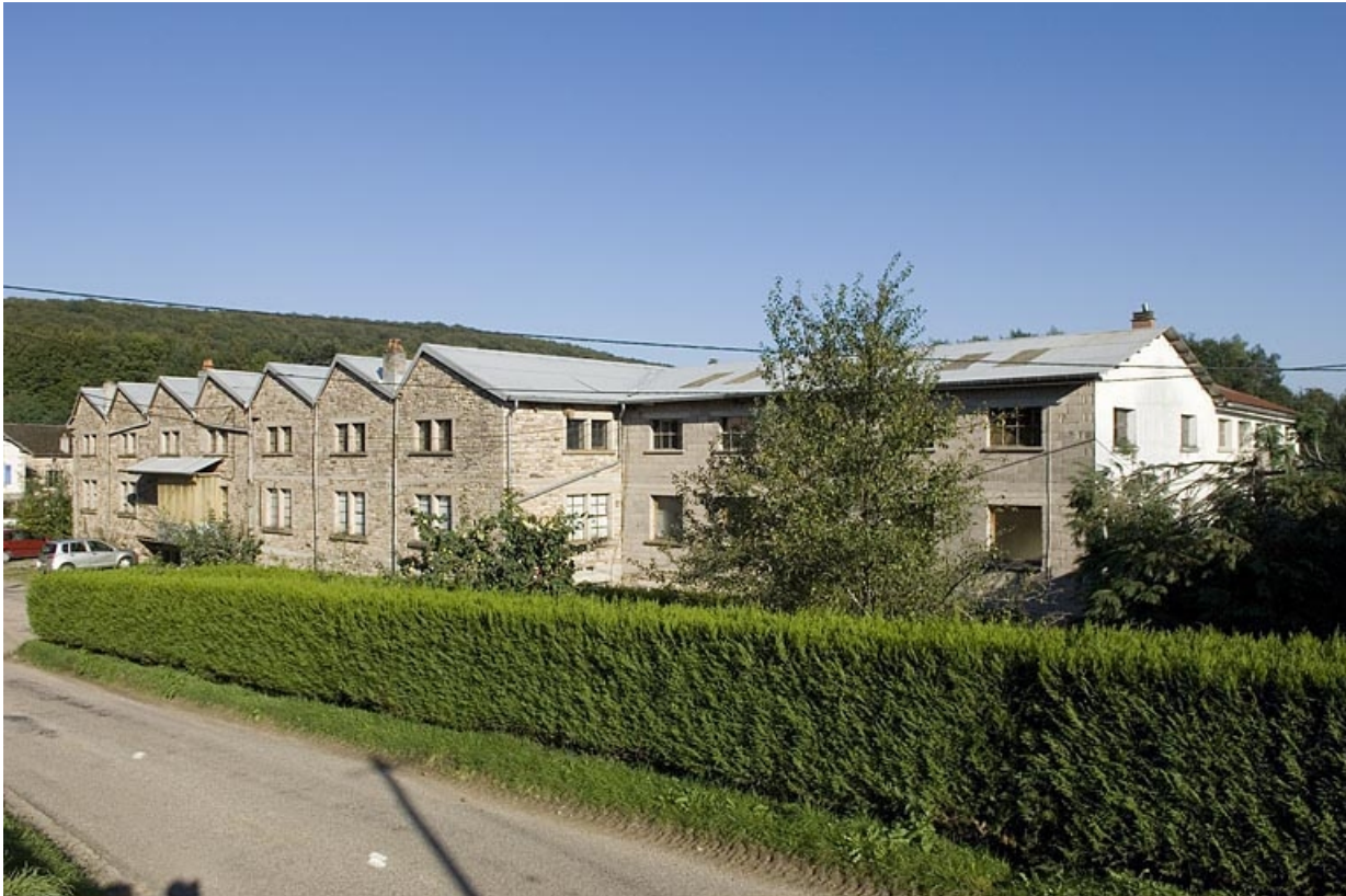
Vue d'ensemble depuis l'ouest.

70, Aillevillers-et-Lyaumont, lieudit : les Granges de la Branleure