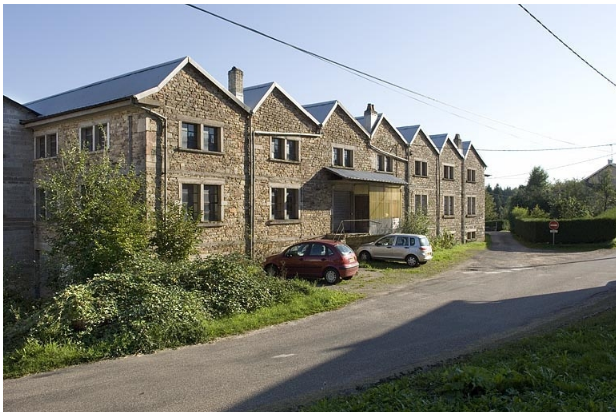
Pignons antérieurs depuis le nord.

70, Aillevillers-et-Lyaumont, lieudit : les Granges de la Branleure