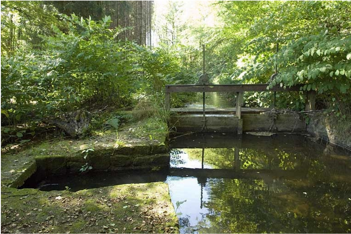
Vannage sur le bief de dérivation.

70, Aillevillers-et-Lyaumont, lieudit : Pont les Ports