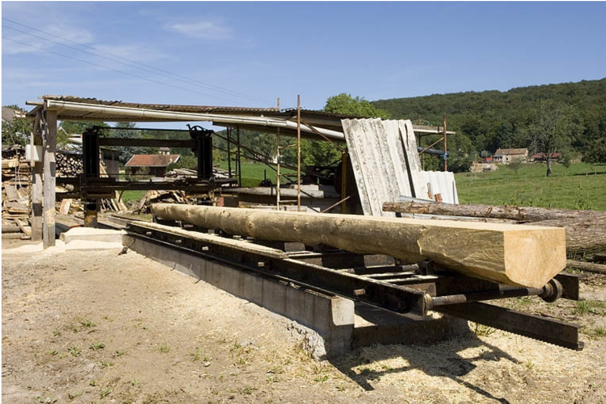
Châssis de scie horizontale monolame. Vue d'ensemble (hameau de la Louvière).