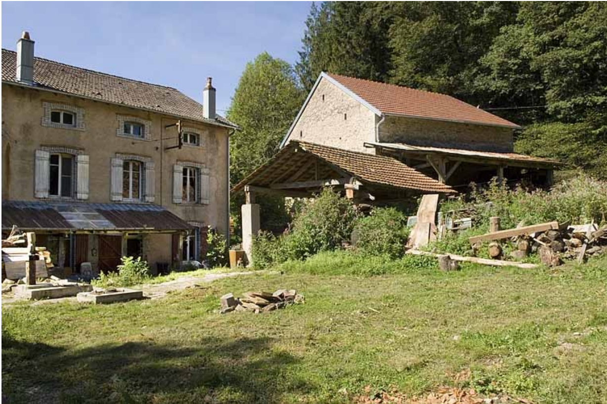
Façade postérieure, avec l'emplacement du châssis de scie.

70, Aillevillers-et-Lyaumont, lieudit : Pont les Ports