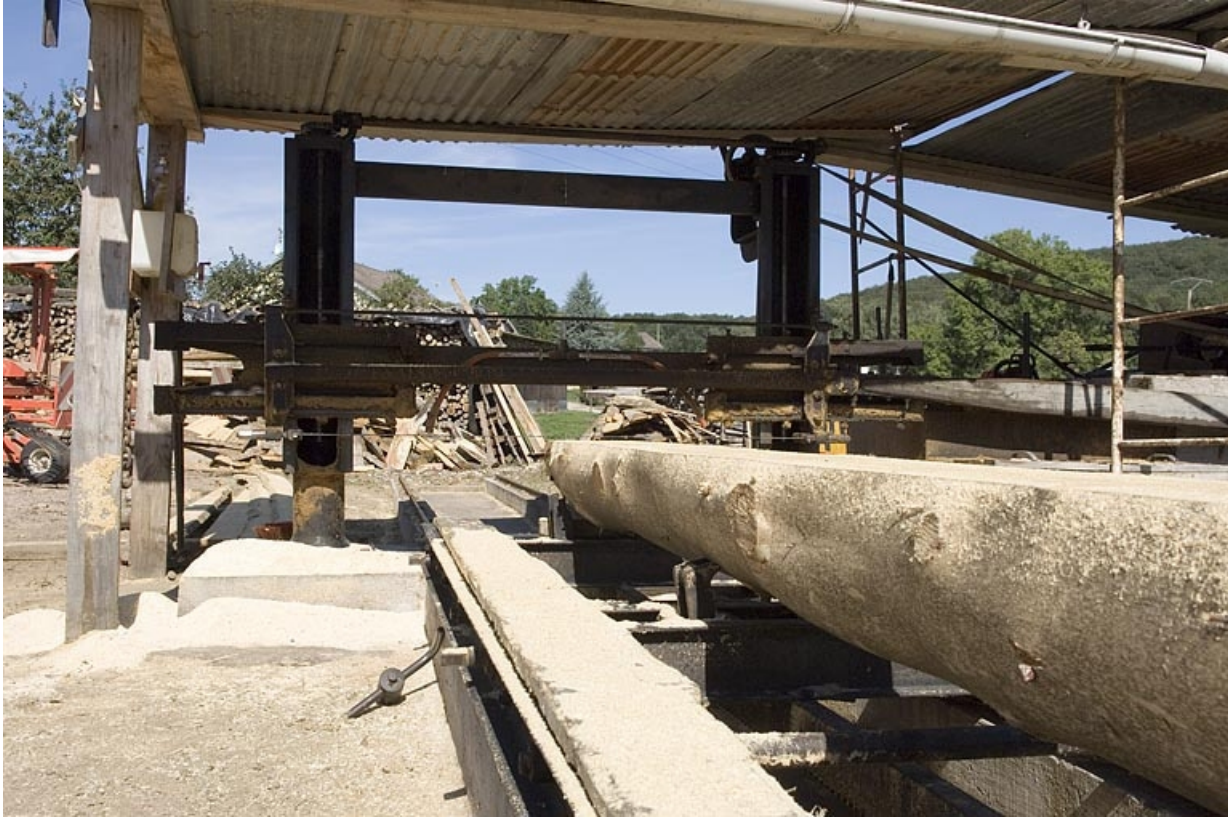
Scie horizontale monolame. Chariot et châssis (hameau de la Louvière).

70, Aillevillers-et-Lyaumont, lieudit : Pont les Ports