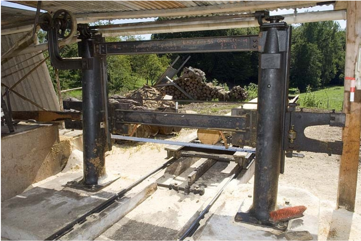
Scie horizontale monolame. Détail du châssis (hameau de la Louvière).