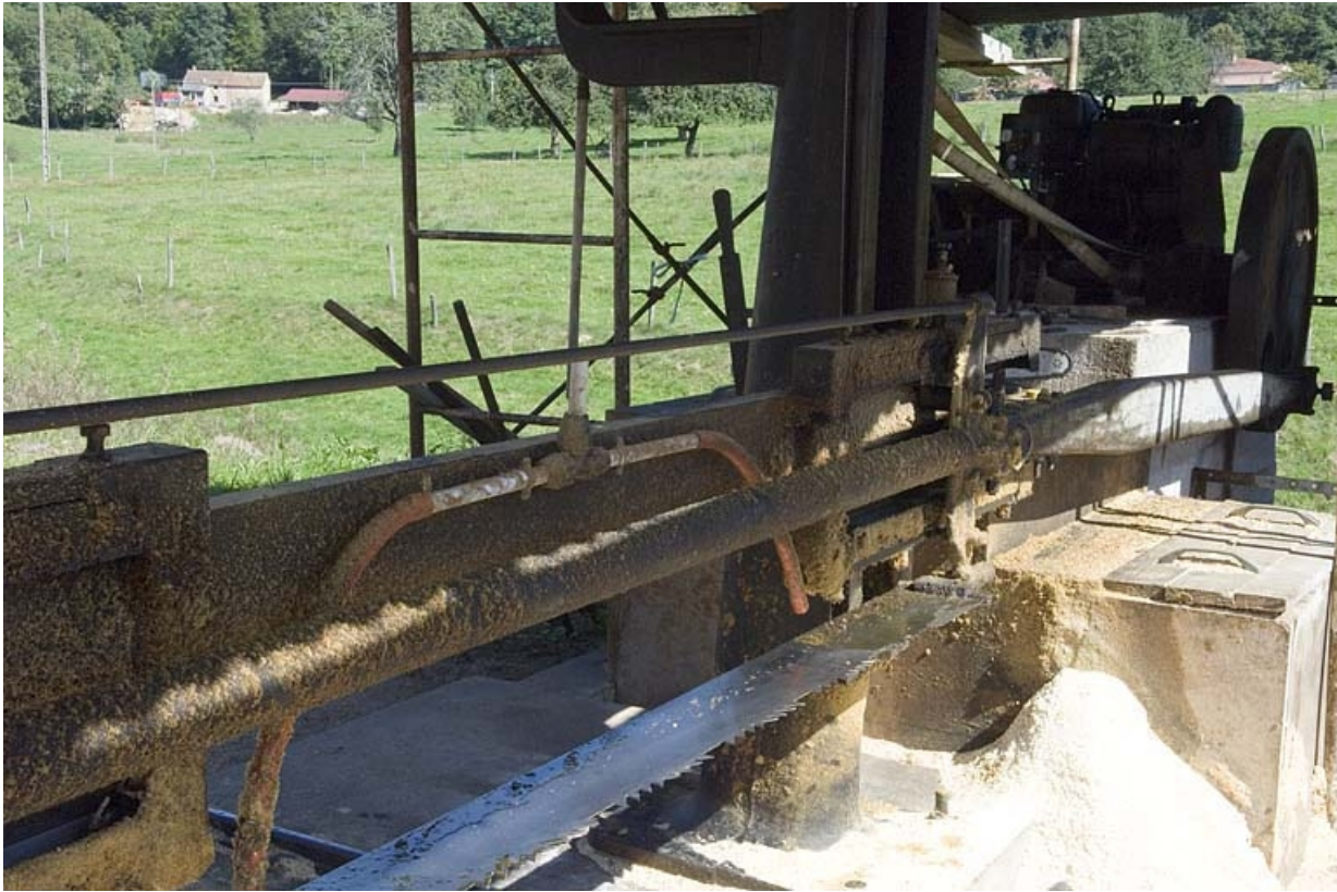
Scie horizontale monolame. Détail de lame, de la transmission (bielle et manivelle) et du moteur (hameau de la Louvière). 70, Aillevillers-et-Lyaumont, lieudit : Pont les Ports