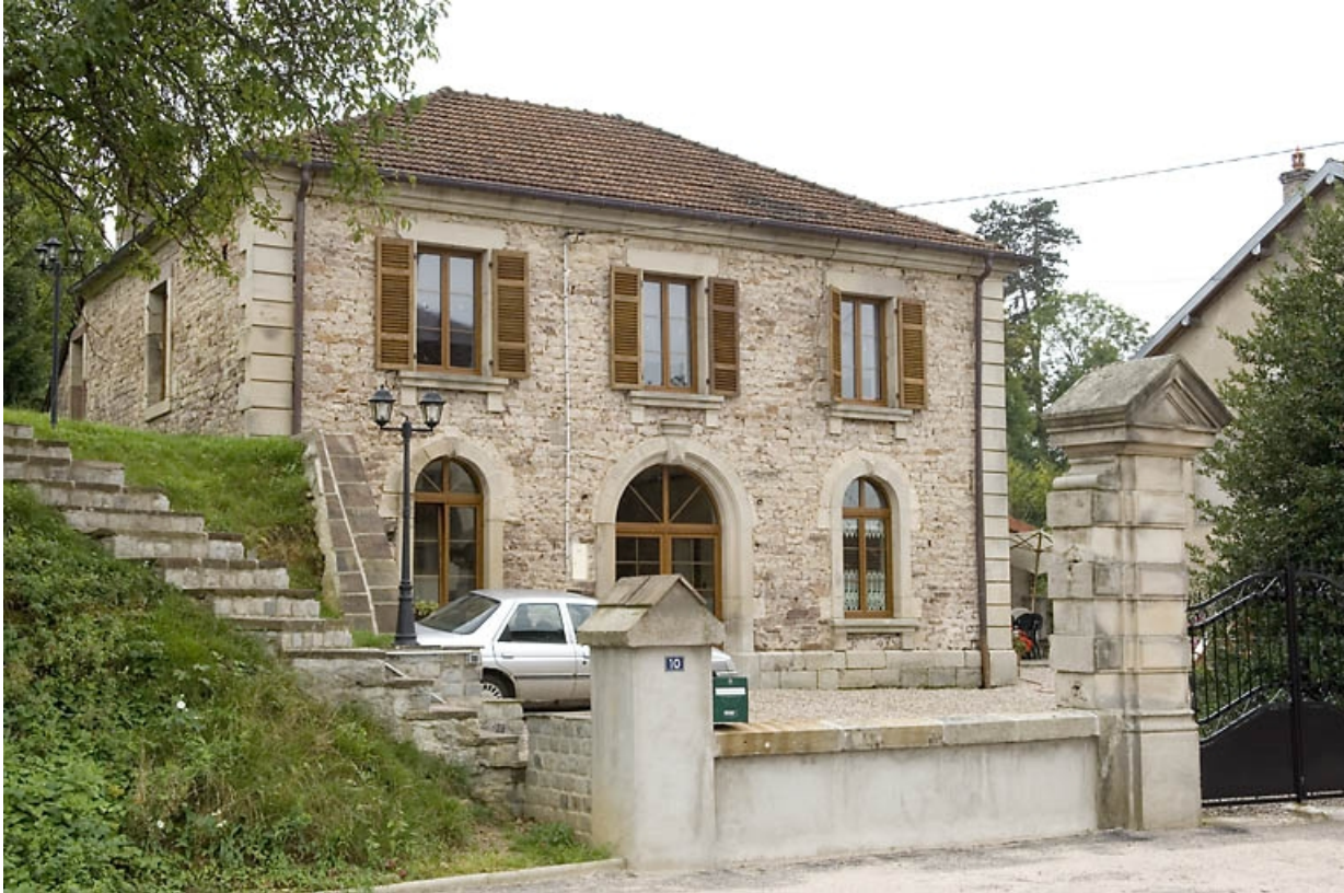
Façade antérieure. Vue de trois quarts.

70, Ailevillers-et-Lyaumont, 10 route de Plombières