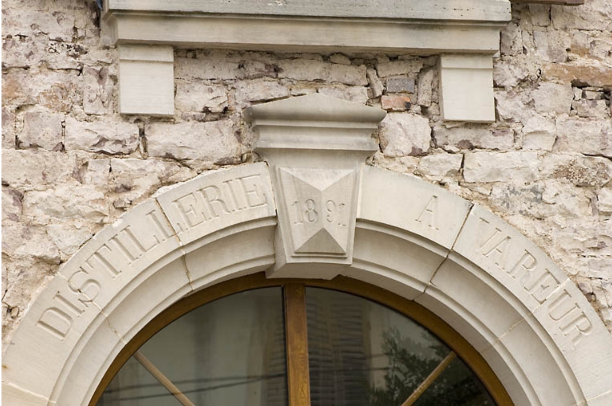
Façade antérieure. Inscription sur l'arc en plein-cintre de la porte.

70, Aillevillers-et-Lyaumont, 10 route de Plombières