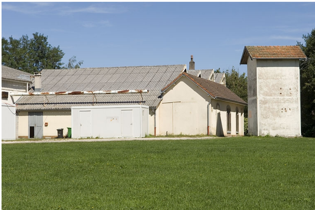
Atelier de fabrication et transformateur depuis le sud-ouest.

70, Aillevillers-et-Lyaumont, lieudit : zone industrielle des Corbillottes