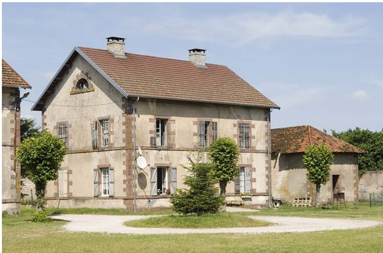
Pavillon est vu de trois quarts.