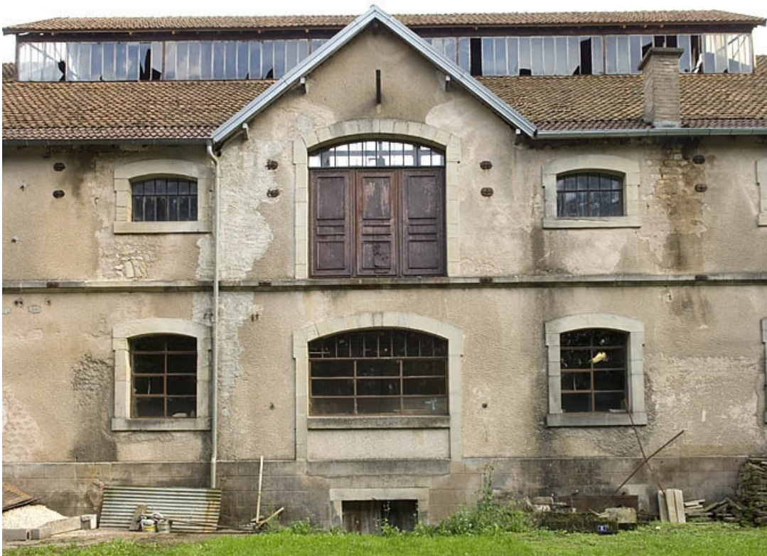
Travée centrale de la façade postérieure.

70, Saint-Loup-sur-Semouse rue des Jardins