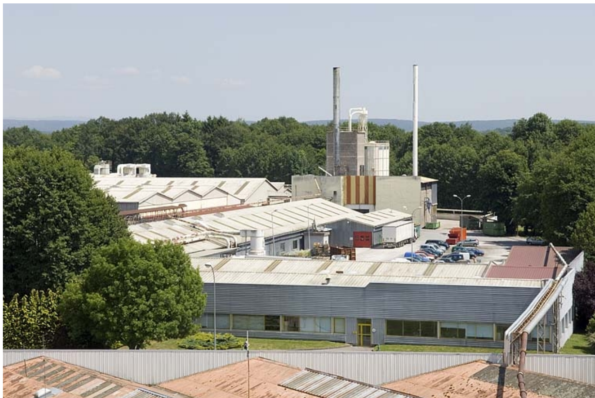
Partie sud de l'usine de meubles.