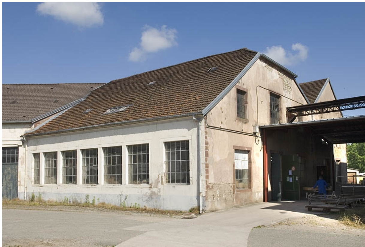
Atelier de fabrication original. Vue de trois quarts.

70, Saint-Loup-sur-Semouse, 11 rue de la Croix Parthey, lieudit : au Grand Baigneux