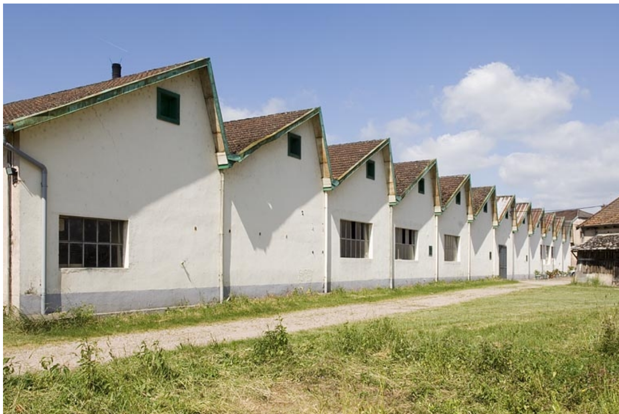
Atelier de fabrication. Alignement de pignons depuis le sud.

70, Saint-Loup-sur-Semouse, 11 rue de la Croix Parthey, lieudit : au Grand Baigneux