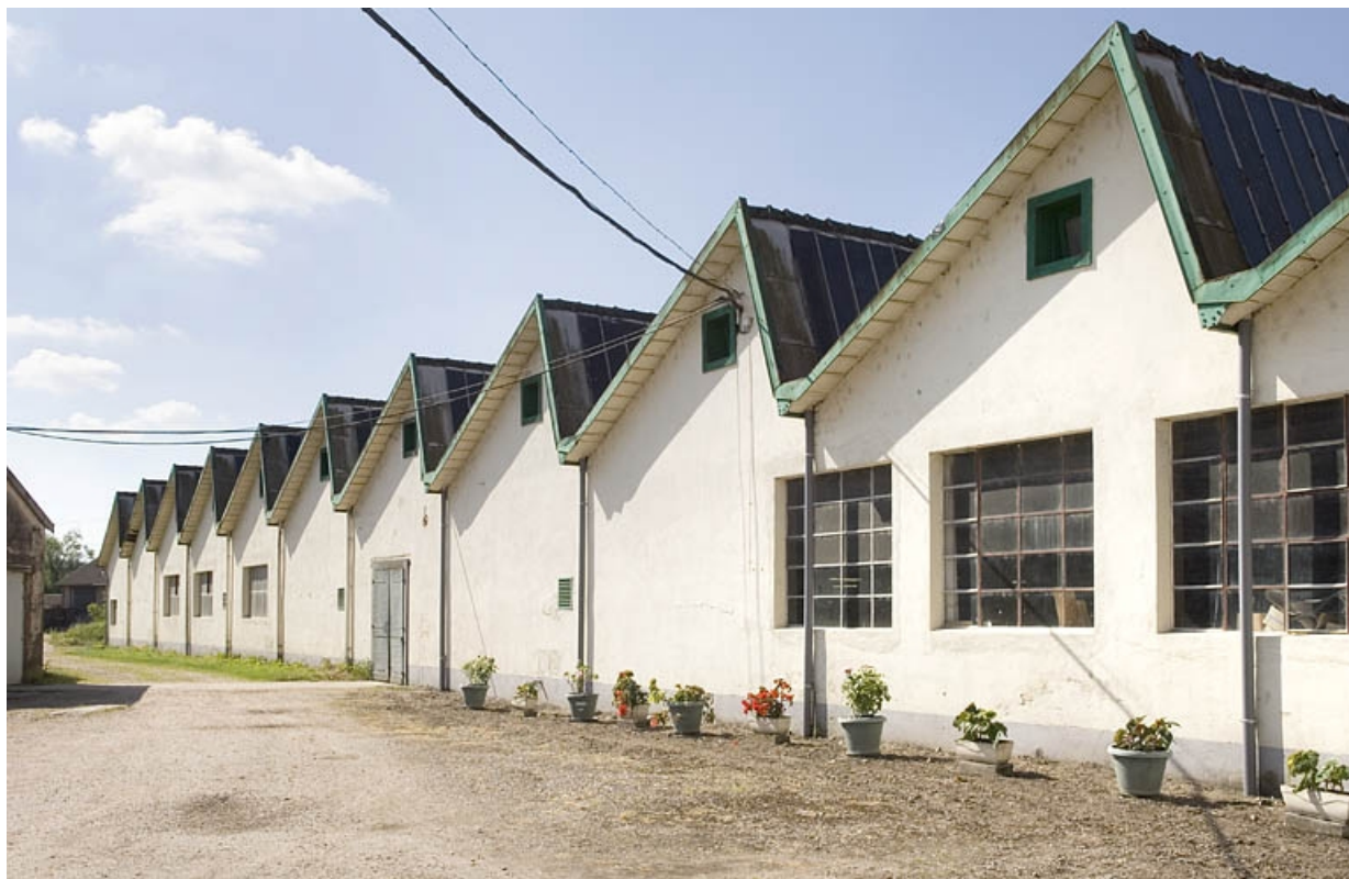
Atelier de fabrication. Alignement de pignons depuis le nord.

70, Saint-Loup-sur-Semouse, 11 rue de la Croix Parthey, lieudit : au Grand Baigneux