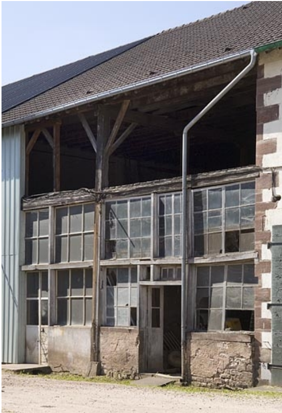
Bâtiment ouest. Elévation d'une façade.

70, Saint-Loup-sur-Semouse, 11 rue de la Croix Parthey, lieudit : au Grand Baigneux