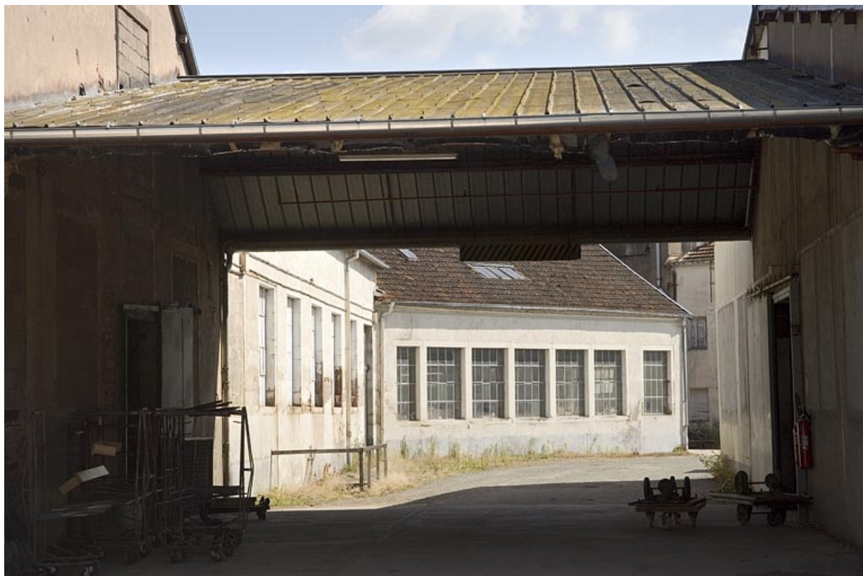
Atelier de fabrication original. Vue depuis l'ouest

70, Saint-Loup-sur-Semouse, 11 rue de la Croix Parthey, lieudit : au Grand Baigneux