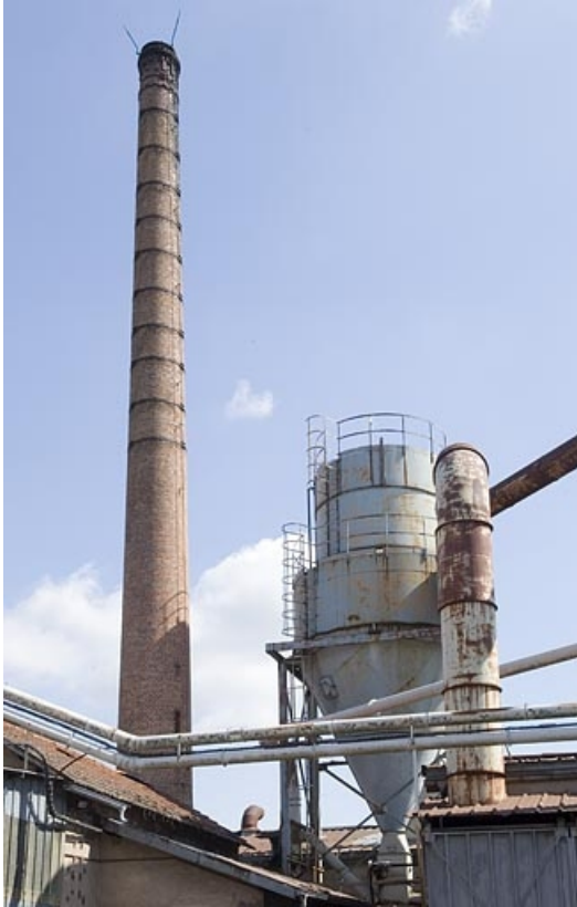
Cheminée et silo. Vue rapprochée.

70, Saint-Loup-sur-Semouse, 11 rue de la Croix Parthey, lieudit : au Grand Baigneux