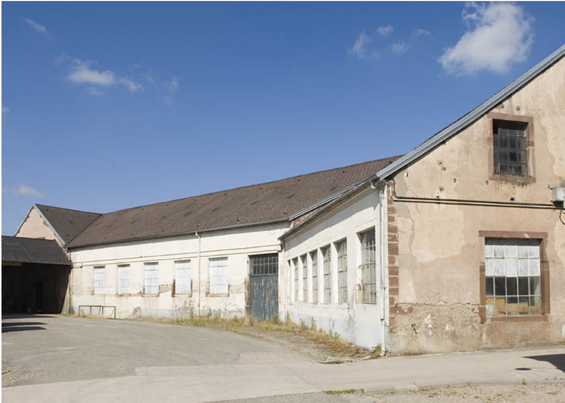
Atelier de fabrication original. Vue depuis l'est.

70, Saint-Loup-sur-Semouse, 11 rue de la Croix Parthey, lieudit : au Grand Baigneux