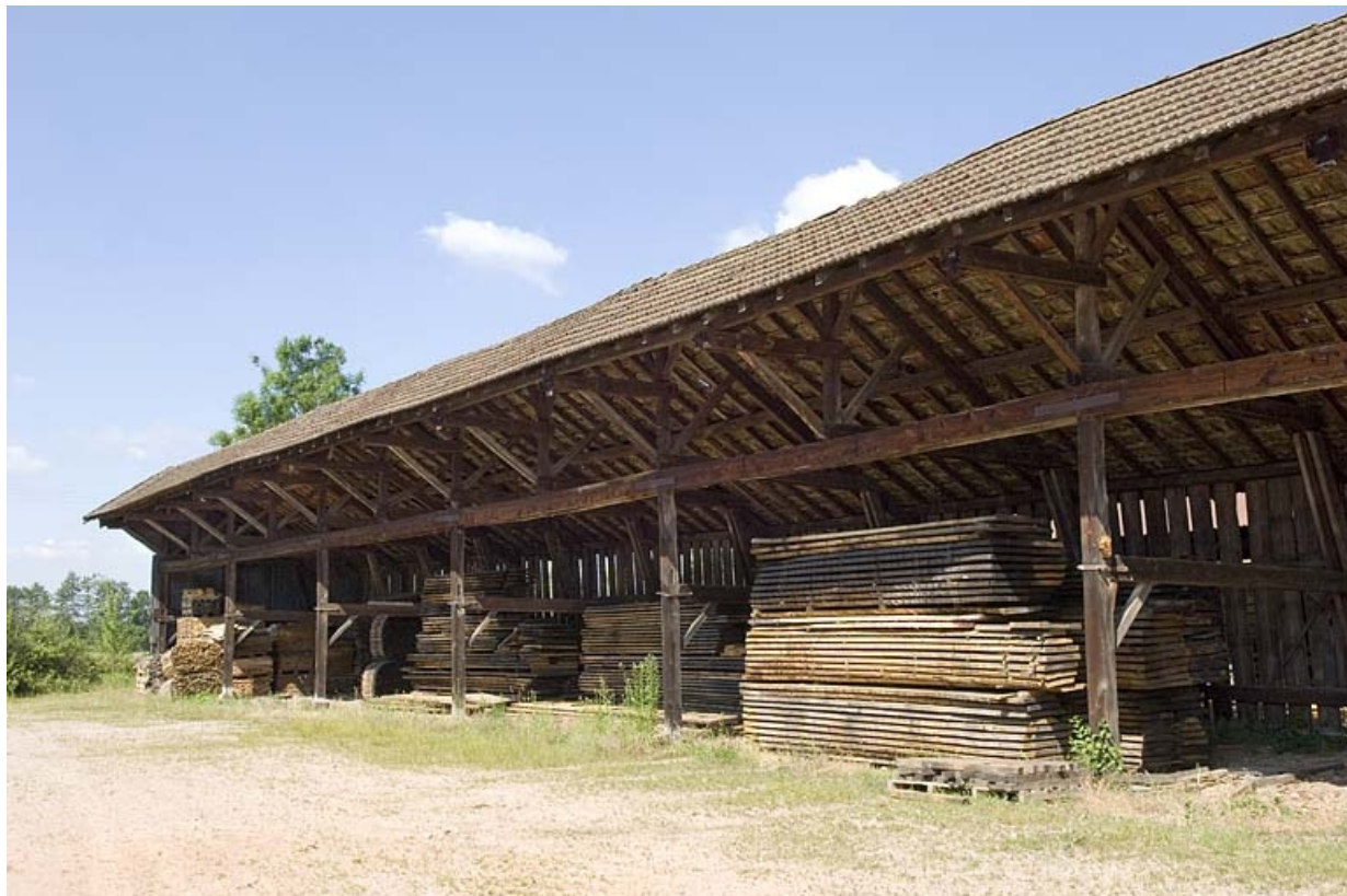
Entrepôt industriel ouest. Vue de trois quarts.

70, Saint-Loup-sur-Semouse, 11 rue de la Croix Parthey, lieudit : au Grand Baigneux