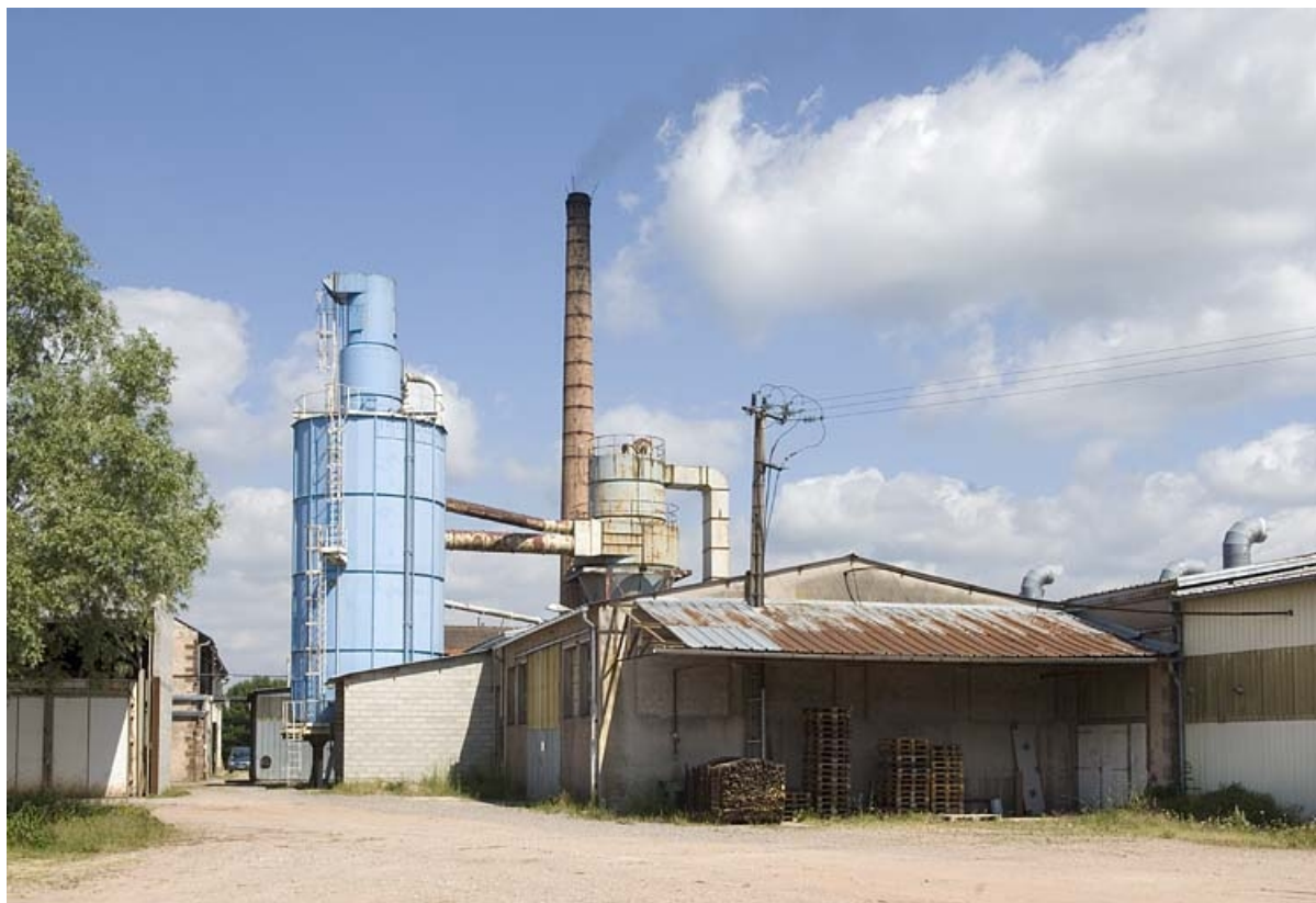
Silo et cheminée. Vue d'ensemble.

70, Saint-Loup-sur-Semouse, 11 rue de la Croix Parthey, lieudit : au Grand Baigneux