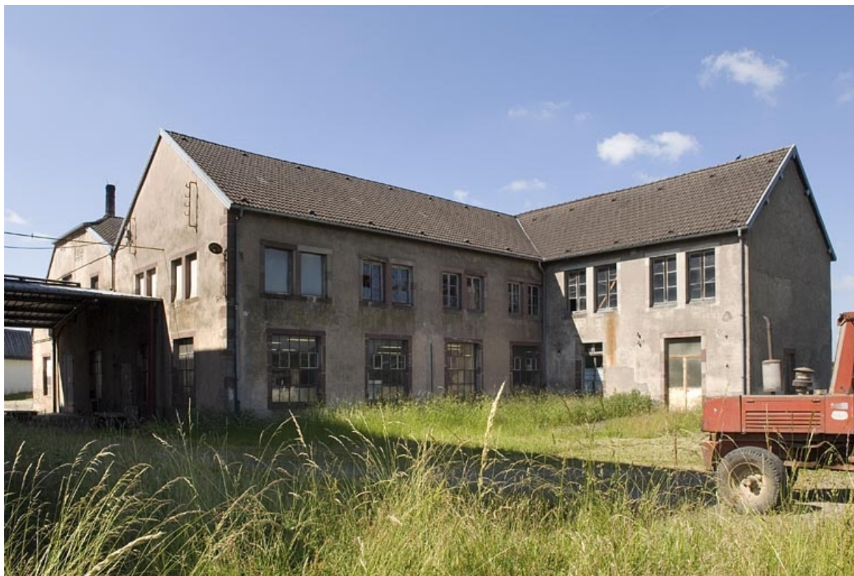
Atelier de fabrication original. Vue de trois quarts arrière.

70, Saint-Loup-sur-Semouse, 11 rue de la Croix Parthey, lieudit : au Grand Baigneux