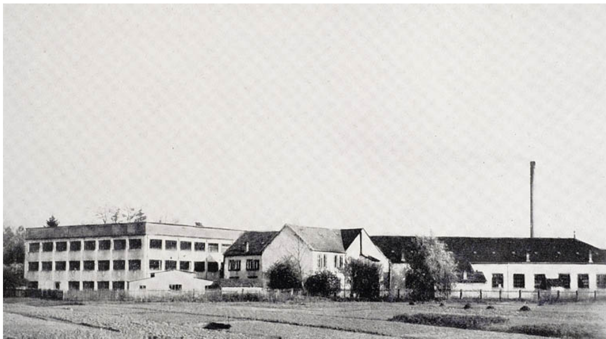
L'usine principale des Usines Réunies.

70, Saint-Loup-sur-Semouse, 11 rue de la Croix Parthey, lieudit : au Grand Baigneux