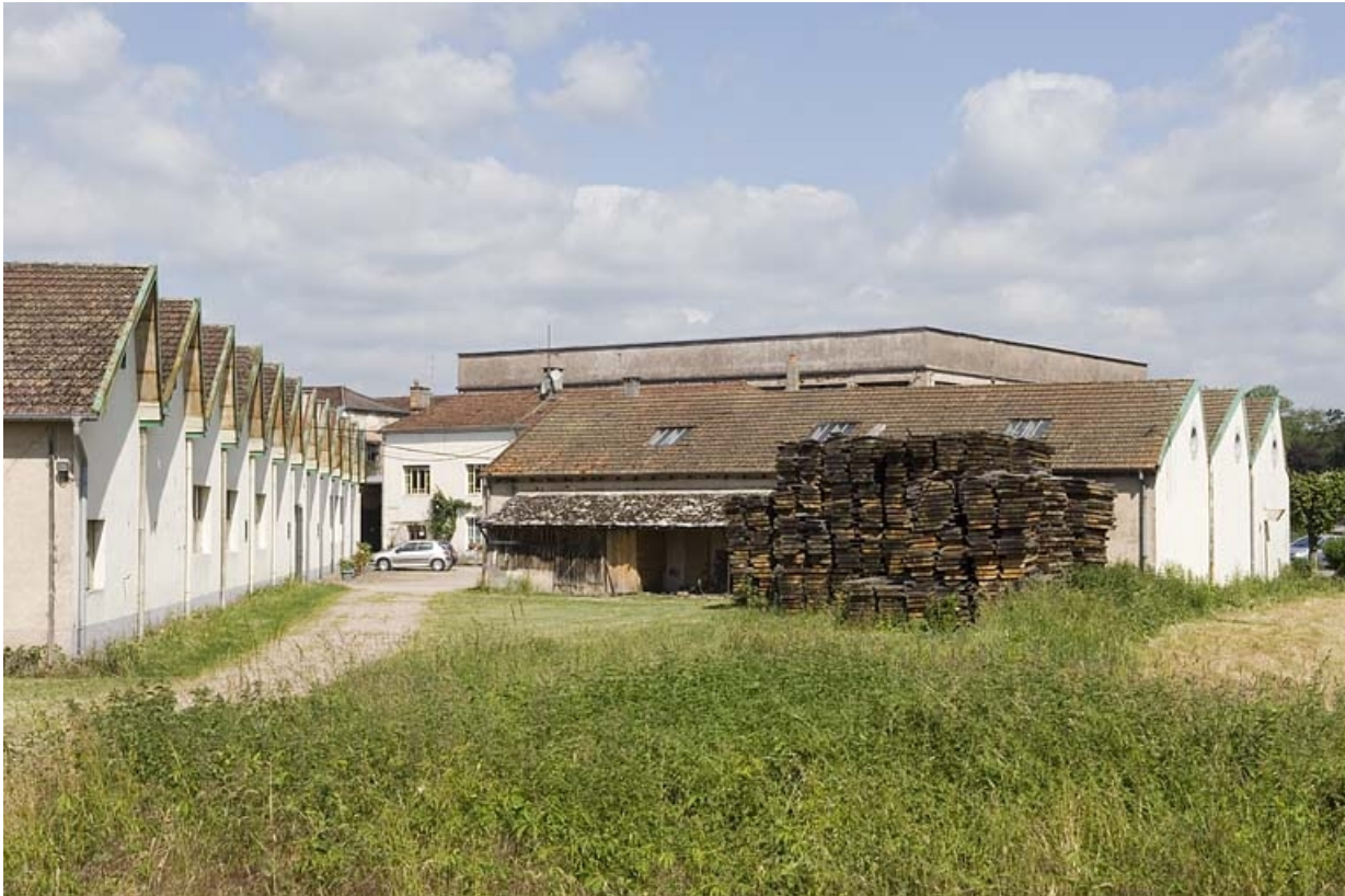
Atelier de fabrication et magasin industriel depuis le sud.

70, Saint-Loup-sur-Semouse, 11 rue de la Croix Parthey, lieudit : au Grand Baigneux