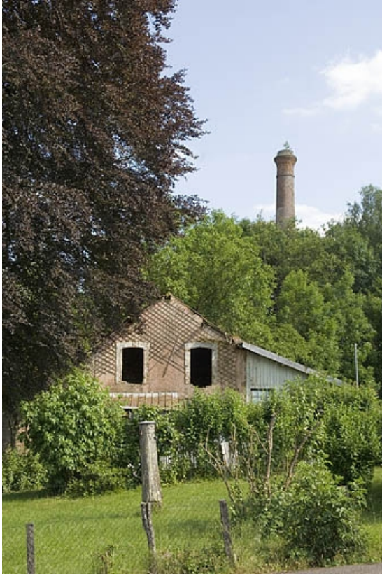
Dépendance située entre l'usine et la cité Saint-Anne.