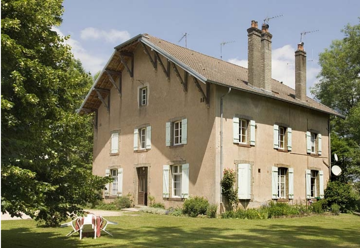
Logement vu de trois quarts.