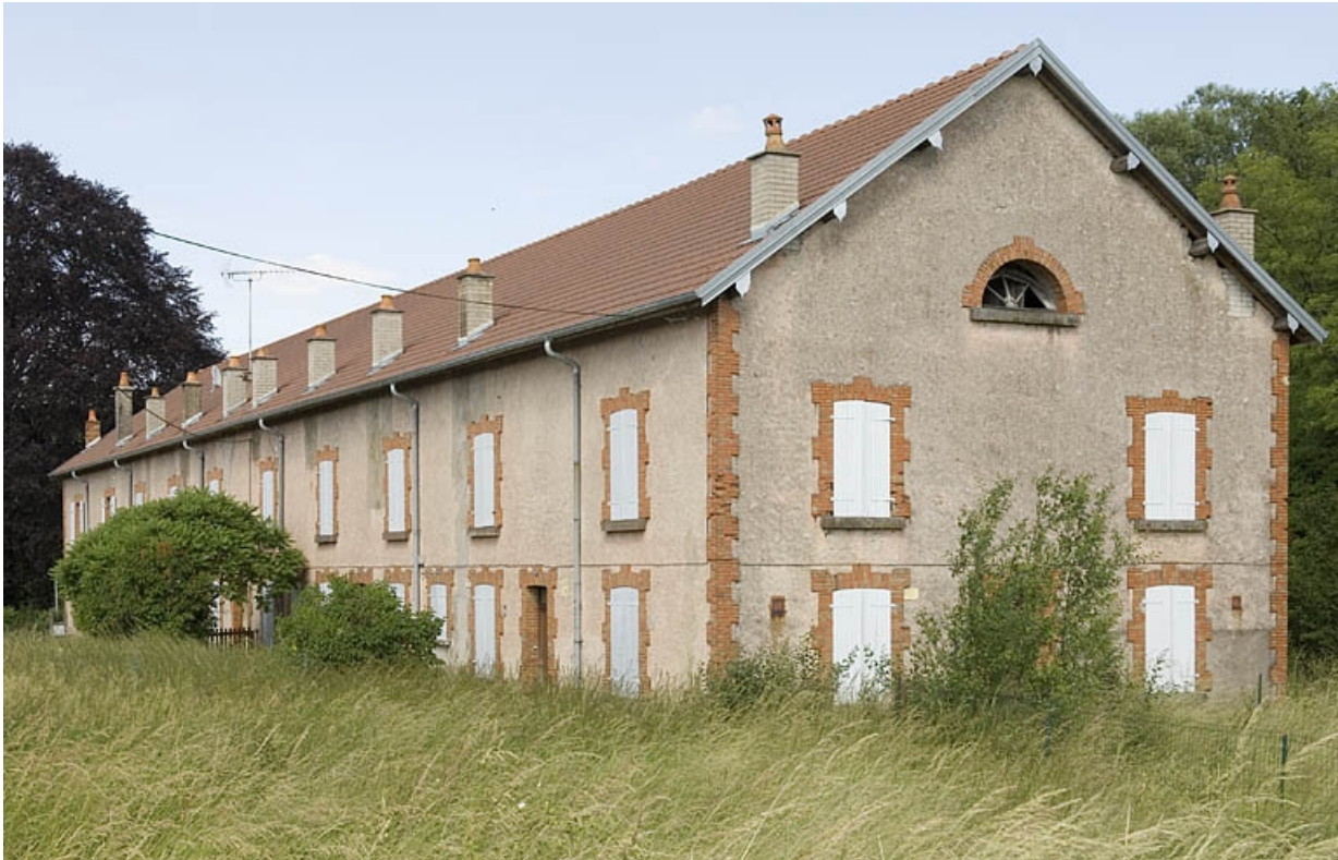
Logement ouvrier dit cité Saint-Anne. Vue depuis le sud-ouest.