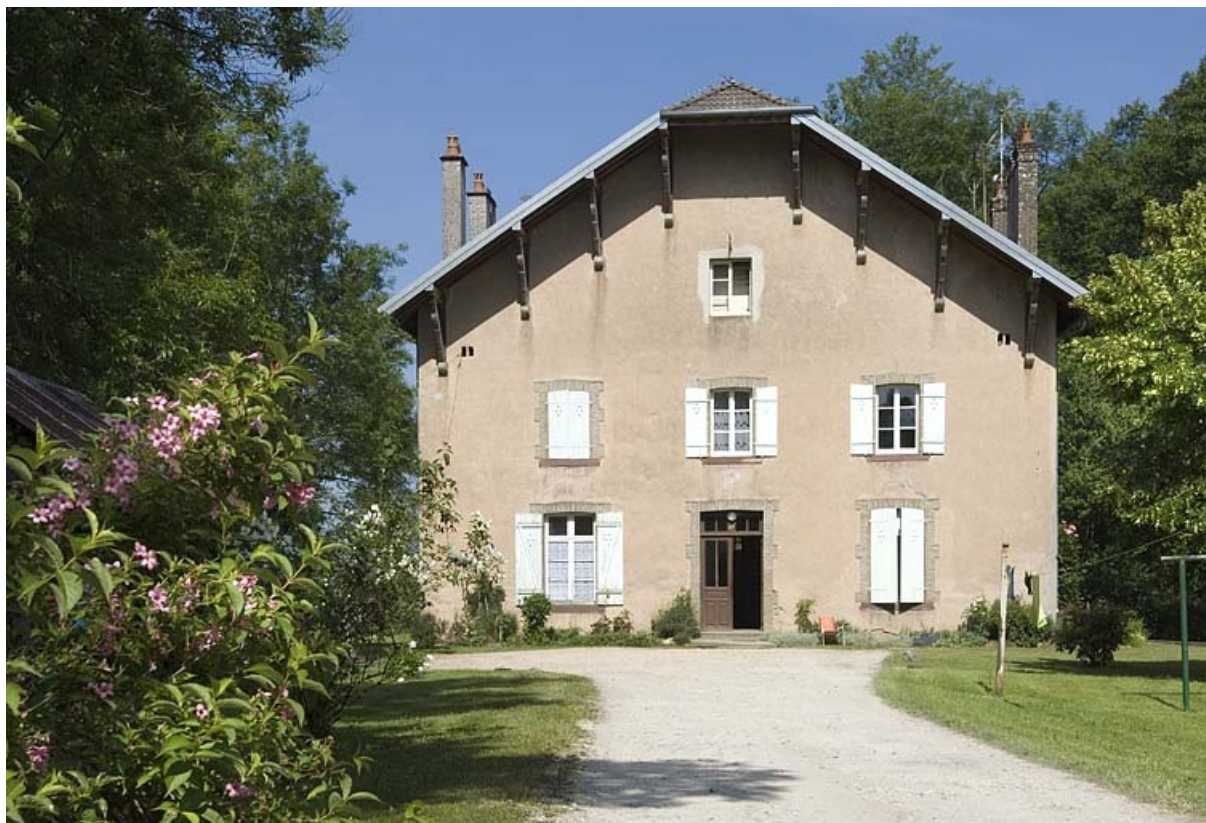
Façade ouest du logement.