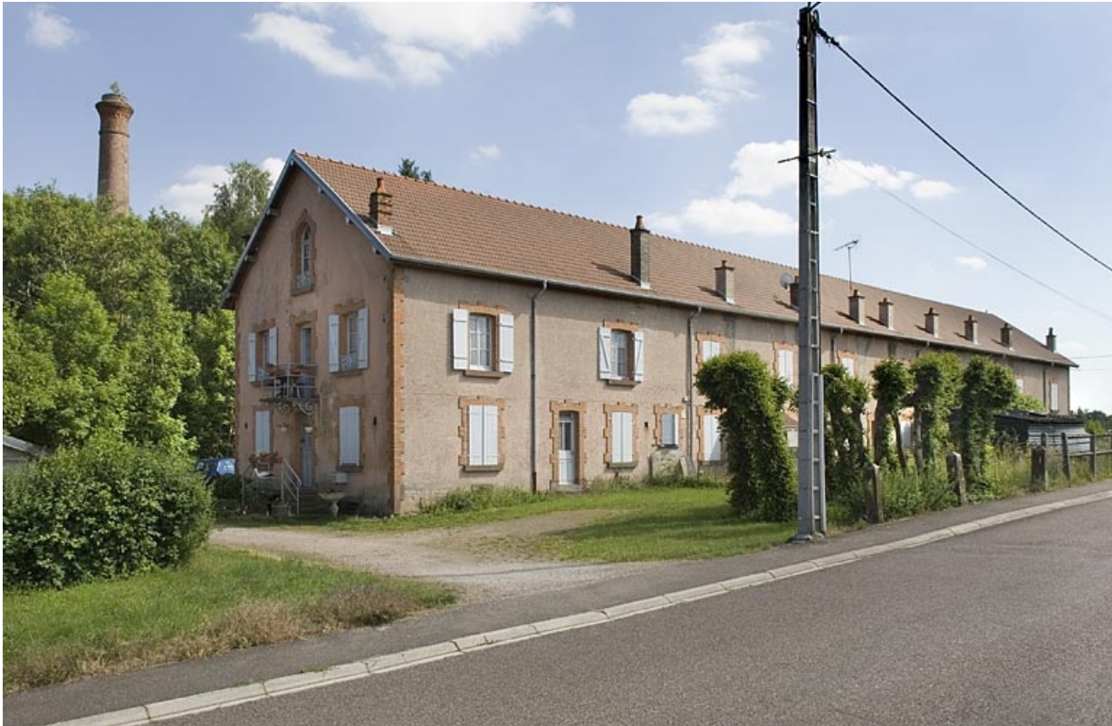
Logement ouvrier dit cité Saint-Anne.