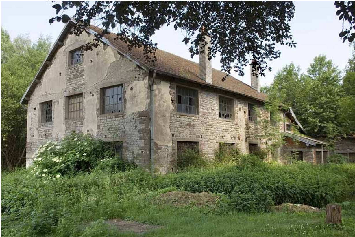
Bureau (?) depuis l'ouest.