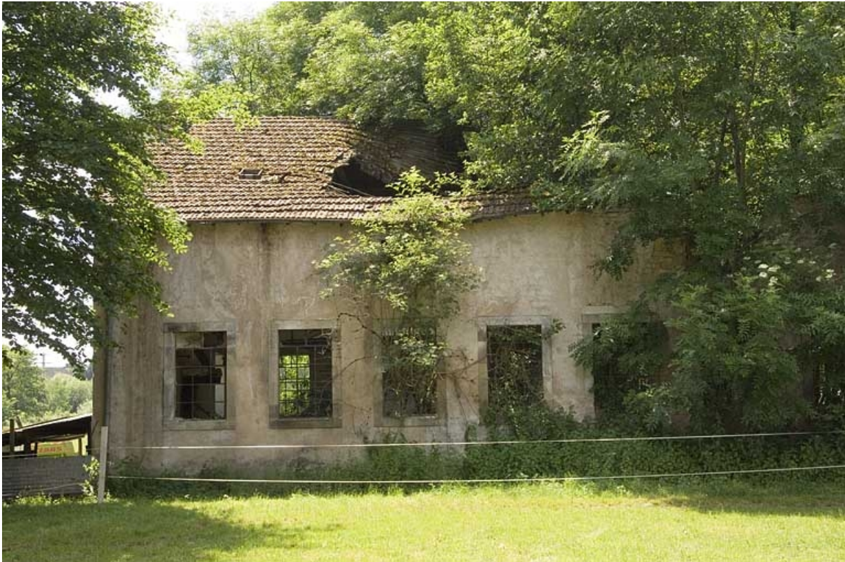
Atelier de fabrication en ruines.