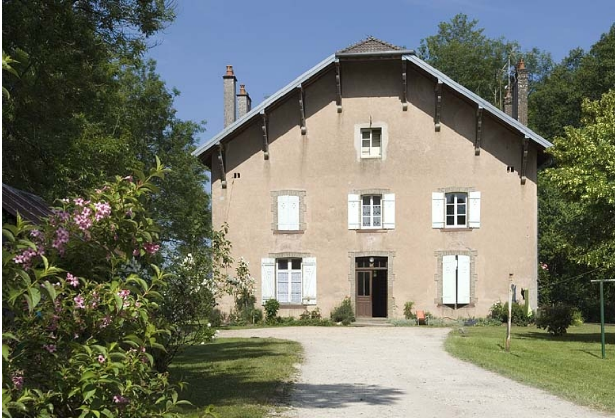
Façade ouest du logement.