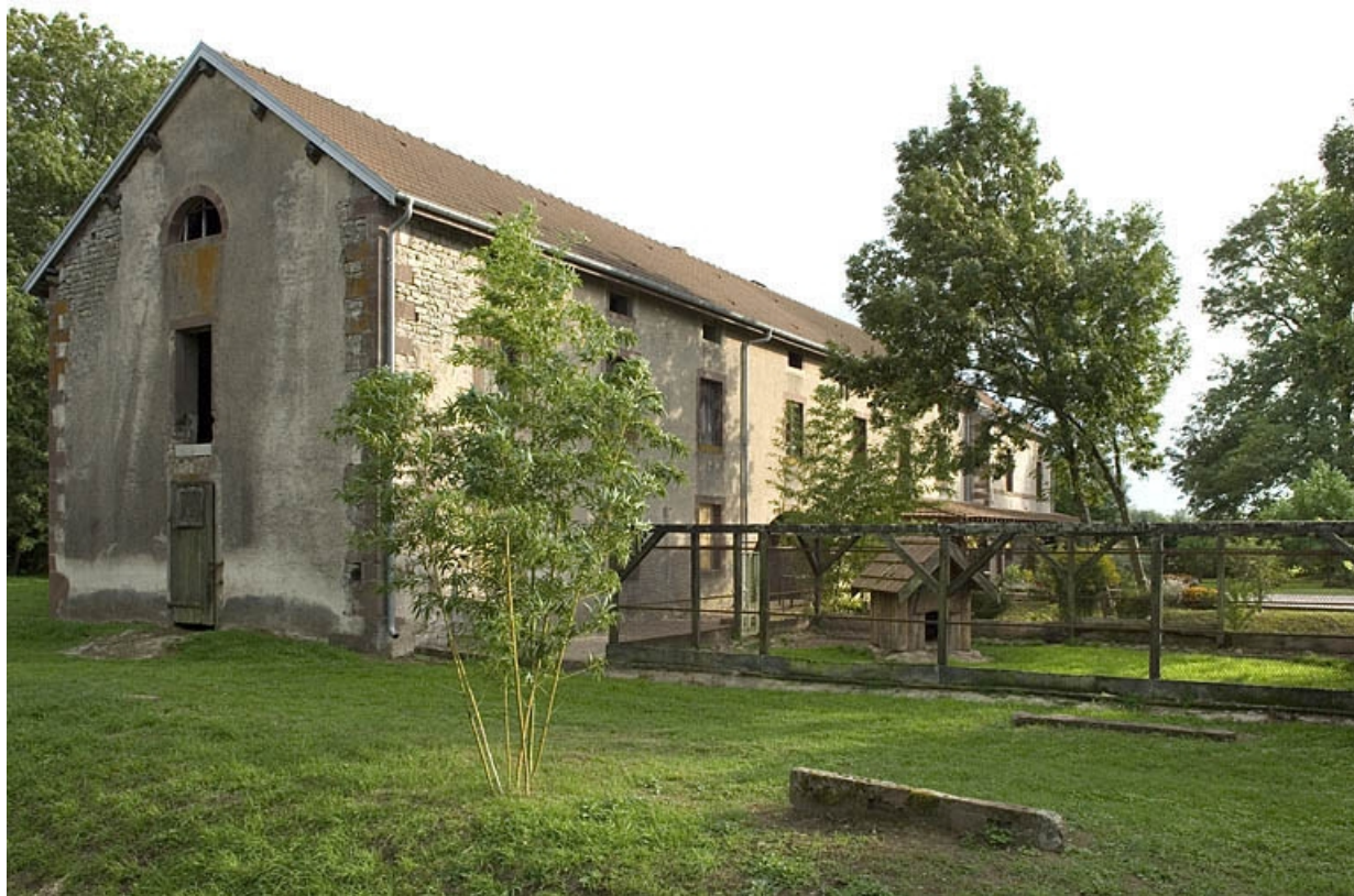
Vue d'ensemble, de trois quarts.

70, Saint-Loup-sur-Semouse, 41 avenue d' Augrogne