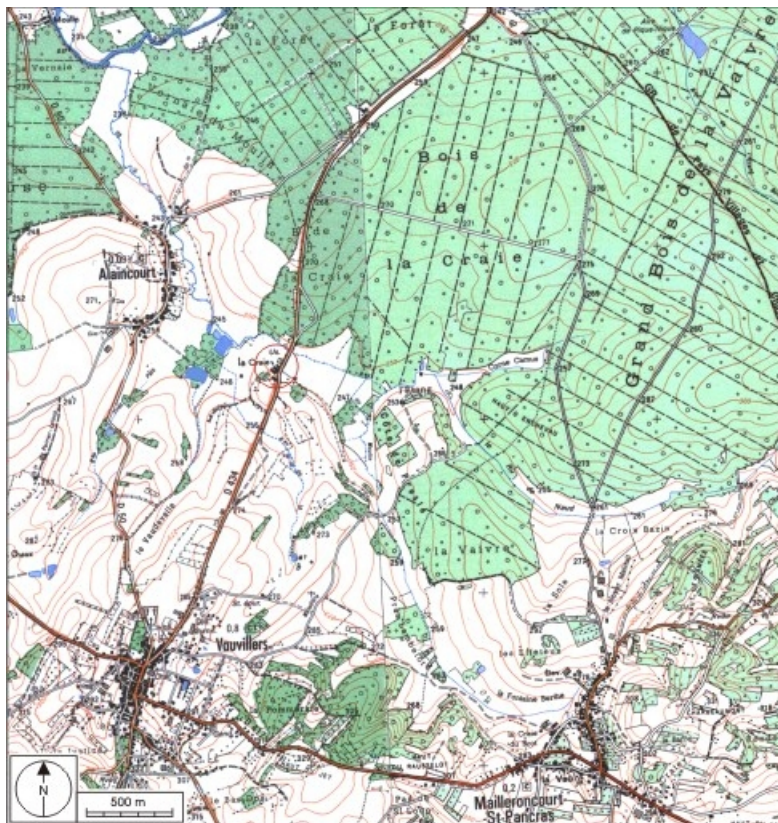
Carte de localisation. Carte topographique au 1:25000, I.G.N., Monthureux-sur-Saône, 3319 E. SCAN 25 © IGN - 2008, Licence n°2008CISE29-68.