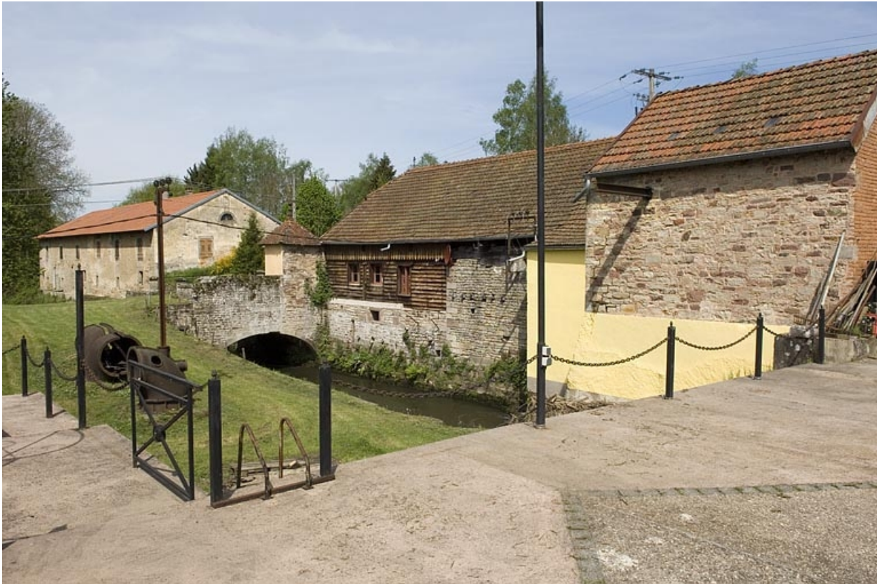
Vue sur le canal de fuite et les bâtiments rive droite.