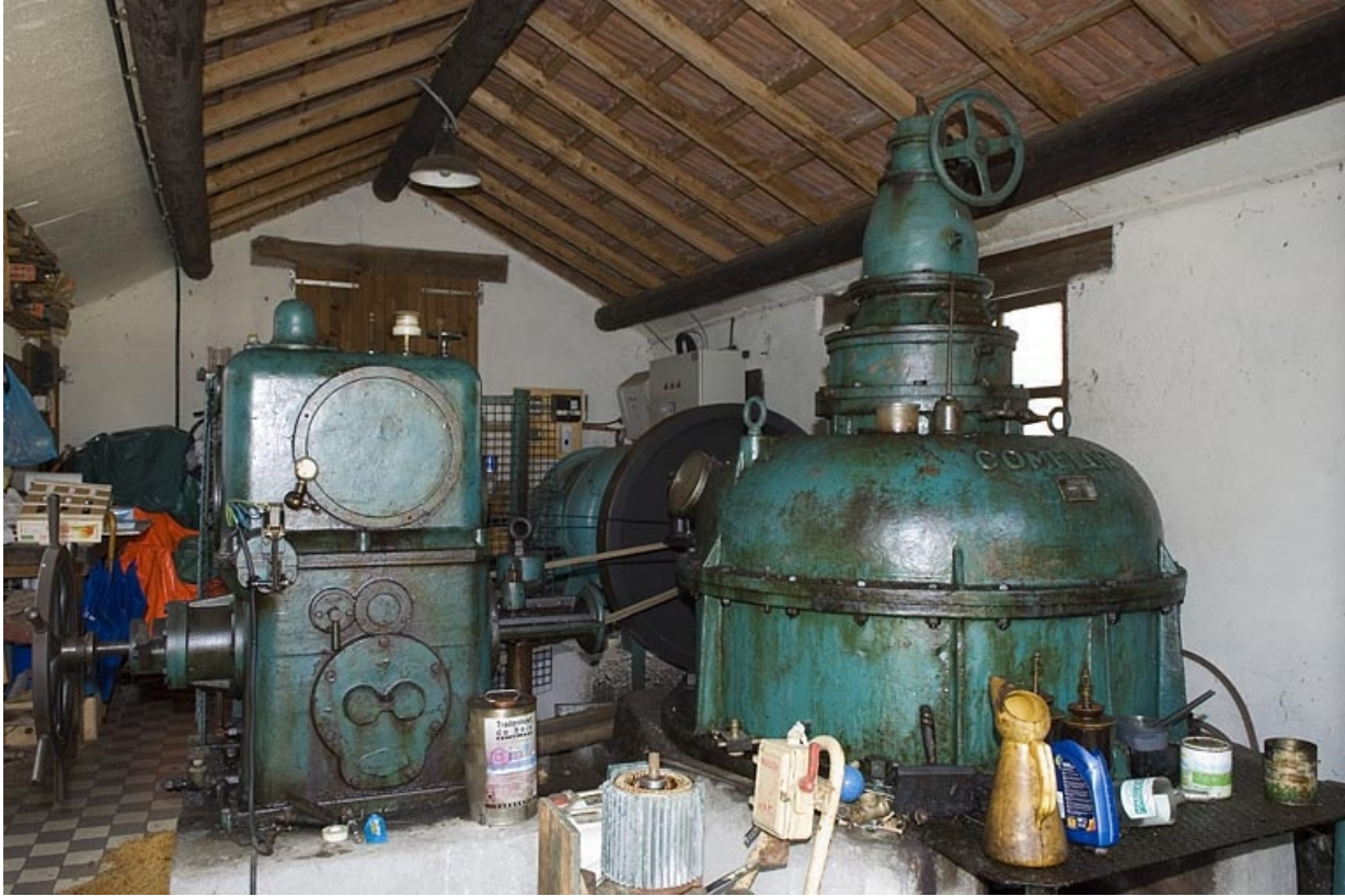
Intérieur de la salle des machines (sud). Turbine Dumont et multiplicateur Comelor. 70, Pont-du-Bois, lieudit : la Forge