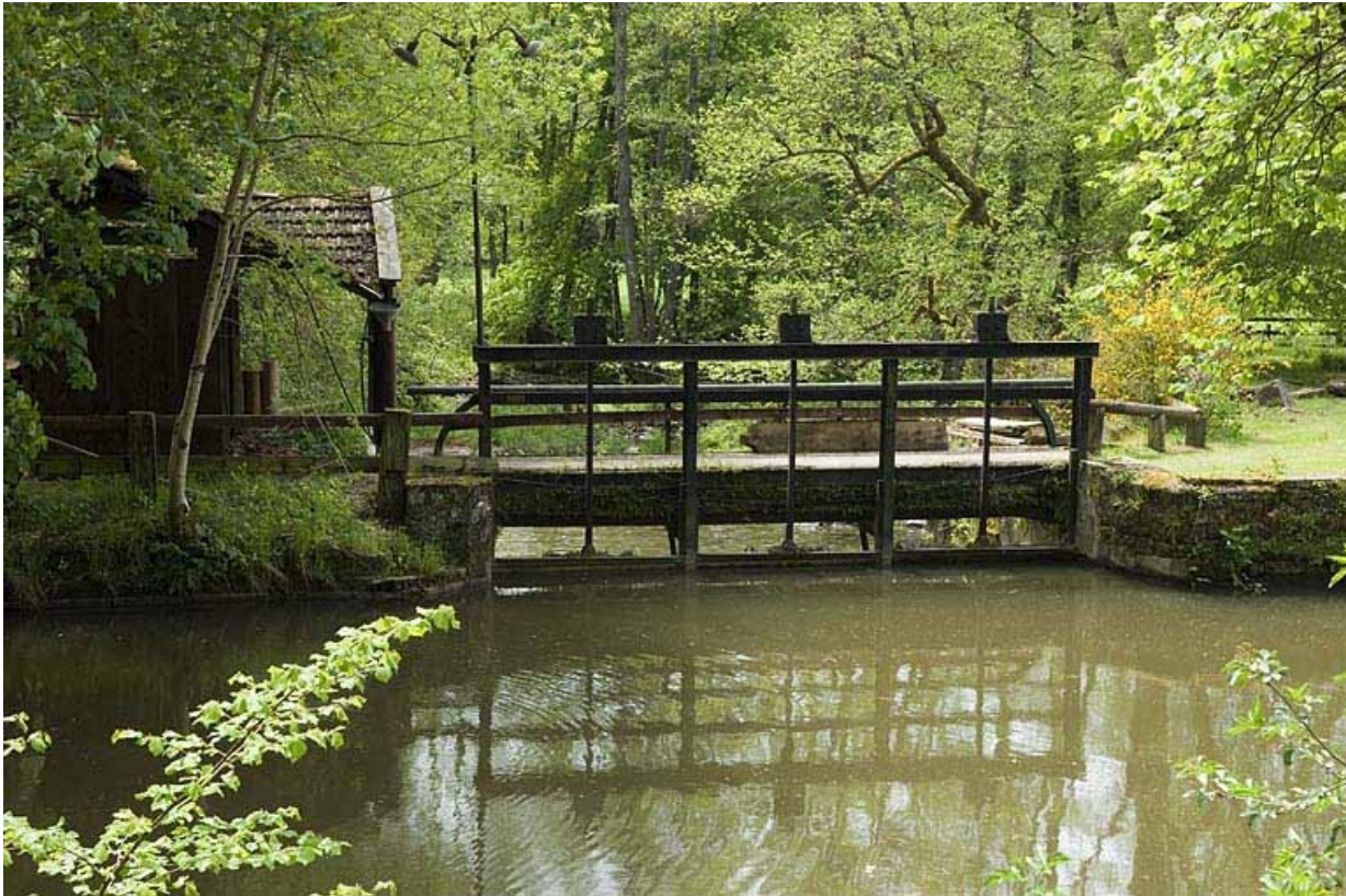
Vannes de décharge sur le bief d'aménée.