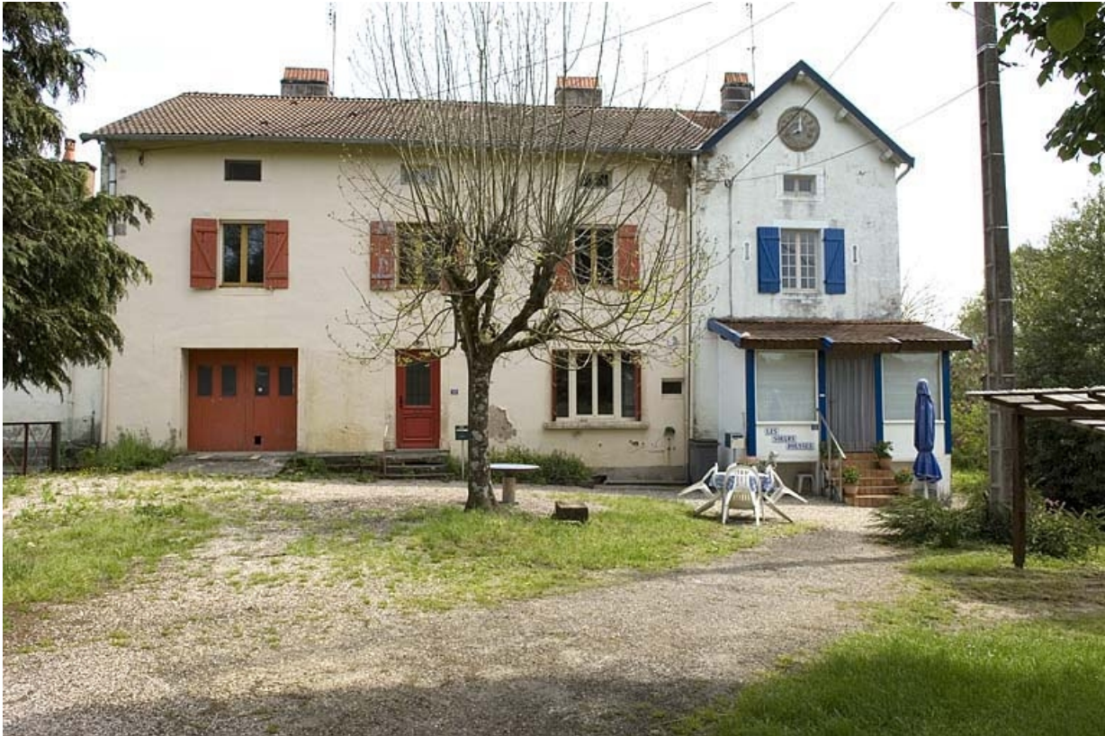
Logement de la centrale hydroélectrique.