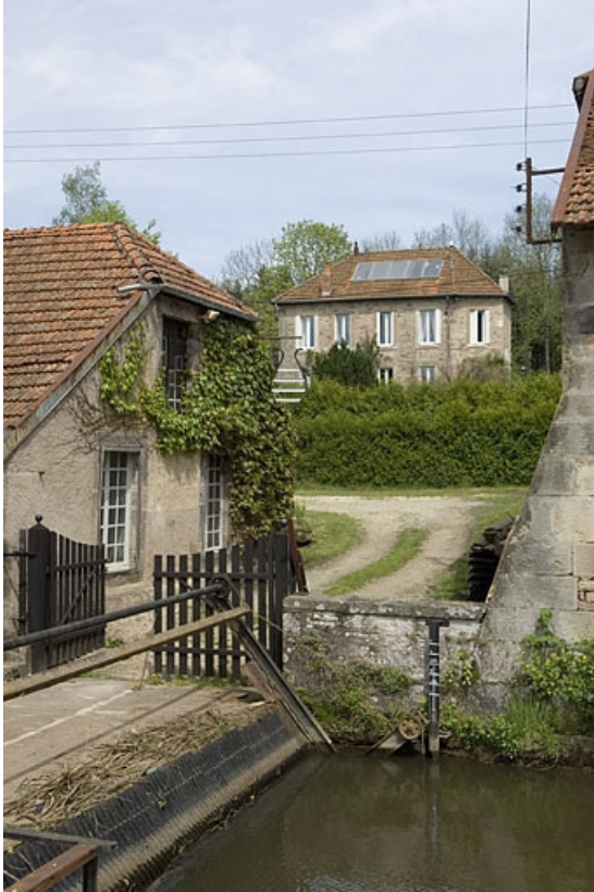
Logement patronal vu depuis le sud.