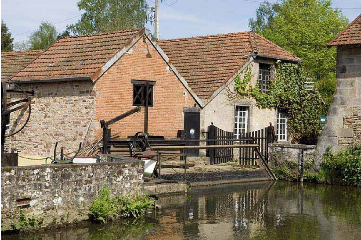
Salle des machines (nord).