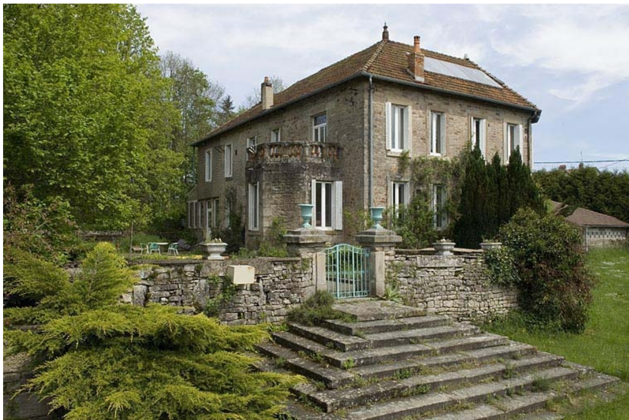
Logement patronal vu de trois quarts.