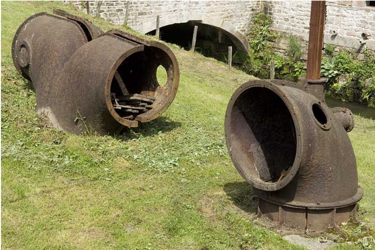
Extrémités de conduites forcées (déposées).