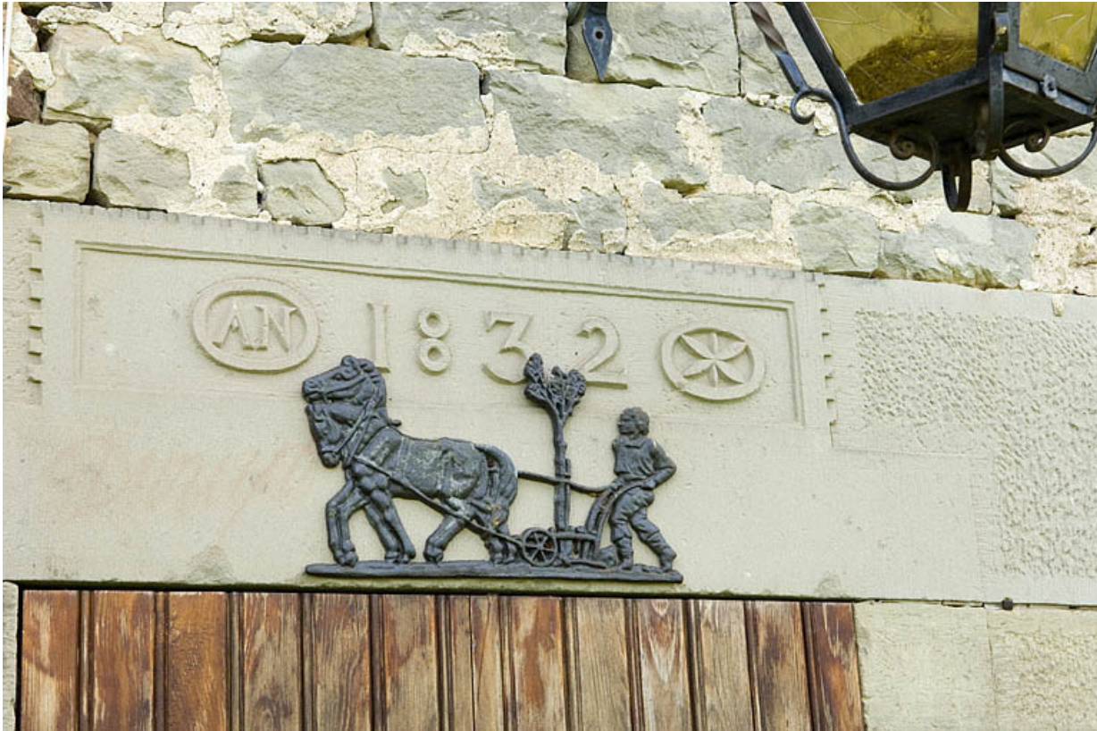
Logement ouvrier collectif (est). Détail d'un linteau.