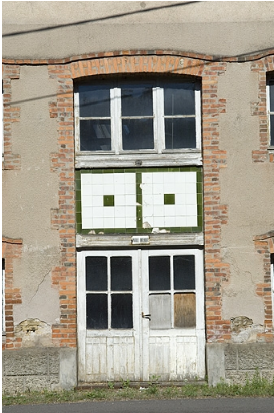
Façade sur rue. Détail de la travée centrale.