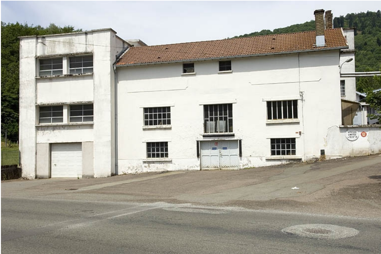
Façade sur la rue de France.