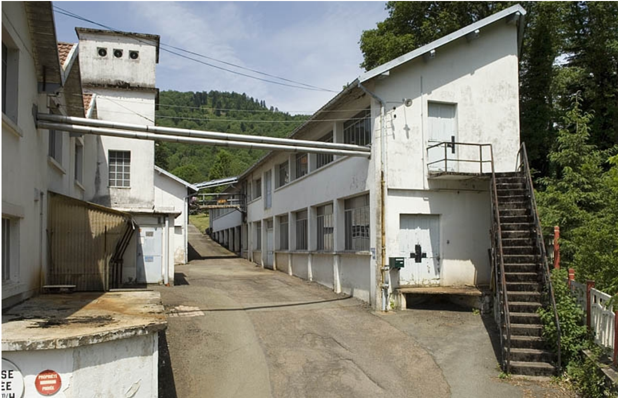
Vue depuis l'entrée.