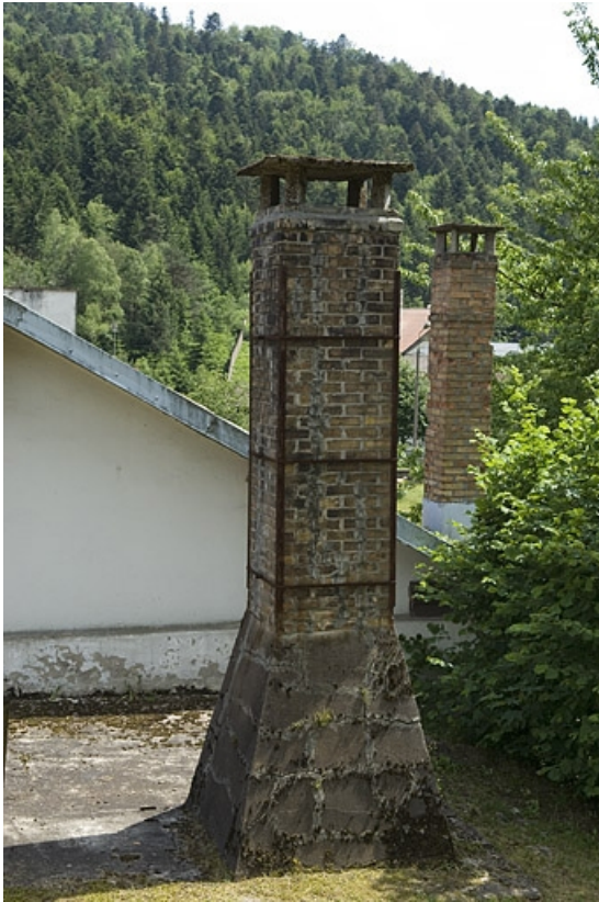
Détail d'une cheminée.