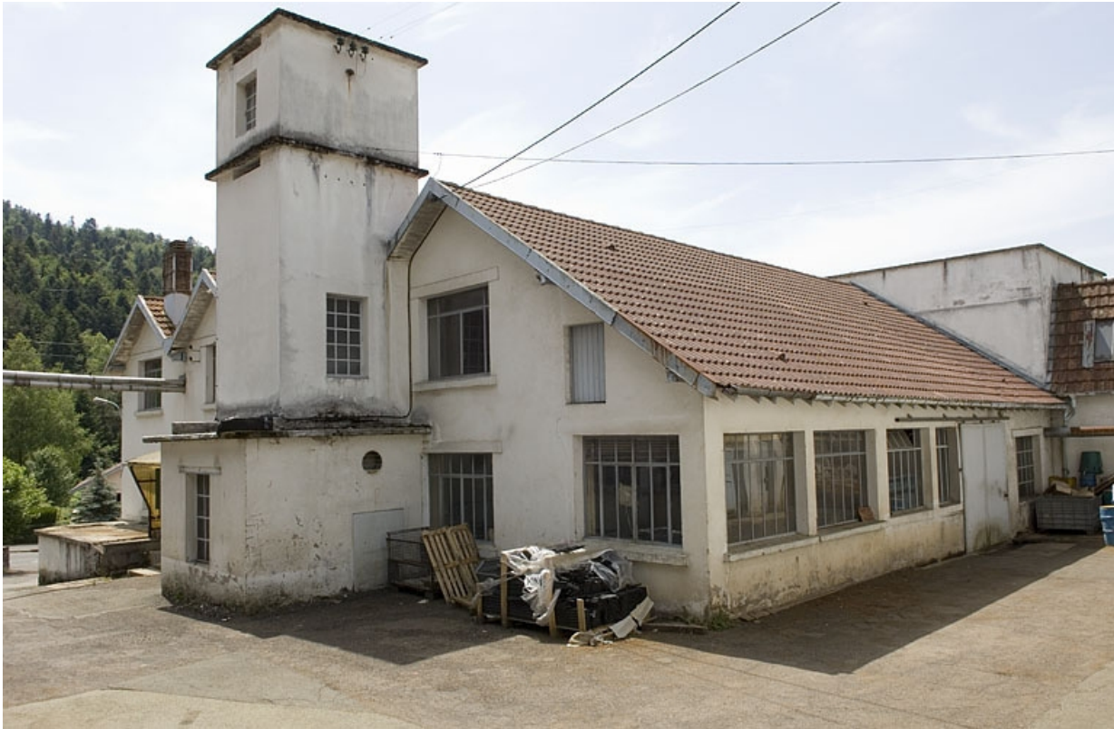
Vue depuis la cour.