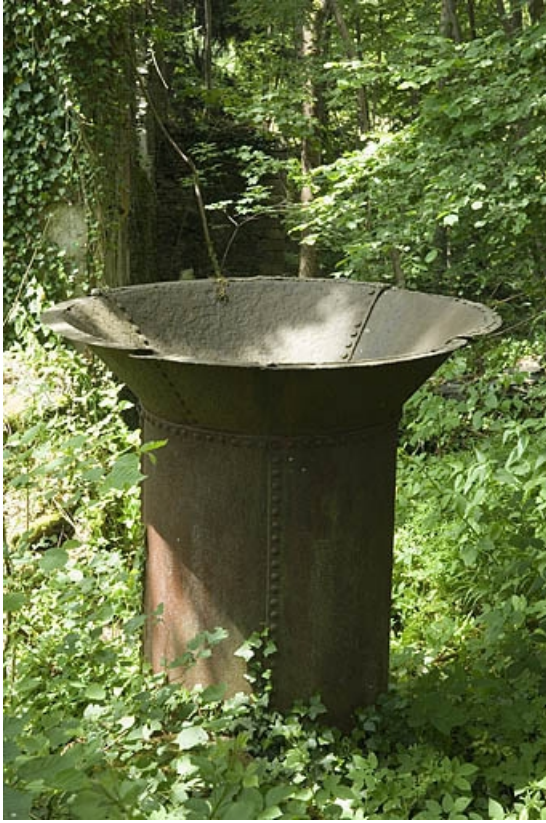
Couronnement métallique d'une cheminée en tôle.