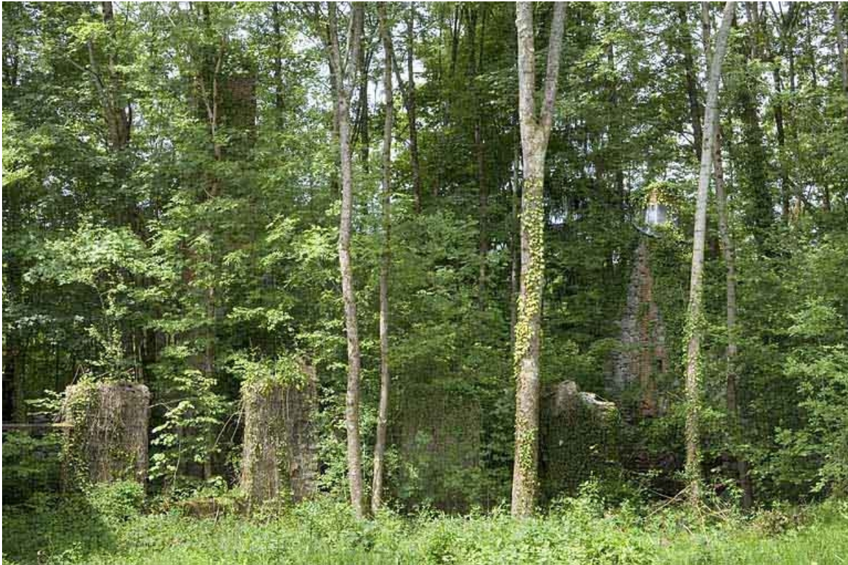
Vestiges de l'atelier de papeterie envahis par la végétation.