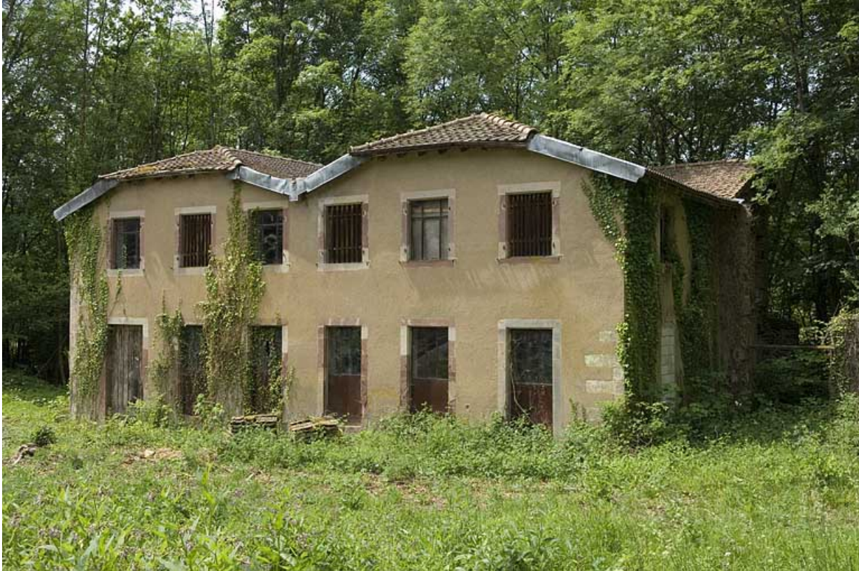
Bâtiment à usage indéterminé (logement, bureau ?).