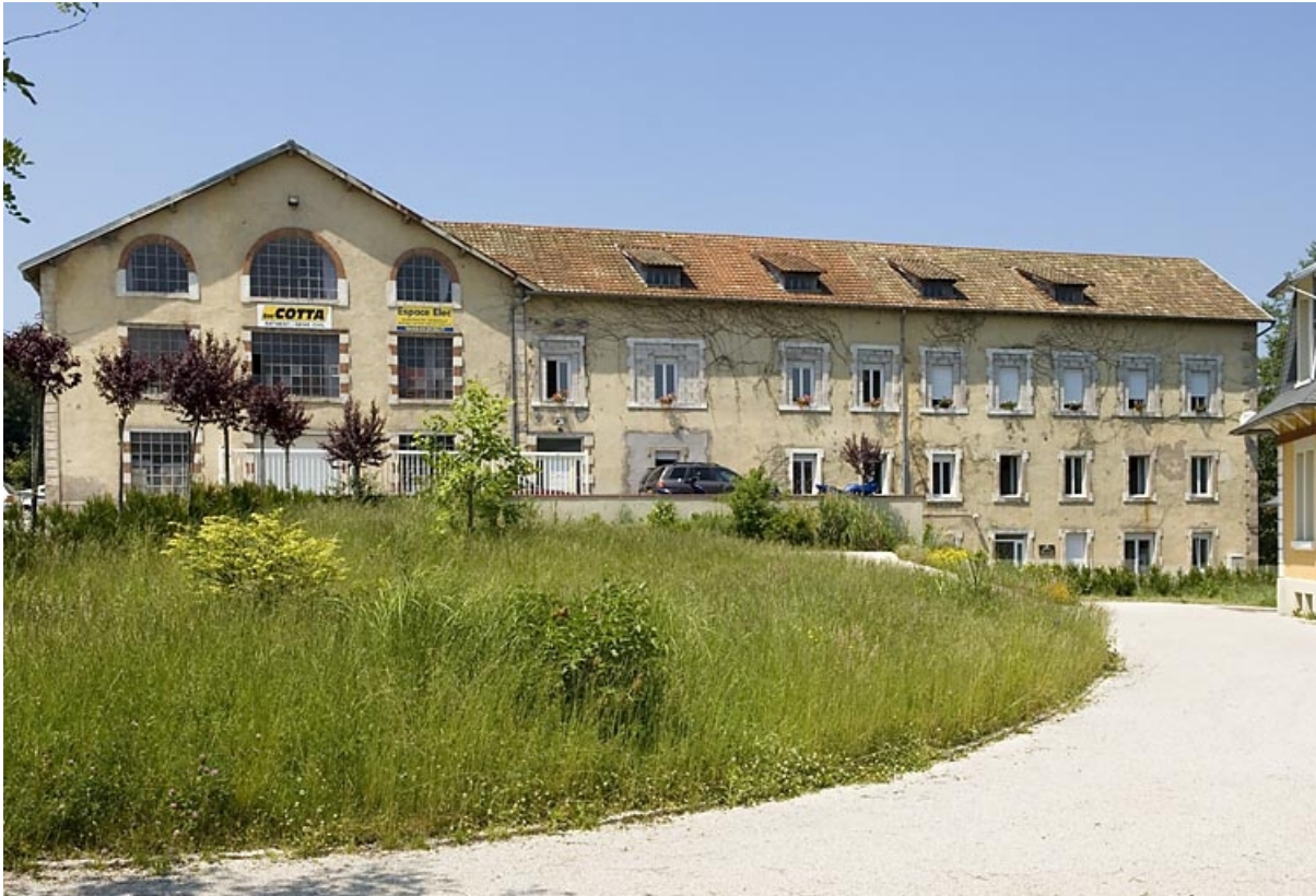
Vue d'ensemble depuis l'entrée.