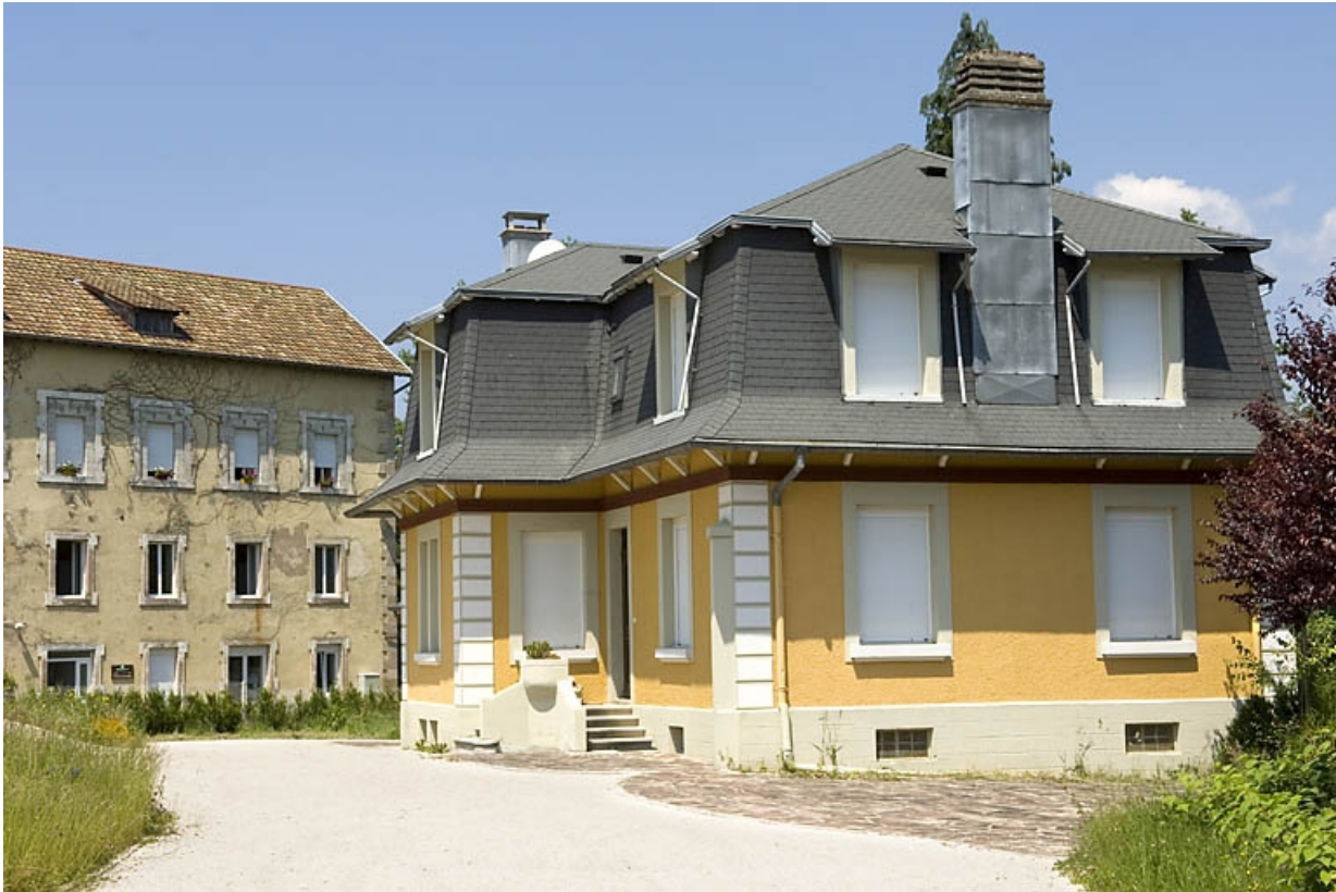
Ancien atelier de fabrication et logement patronal.