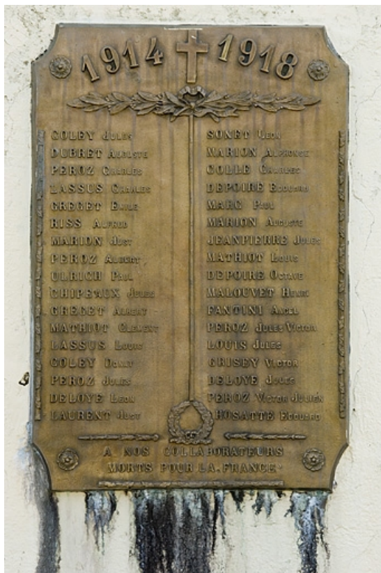
Plaque apposée sur l'atelier de fabrication.

70, Plancher-Bas, 36 rue Louis Pasteur, lieudit : le Mont