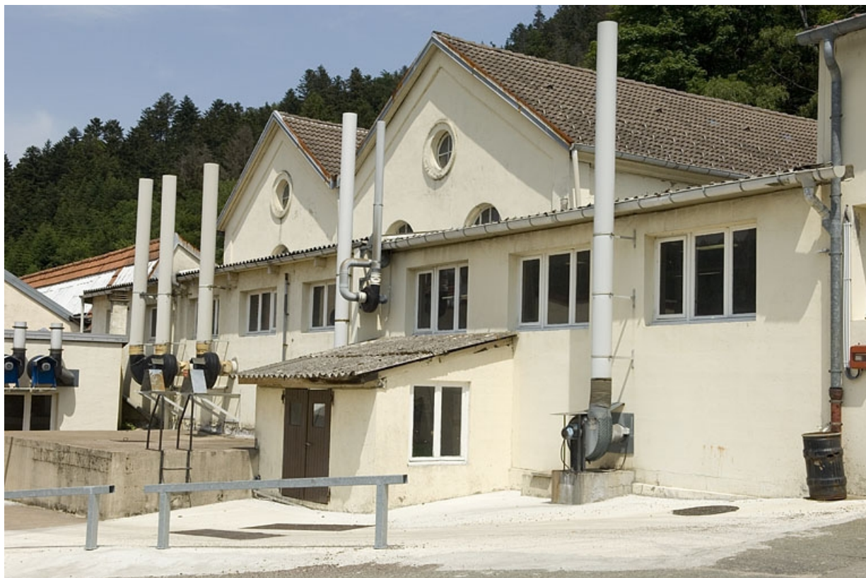
Anciennes chaufferie et salle des machines.

70, Plancher-Bas, 36 rue Louis Pasteur, lieudit : le Mont