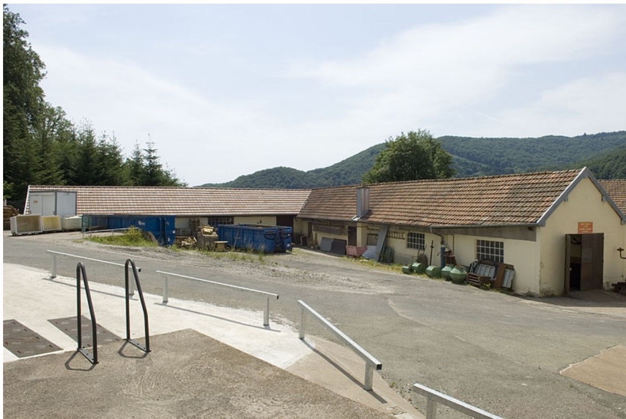
Anciens magasin industriel et menuiserie.

70, Plancher-Bas, 36 rue Louis Pasteur, lieudit : le Mont