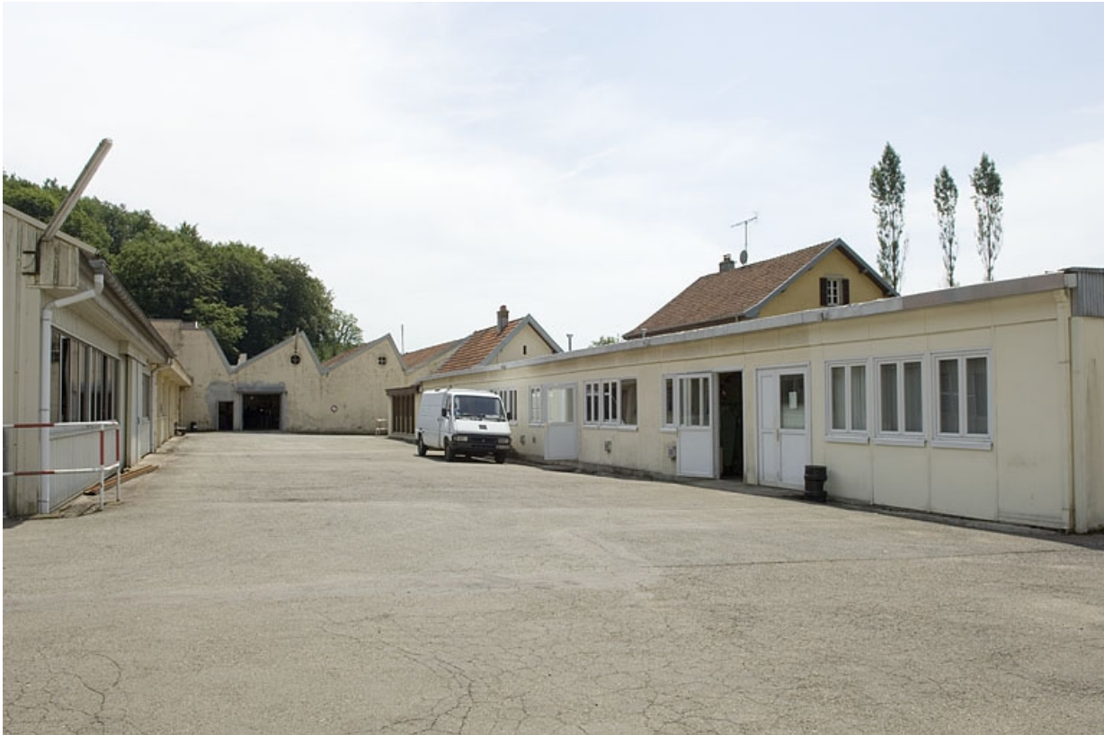
Ateliers de fabrication vus depuis le nord de la cour.

70, Plancher-Bas, 36 rue Louis Pasteur, lieudit : le Mont