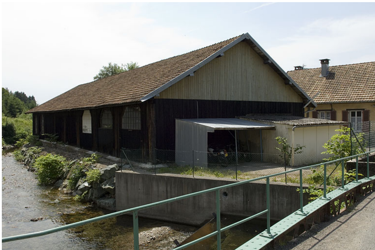
Magasin industriel (rive droite du Breuchin).

70, Plancher-Bas, 36 rue Louis Pasteur, lieudit : le Mont