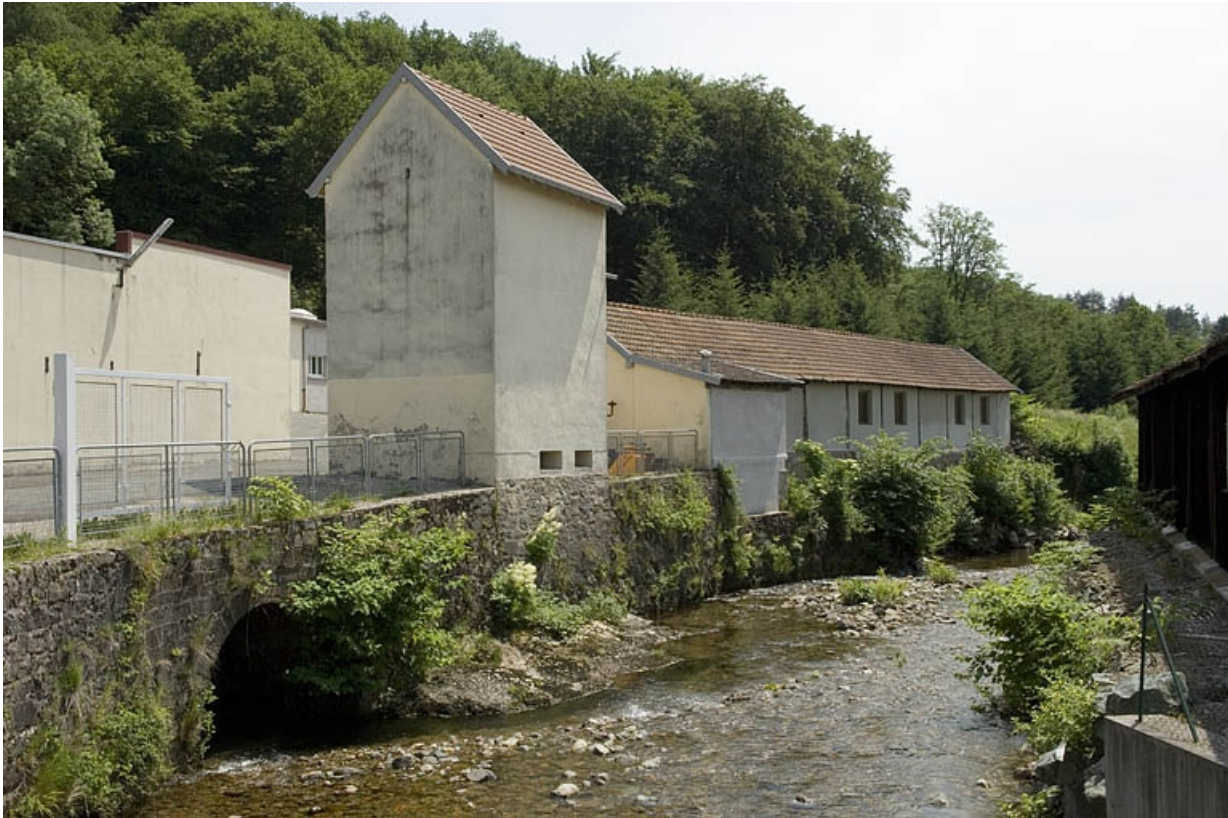
Bâtiments industriels depuis le pont d'accès.

70, Plancher-Bas, 36 rue Louis Pasteur, lieudit : le Mont