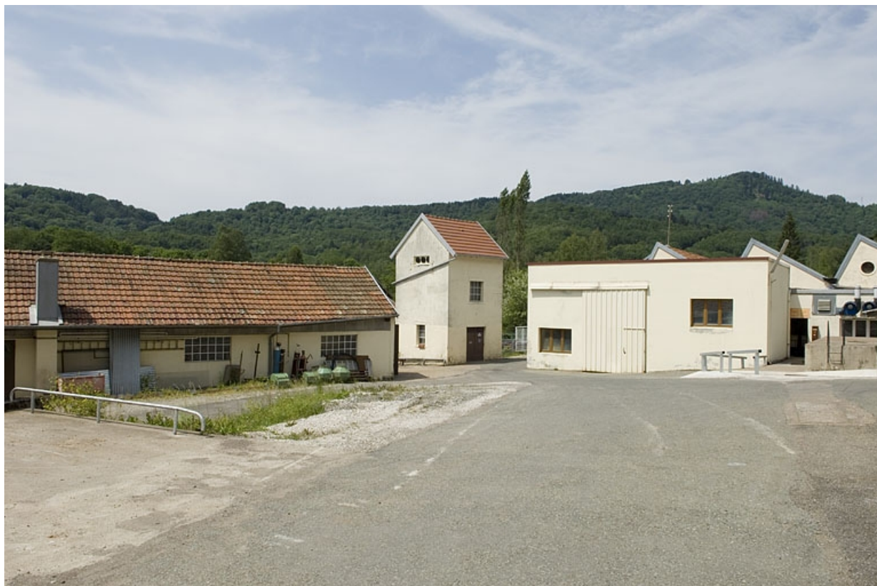
Magasin industriel et transformateur vus depuis le sud.

70, Plancher-Bas, 36 rue Louis Pasteur, lieudit : le Mont