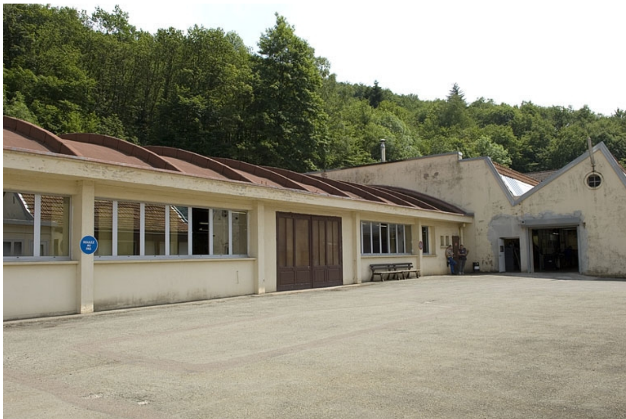
Atelier de fabrication à voûte en berceau segmentaire.

70, Plancher-Bas, 36 rue Louis Pasteur, lieudit : le Mont