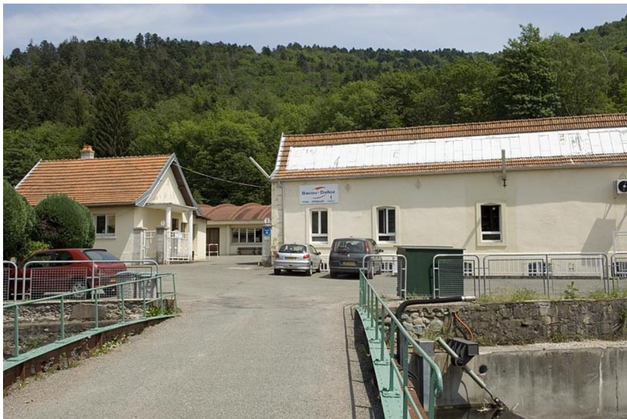
Vue d'ensemble depuis l'entrée du site.

70, Plancher-Bas, 36 rue Louis Pasteur, lieudit : le Mont