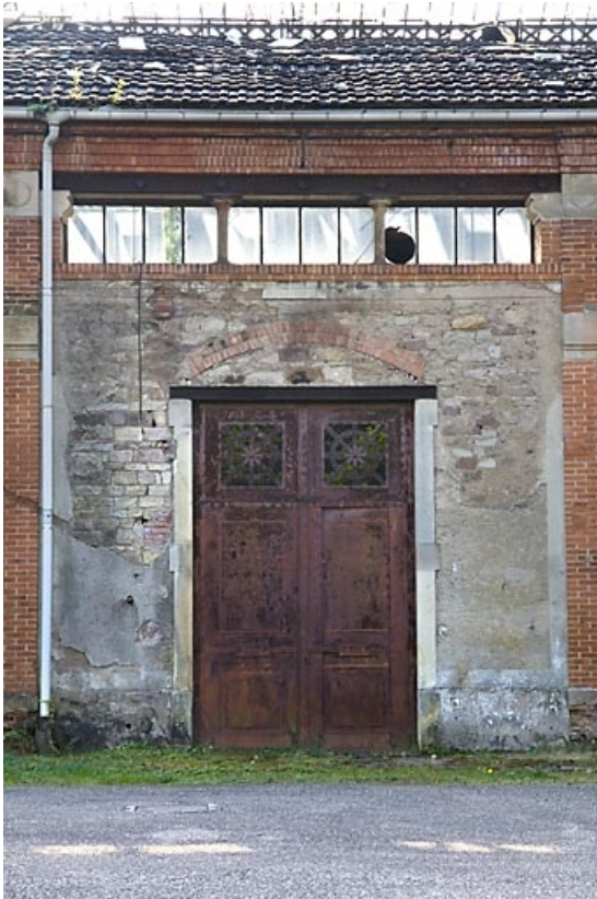
Façade antérieure. Détail d'une travée.