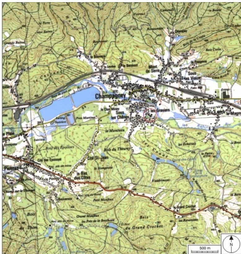
Carte de localisation. Carte topographique au 1:25000, I.G.N., Ballon d'Alsace, 3520 ET. SCAN 25 © IGN - 2008, Licence n°2008CISE29-68.