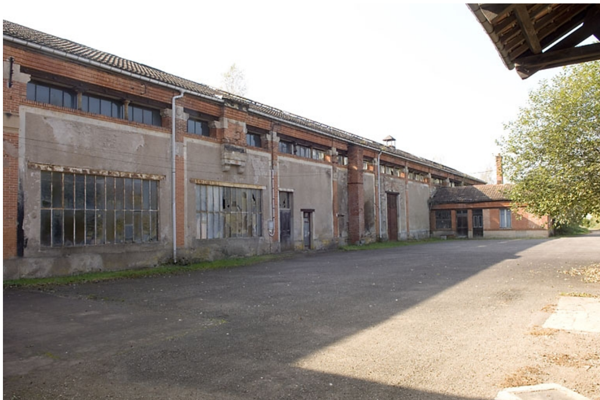
Façade antérieure depuis l'est.