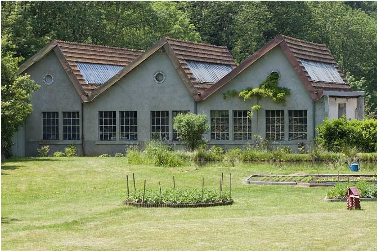
Pignons est de l'atelier de fabrication.