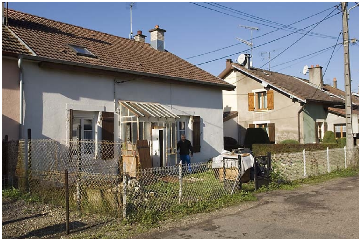
Façade est d'une maison.