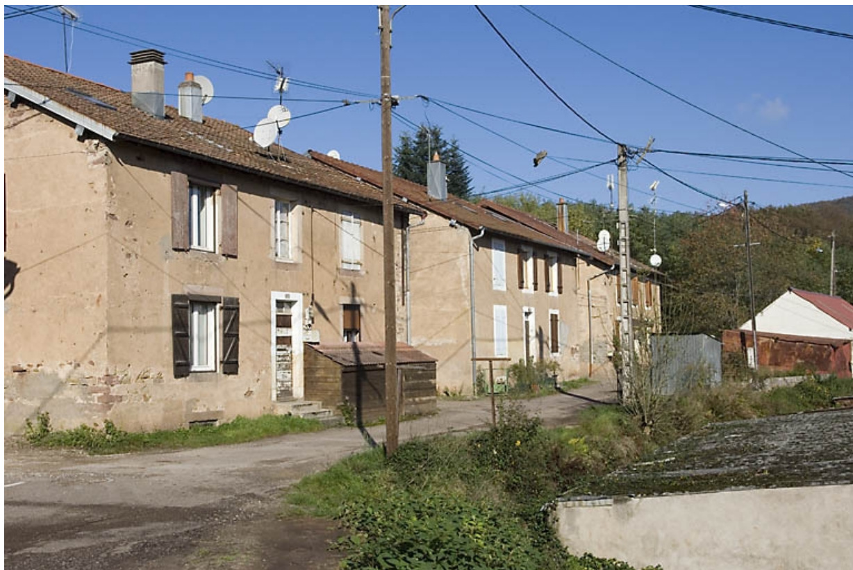
Façades sur rue des maisons d'ouvriers.