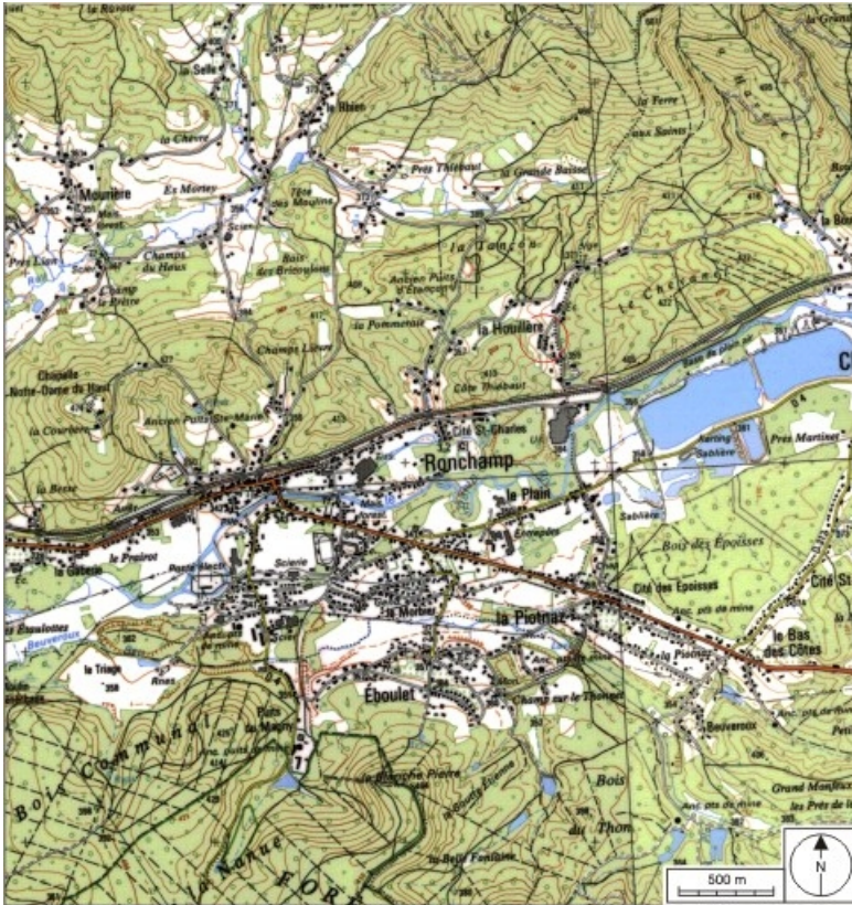
Carte de localisation. Carte topographique au 1:25000, I.G.N., Ballon d'Alsace, 3520 ET. SCAN 25 © IGN - 2008, Licence n°2008CISE29-68.