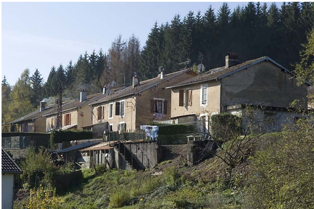
Vue d'ensemble depuis le nord-est.