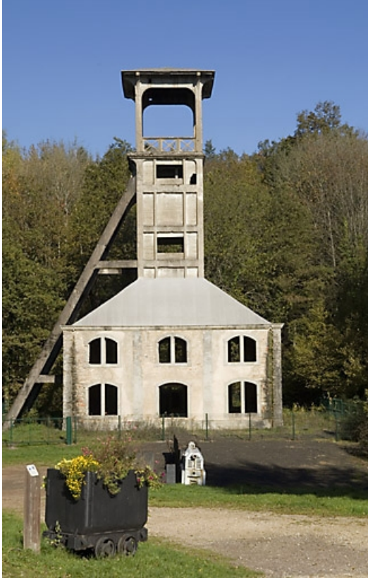
Le chevalement. Vue de face.