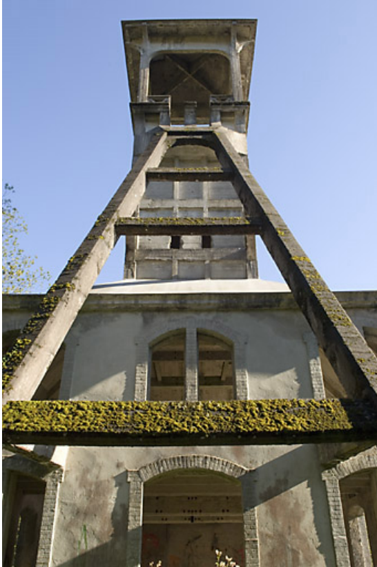
Le chevalement. Vue en contre-plongée.