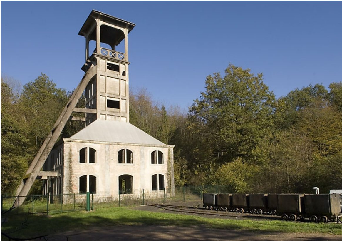
Le chevalement. Vue d'ensemble depuis l'ouest.