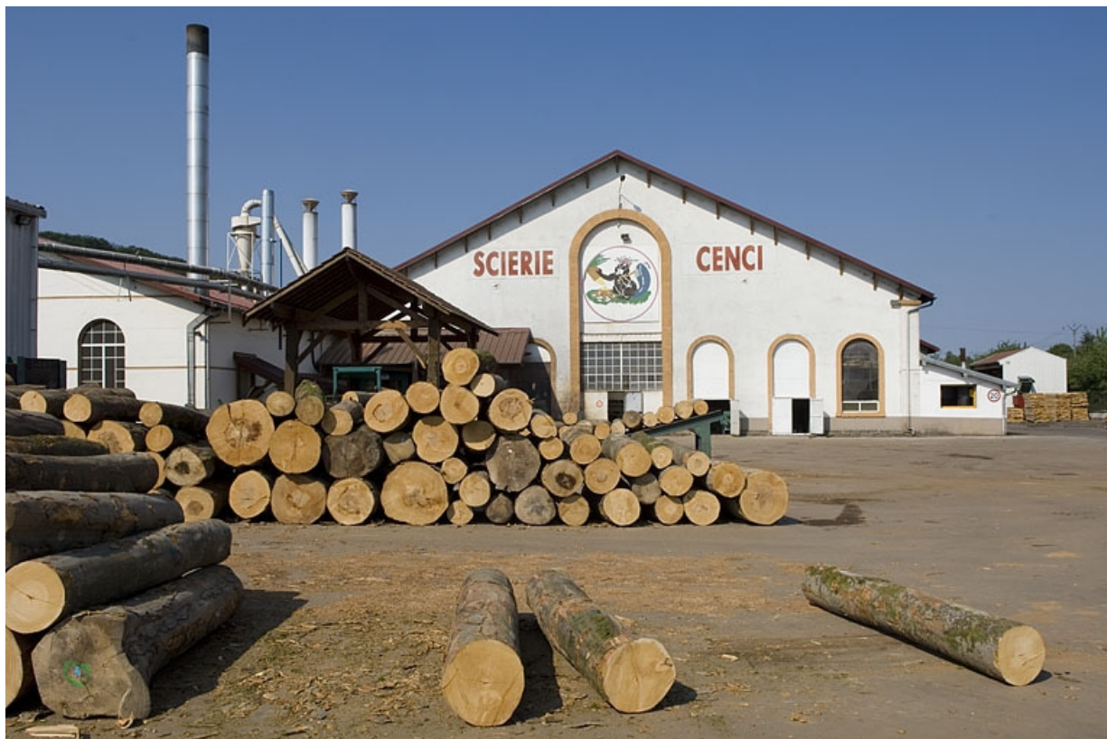
Pignons est des ateliers de fabrication.