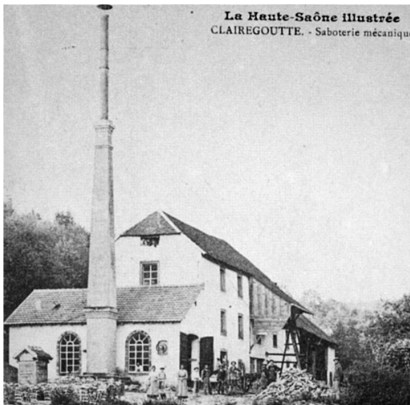
Clairegoutte. - Saboterie mécanique.

70, Clairegoutte, 3 à 9 rue de la Soierie