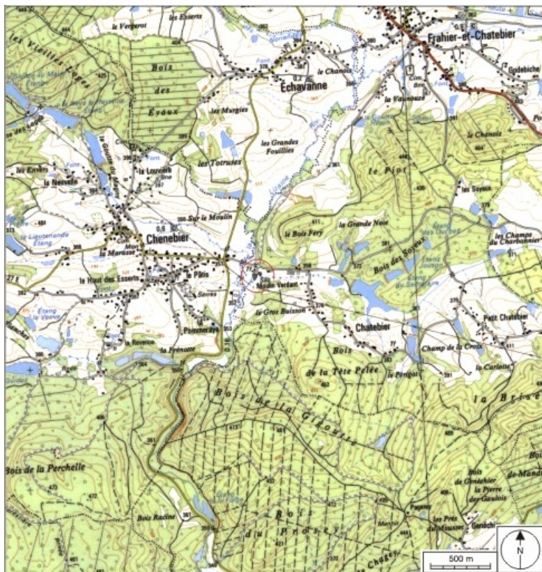
Carte de localisation. Carte topographique au 1:25000, I.G.N., Belfort, 3621 OT. SCAN 25, Licence n°2008CISE29-68. 70, Frahier-et-Chatebier, 33, 35 rue du Moulin, lieudit : le Moulin