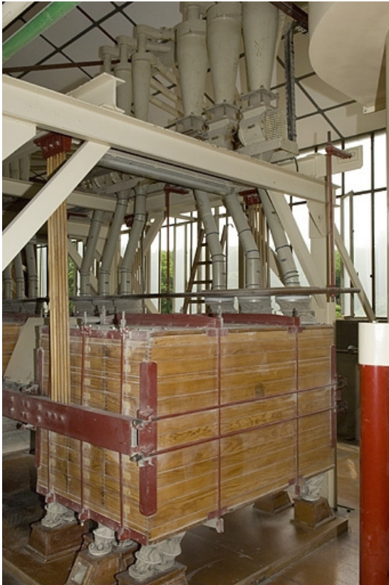
Détail d'un plansichter.

70, Frahier-et-Chatebier, 33, 35 rue du Moulin, lieudit : le Moulin