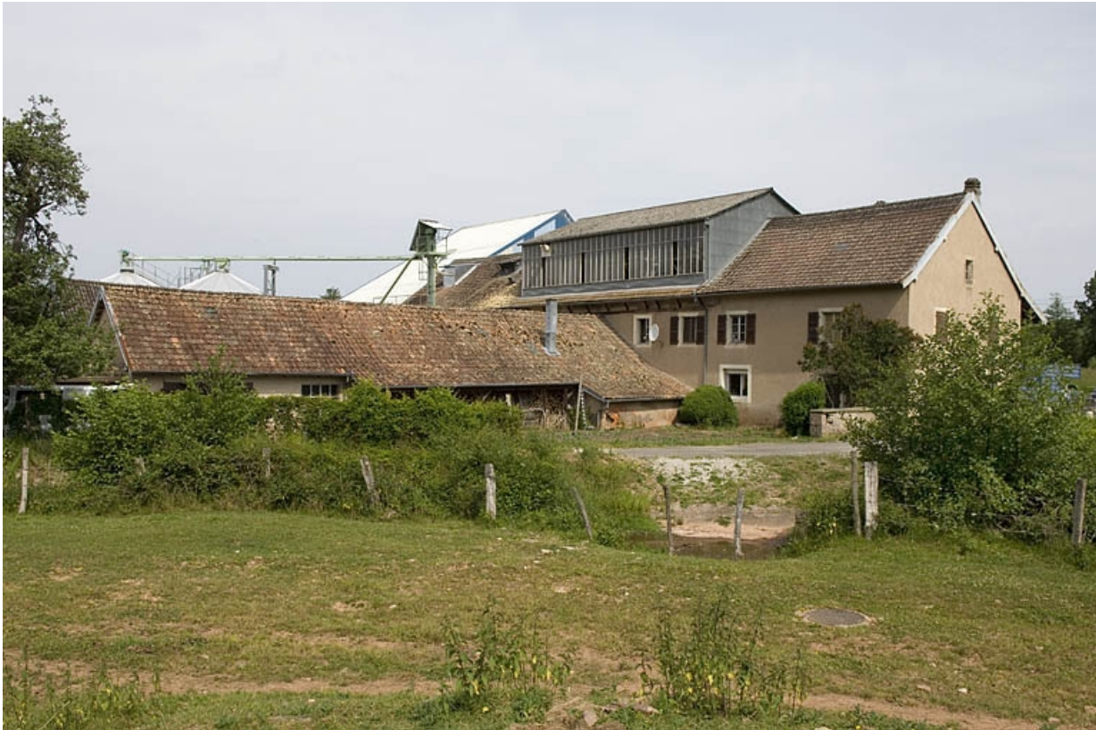
Atelier de la minoterie vu de trois quarts arrière.

70, Frahier-et-Chatebier, 33, 35 rue du Moulin, lieudit : le Moulin