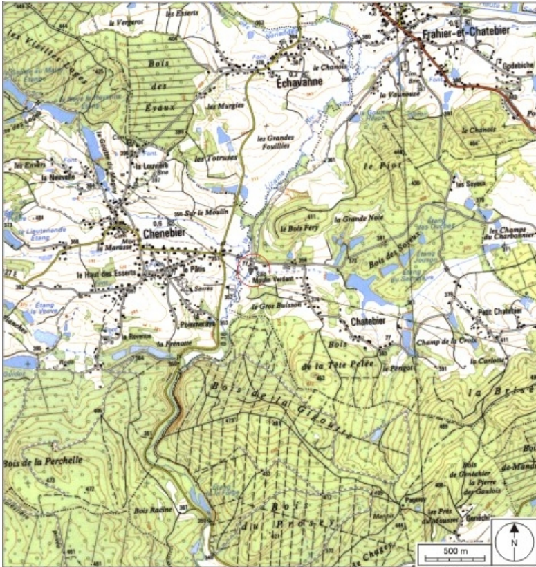
Carte de localisation. Carte topographique au 1:25000, I.G.N., Belfort, 3621 OT. SCAN 25, Licence n°2008CISE29-68. 70, Frahier-et-Chatebier, 33, 35 rue du Moulin, lieudit : le Moulin