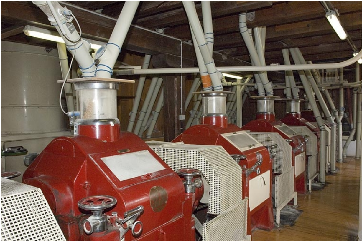
Les appareils à cylindres.

70, Frahier-et-Chatebier, 33, 35 rue du Moulin, lieudit : le Moulin