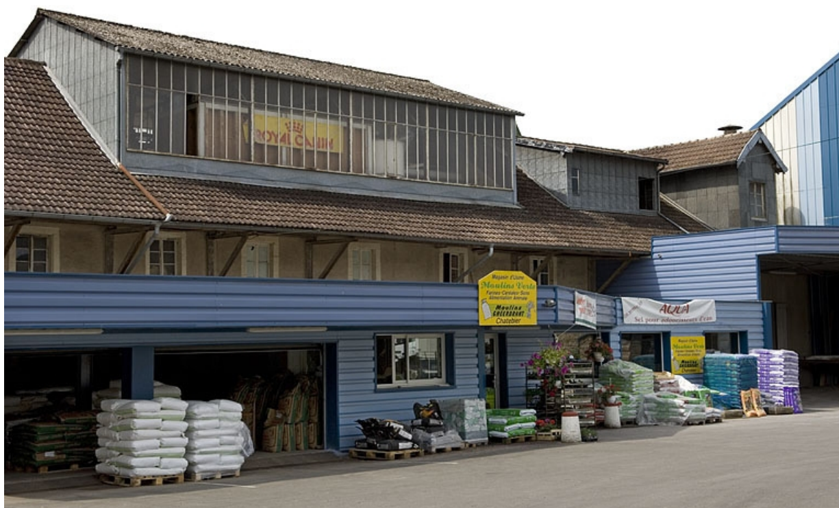
Façade antérieure de la minoterie.

70, Frahier-et-Chatebier, 33, 35 rue du Moulin, lieudit : le Moulin