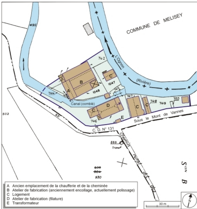
Plan-masse et de situation. Extrait du plan cadastral numérisé, 2006, section F, 1:1000. 70, Saint-Barthélemy, lieudit : sous le Mont de Vannes