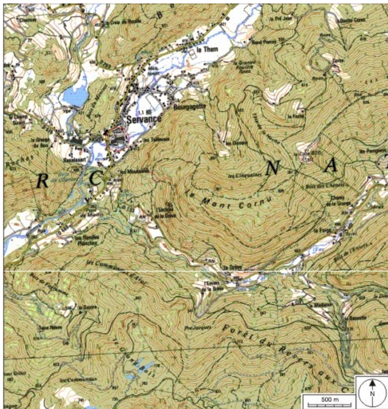
Carte de localisation. Carte topographique au 1:25000, I.G.N., Ballon d'Alsace, 3520 E. SCAN 25 © IGN - 2008, Licence n°2008CISE29-68.

70, Servance, 16 avenue du Général de Gaulle