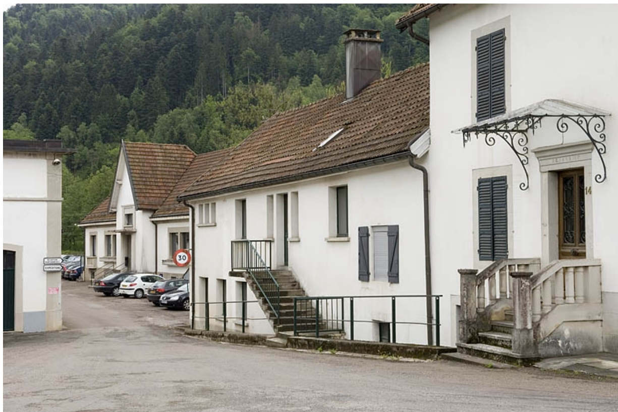
Les bureaux vus depuis l'entrée.

70, Servance, 16 avenue du Général de Gaulle