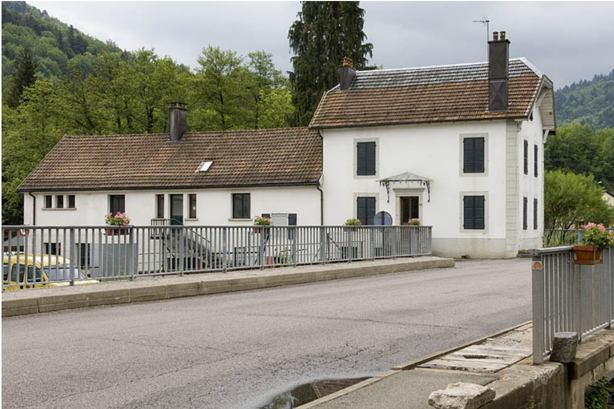
Le bâtiment de l'ancien moulin.

70, Servance, 16 avenue du Général de Gaulle