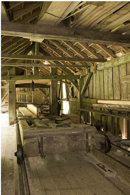
Intérieur de l'atelier.