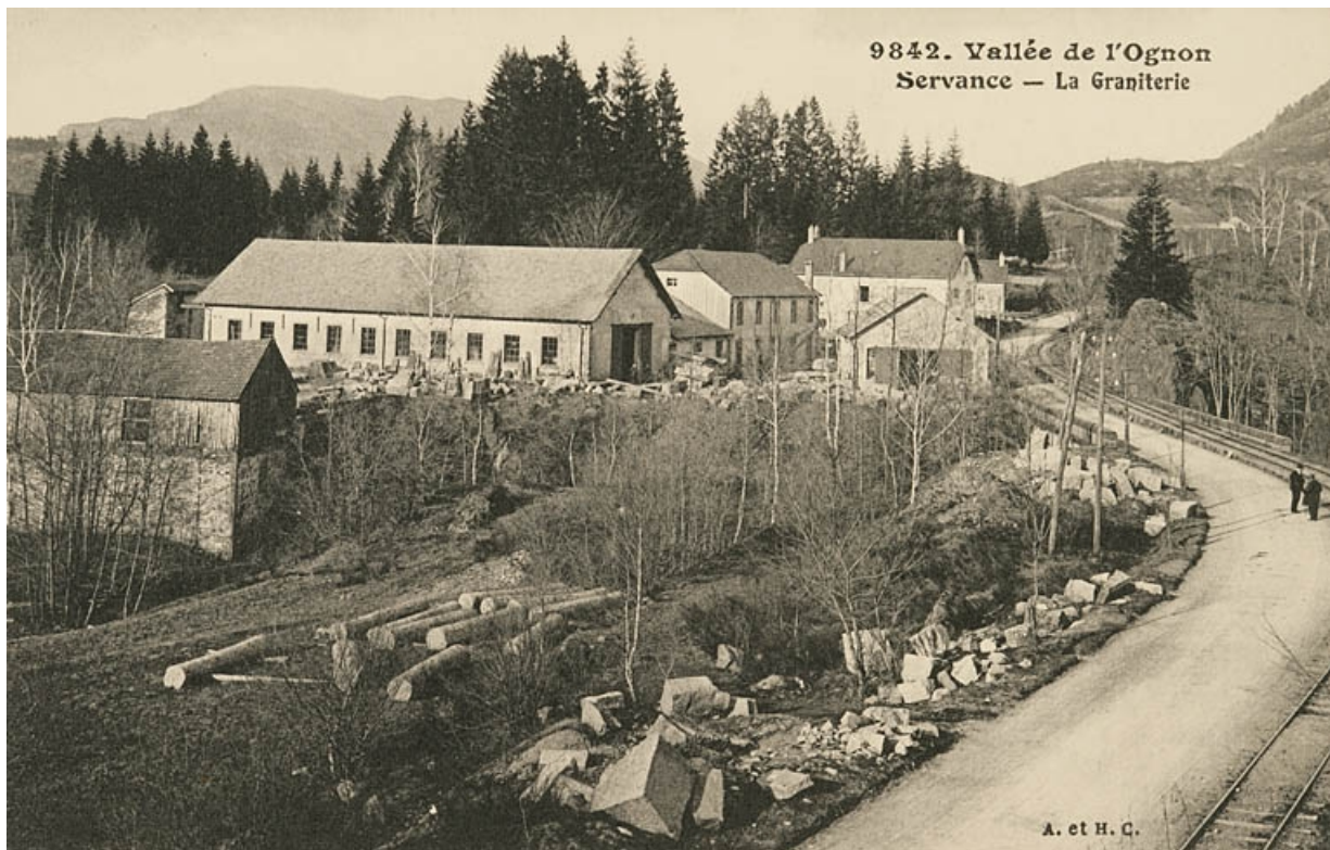
Vallée de l'Ognon. Servance - La graniterie.