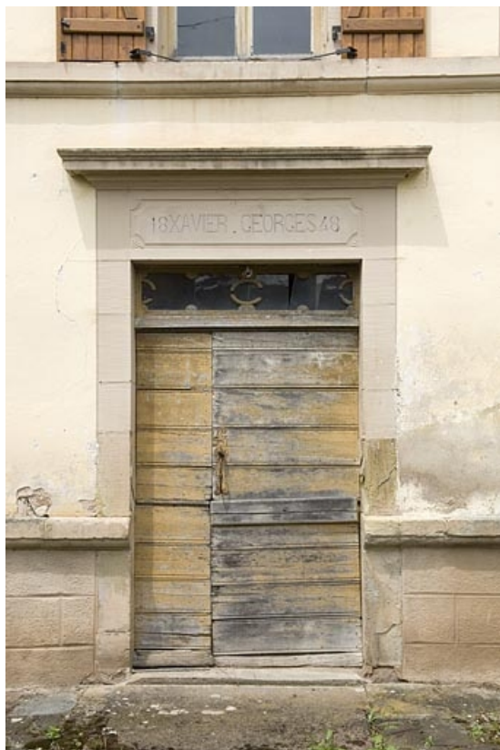
Porte du logement.