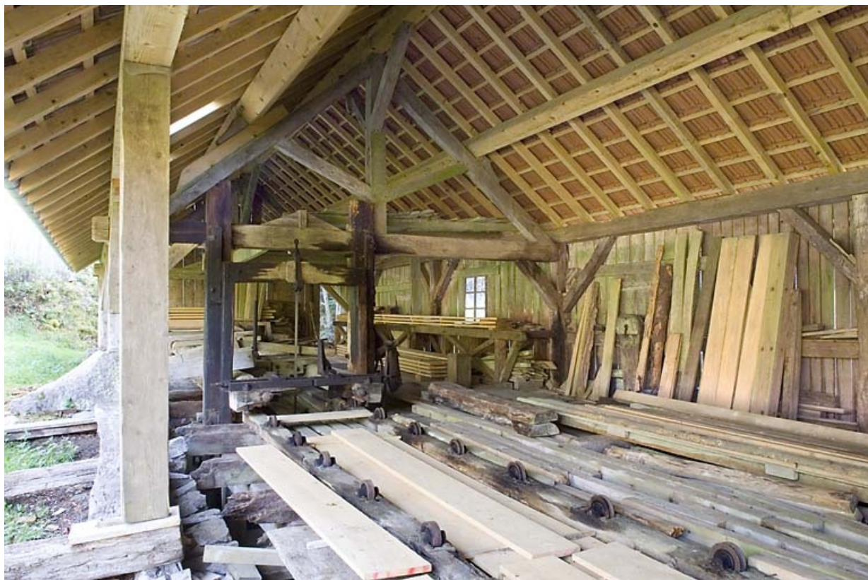
Intérieur de l'atelier de sciage. Chariot et châssis de scie. 70, Miellin, lieudit : le Miellenot