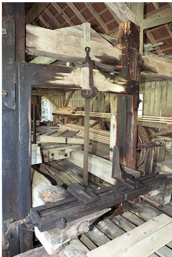
Châssis de scie. Vue de trois quarts gauche.