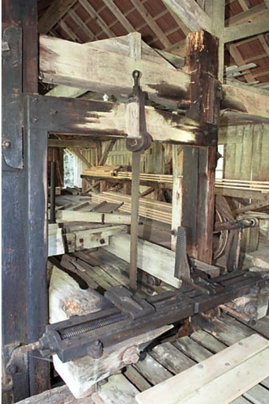
Châssis de scie. Vue de trois quarts gauche.