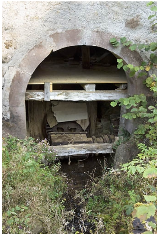
Ouverture cintrée et turbine Wiedeman Frères.