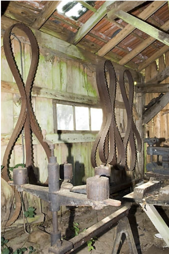
Intérieur de l'atelier d'affûtage. Lames de scie à ruban. 70, Miellin, lieudit : le Miellenot