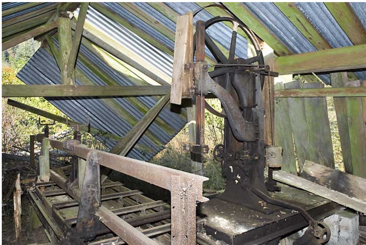
Atelier de la scie à ruban H. Regourd. 70, Miellin, lieudit : le Miellenot