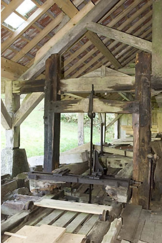
Châssis de scie. Vue de trois quarts droite.