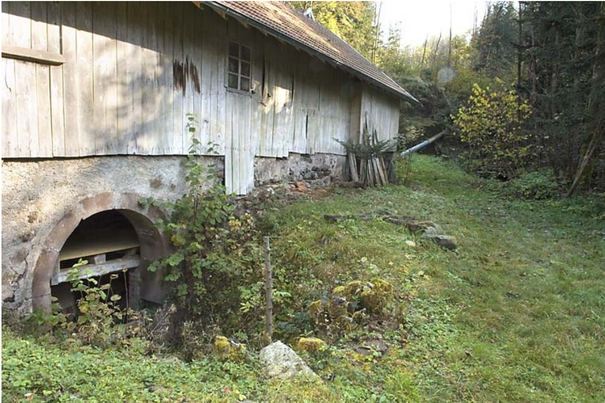
Façade occidentale. A gauche : ouverture en plein-cintre abritant la turbine. 70, Miellin, lieudit : le Miellenot