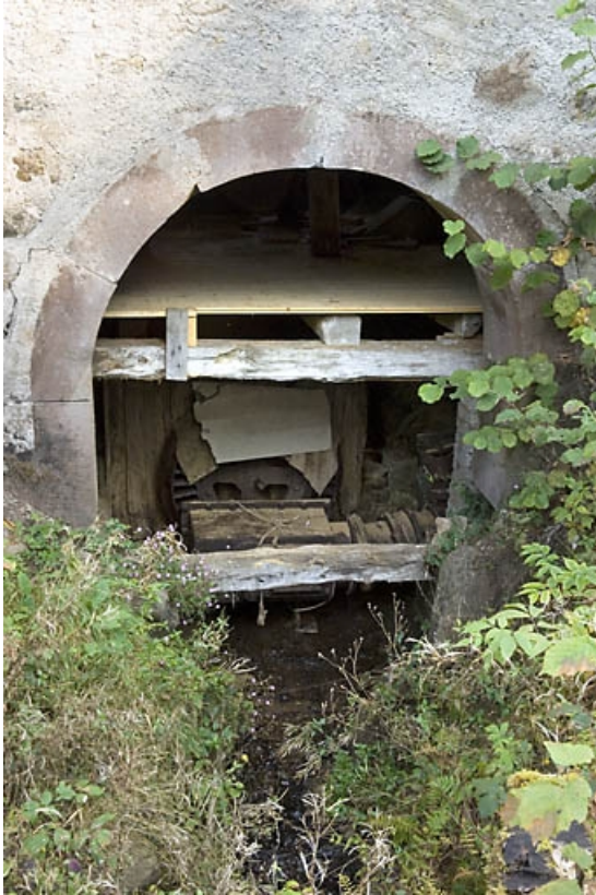
Ouverture cintrée et turbine Wiedeman Frères.