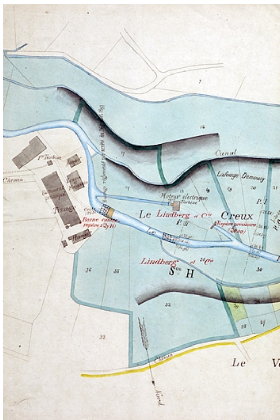
Plan et détails [Plan-masse et de situation du tissage Lindsberg].