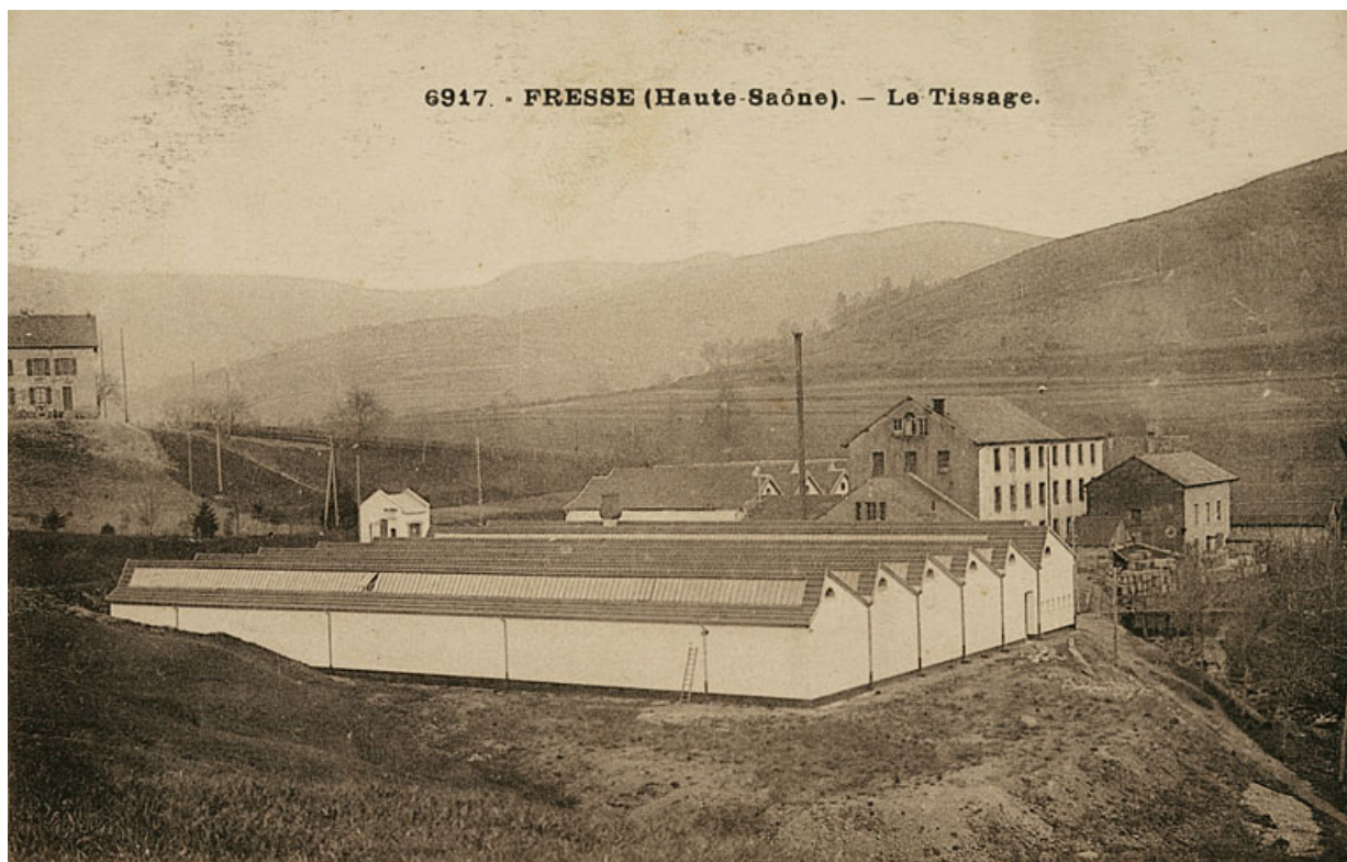
Fresse. (Haute-Saône). Le Tissage.