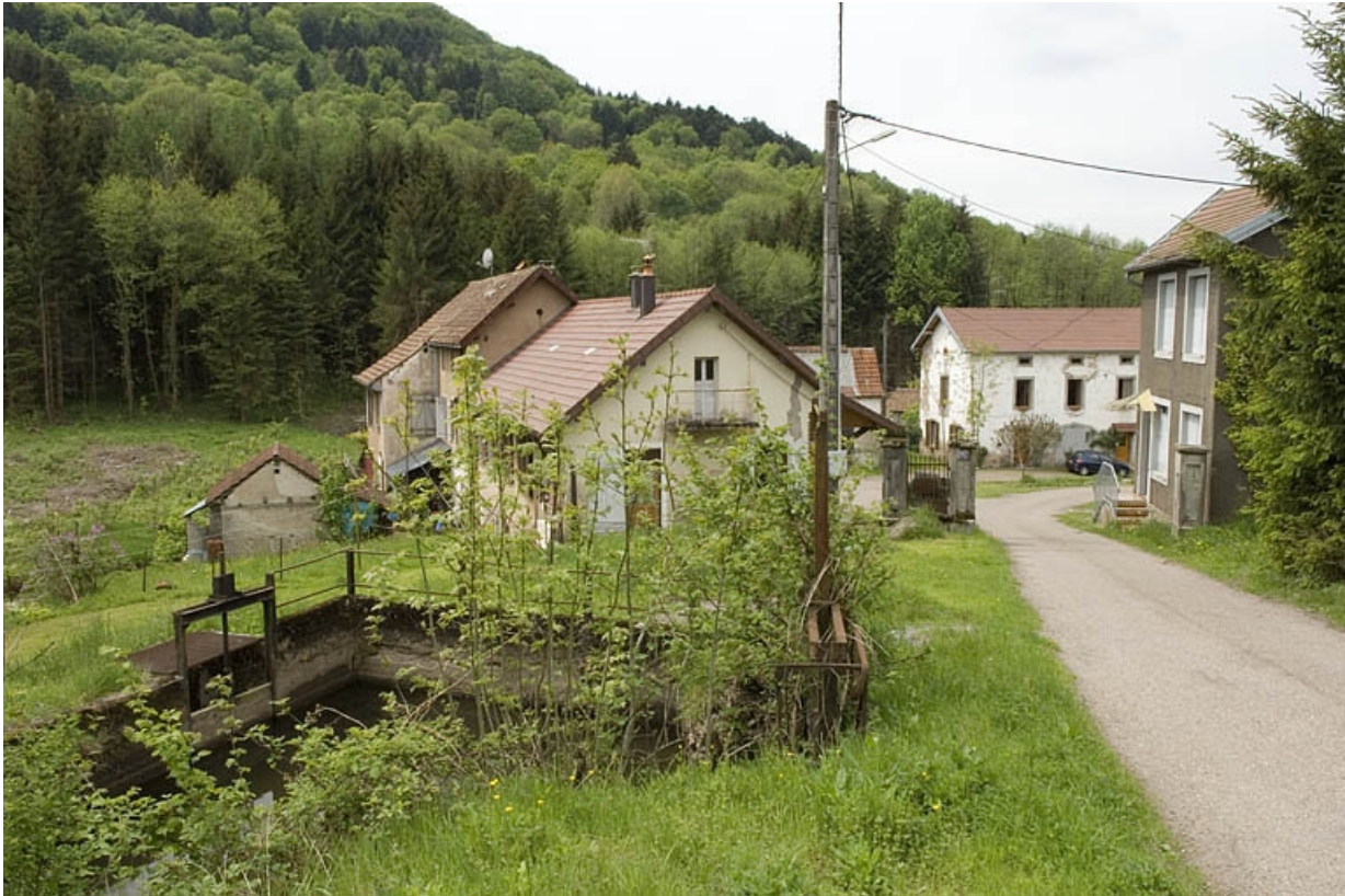
Vue d'ensemble depuis le chemin d'accès.