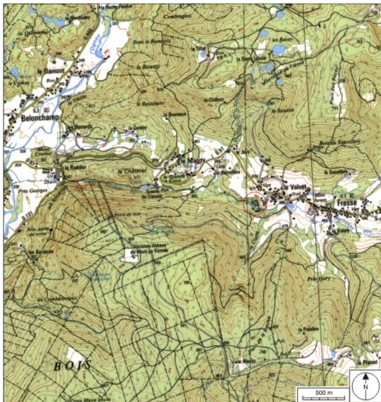
Carte de localisation. Carte topographique au 1:25000, I.G.N., Ballon d'Alsace, 3520 E. SCAN 25 © IGN - 2008, Licence n°2008CISE29-68.