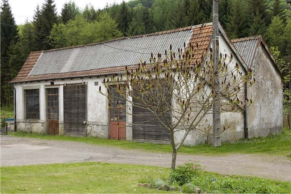
Atelier de réparation (menuiserie, forge).