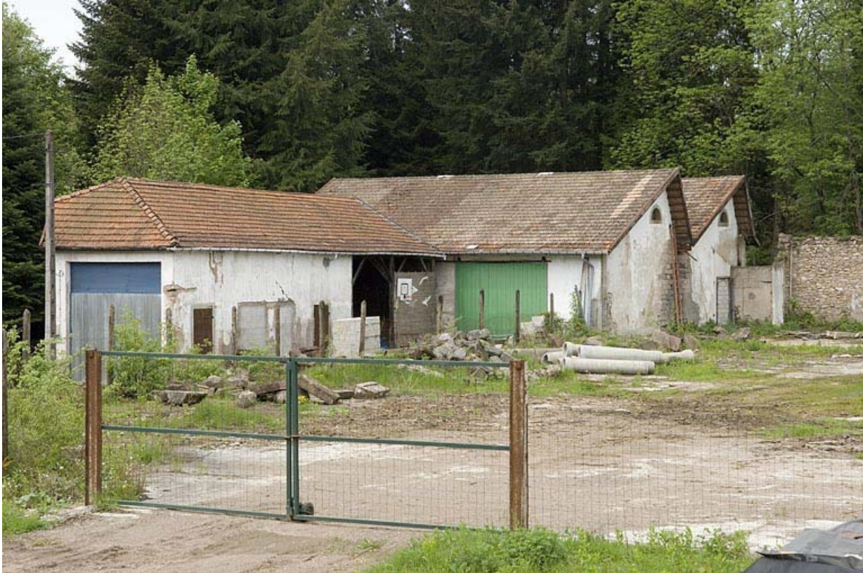
Vestiges de la salle de tissage.