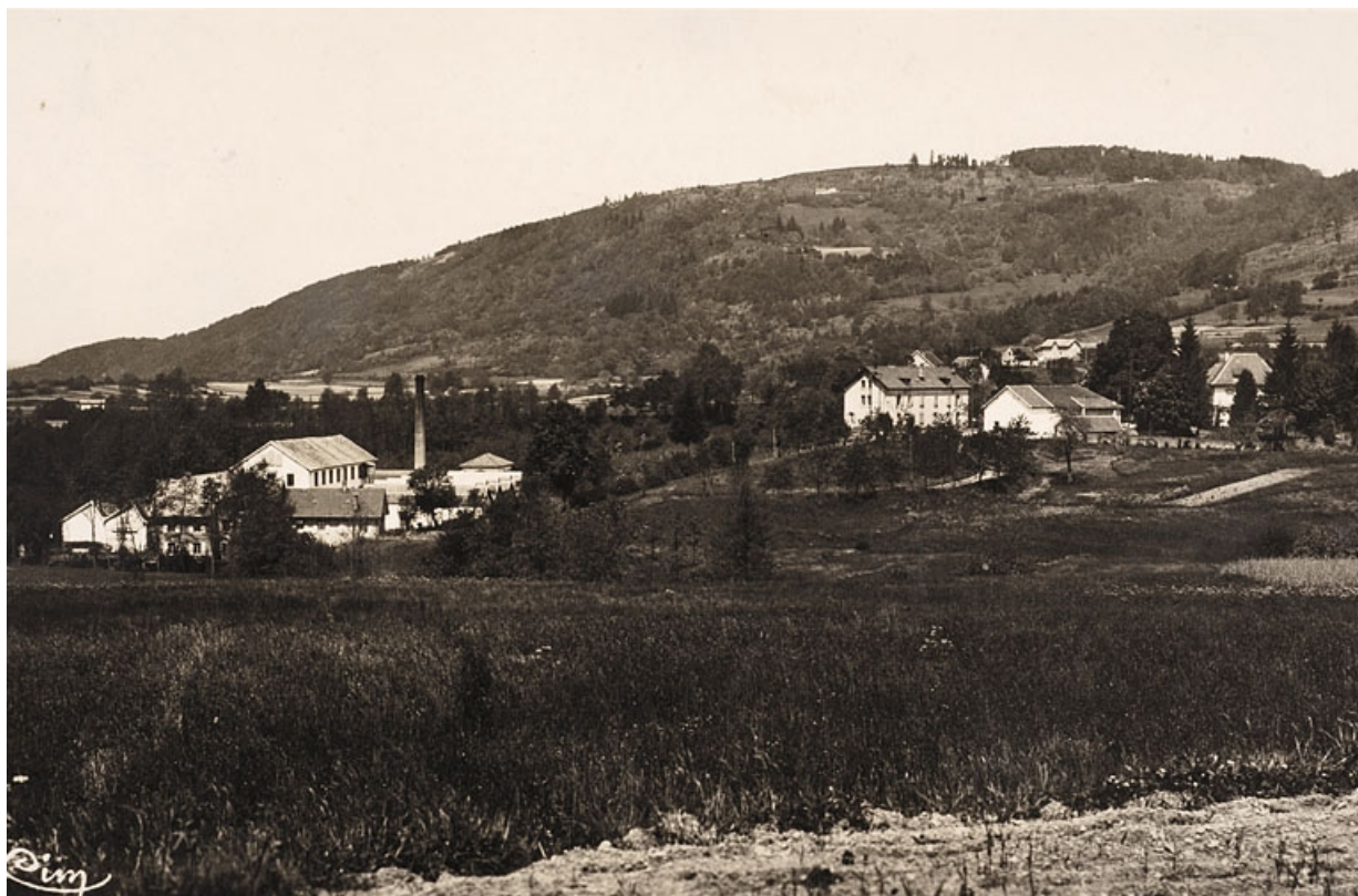
Fresse (Hte-Saône). Le Tissage et la Montagne.