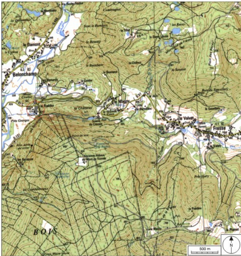
Carte de localisation. Carte topographique au 1:25000, I.G.N., Mésigny, 3520 O. 70, Belonchamp, lieudit : le Raddon