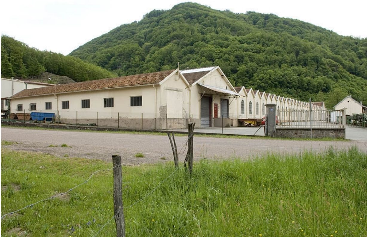
Vue de trois quarts de l'atelier de fabrication.