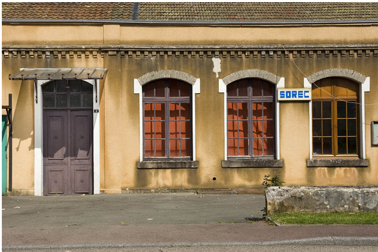
Détail de la façade antérieure.