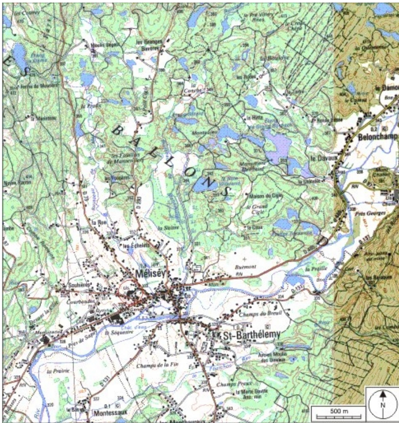
Carte de localisation. Carte topographique au 1:25000, I.G.N., Mélisey, 3520 O. SCAN 25 © IGN - 2008, Licence n°2008CISE29-68. 70, Mélisey, 2, 4 place de la Gare