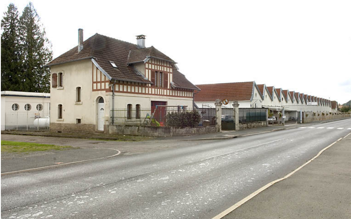
Vue d'ensemble depuis le nord-est.