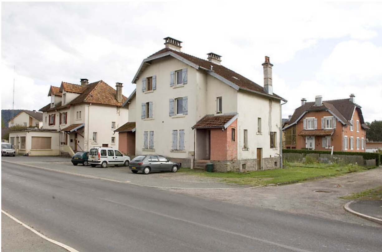
Vue d'ensemble de la cité ouvrière.