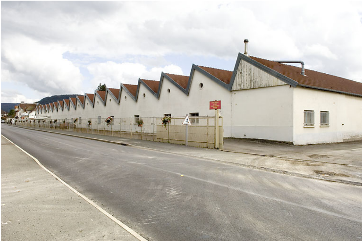
Vue d'ensemble depuis l'ouest.