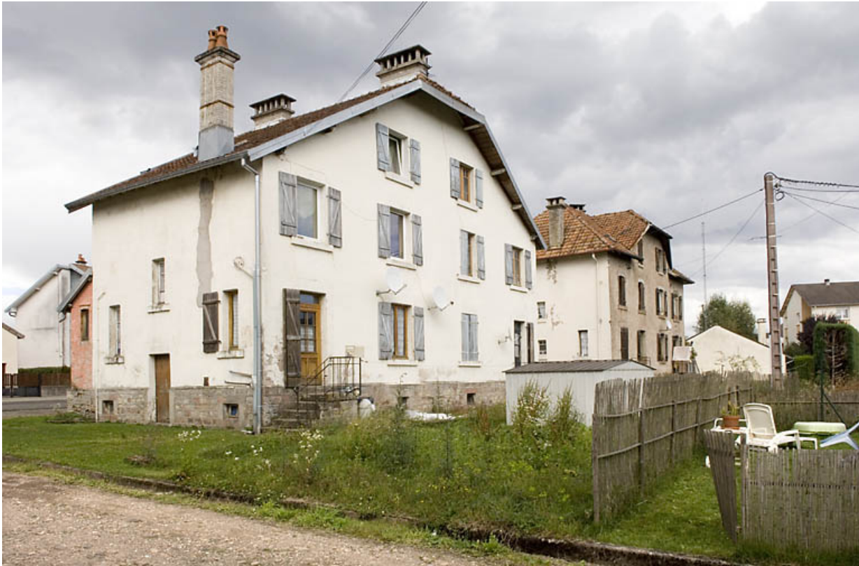
Façades postérieures des maisons ouvrières.