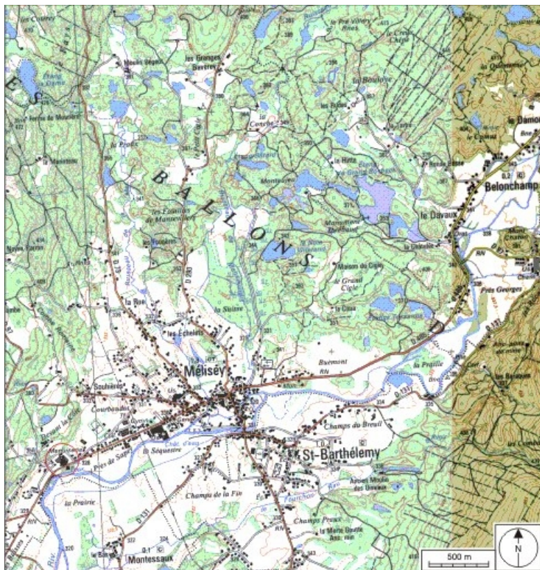
Carte de localisation. Carte topographique au 1:25000, I.G.N., Méliséy, 3520 O. 70, Méliséy, 54 à 58 route de Lure