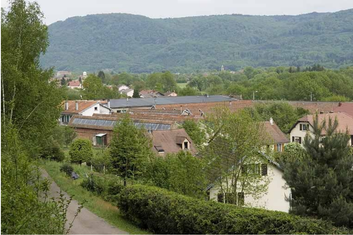
Vue plongeante depuis le nord-ouest.