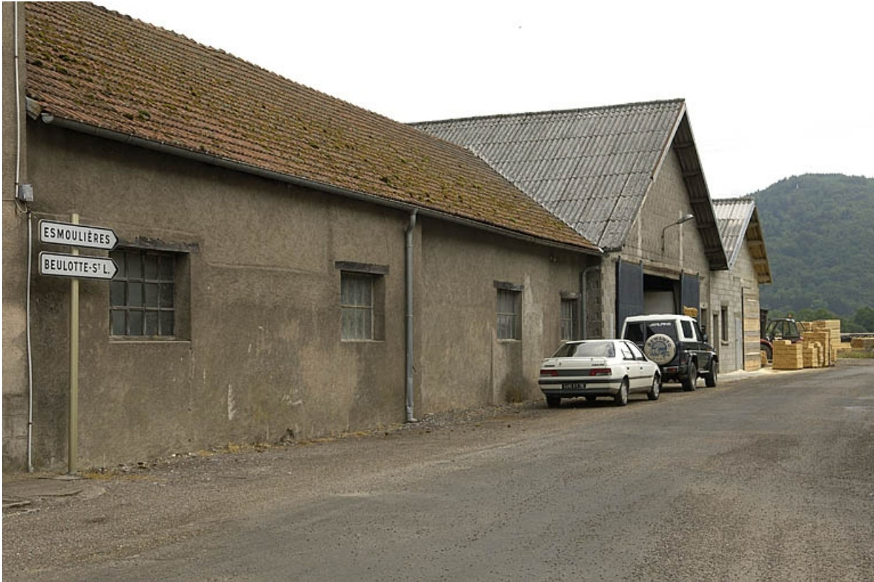
Façade de l'atelier de tournerie.

70, Faucogney-et-la-Mer, 1 rue de la Petite Rochotte