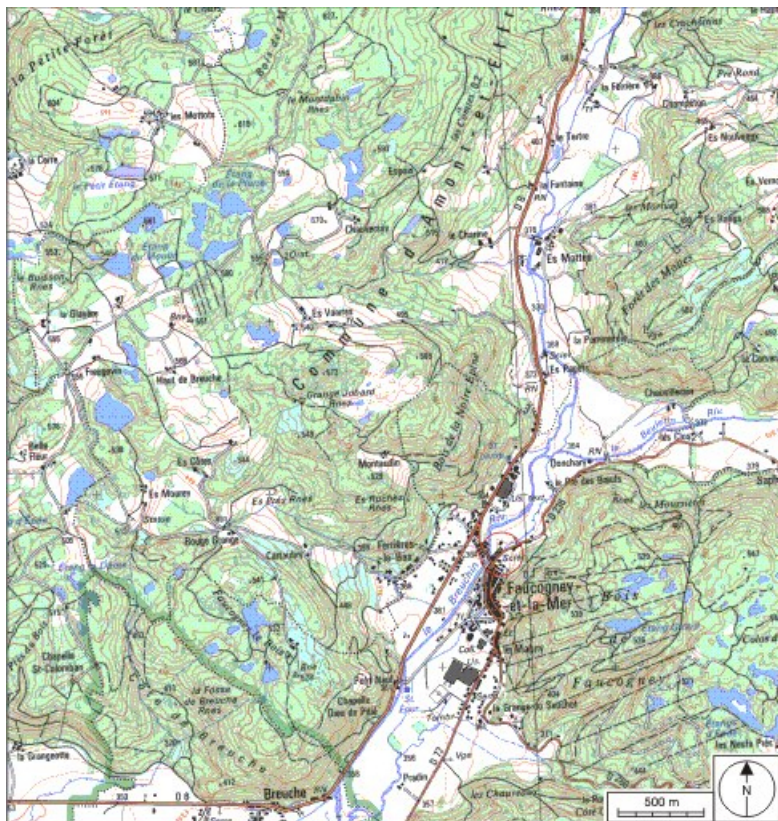
Carte de localisation. Carte topographique au 1:25000, I.G.N., Mélisey, 3520 O. 70, Faucogney-et-la-Mer, 1 rue de la Petite Rochotte