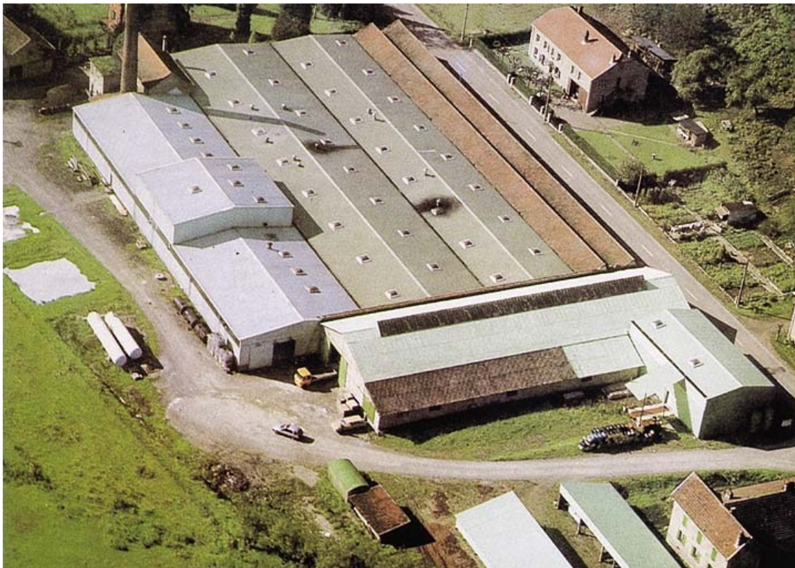
Vue aérienne de l'usine d'Enduction Dreyer Rhénoflex France.