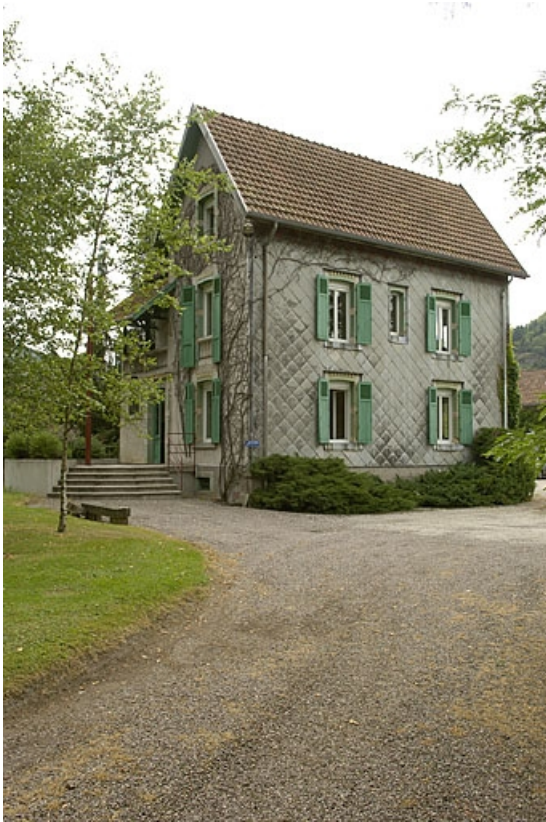
Ancien logement patronal. Vue depuis l'entrée.