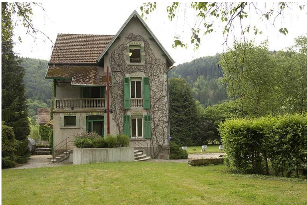
Ancien logement patronal. Façade ouest.