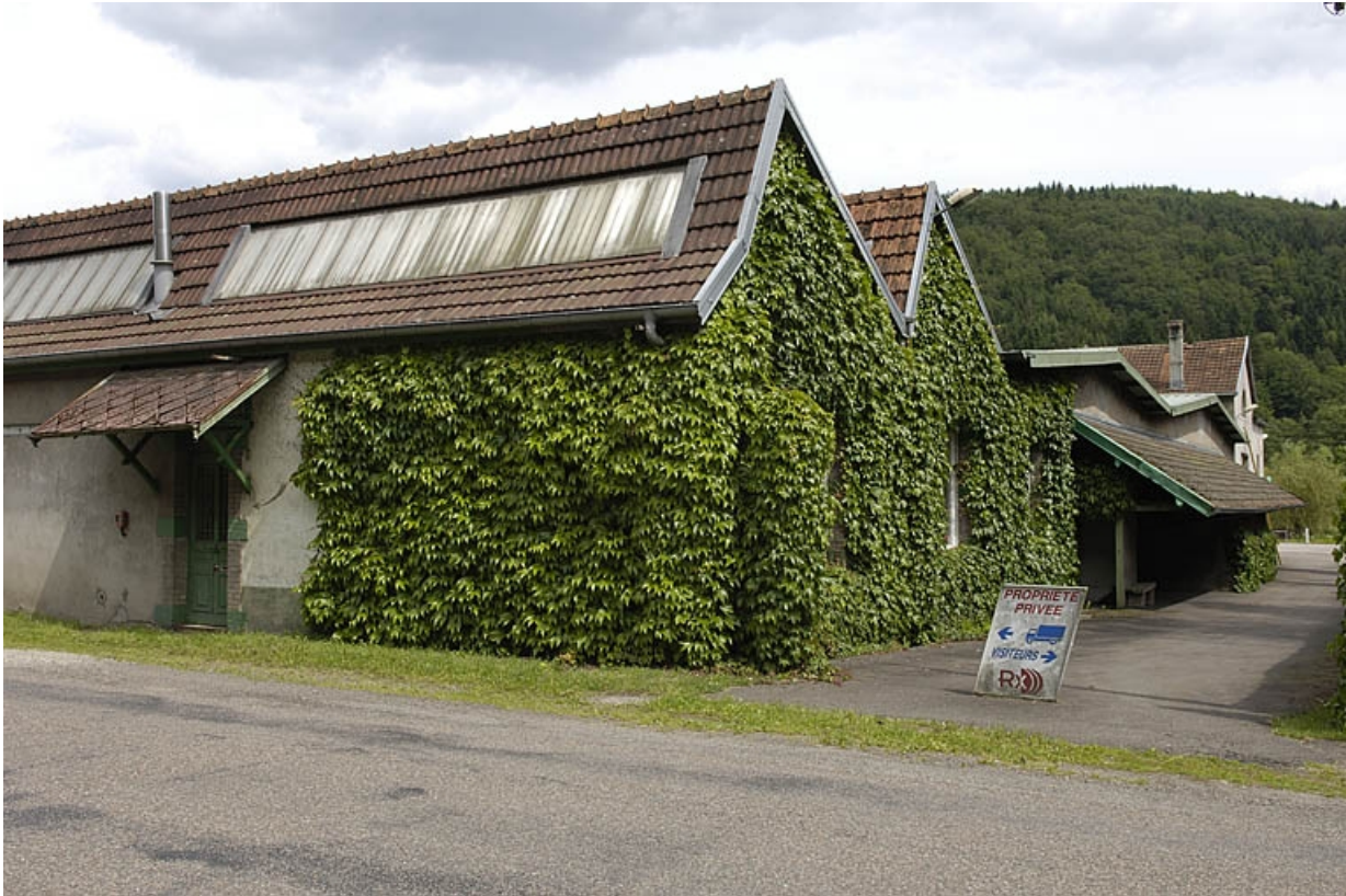
Ancienne entrée de l'usine.