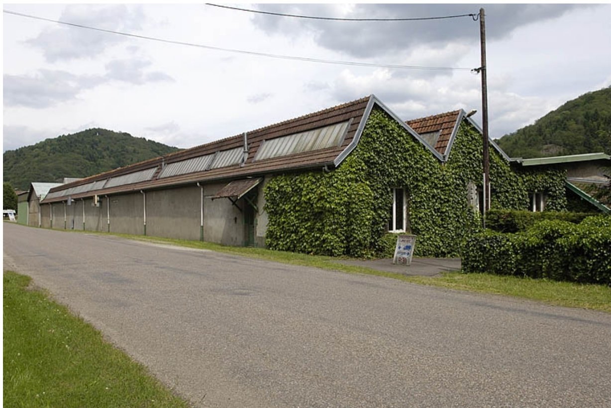
Vue d'ensemble depuis la route départementale.