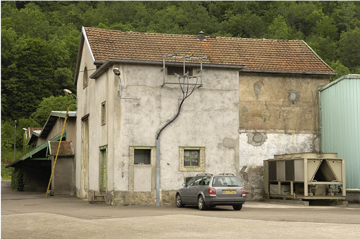
Transformateur et ancienne chaufferie.