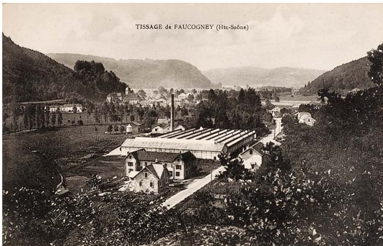
Tissage de Faucogney (Haute-Saône).