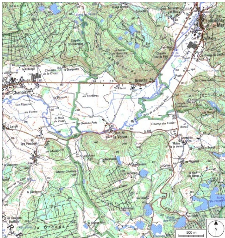
Carte de localisation. Carte topographique au 1:25000, I.G.N., Mélisey, 3520 O. 70, La Voivre R.D.139