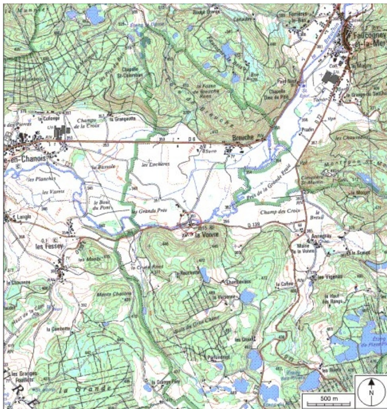
Carte de localisation. Carte topographique au 1:25000, I.G.N., Mélisey, 3520 O. SCAN 25, Licence n°2008CISE29-68. 70, La Voivre R.D.139