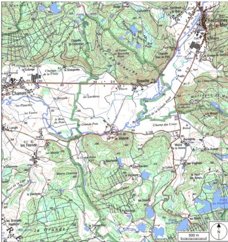
Carte de localisation. Carte topographique au 1:25000, I.G.N., Mélisey, 3520 O. SCAN 25, Licence n°2008CISE29-68. 70, La Voivre R.D.139