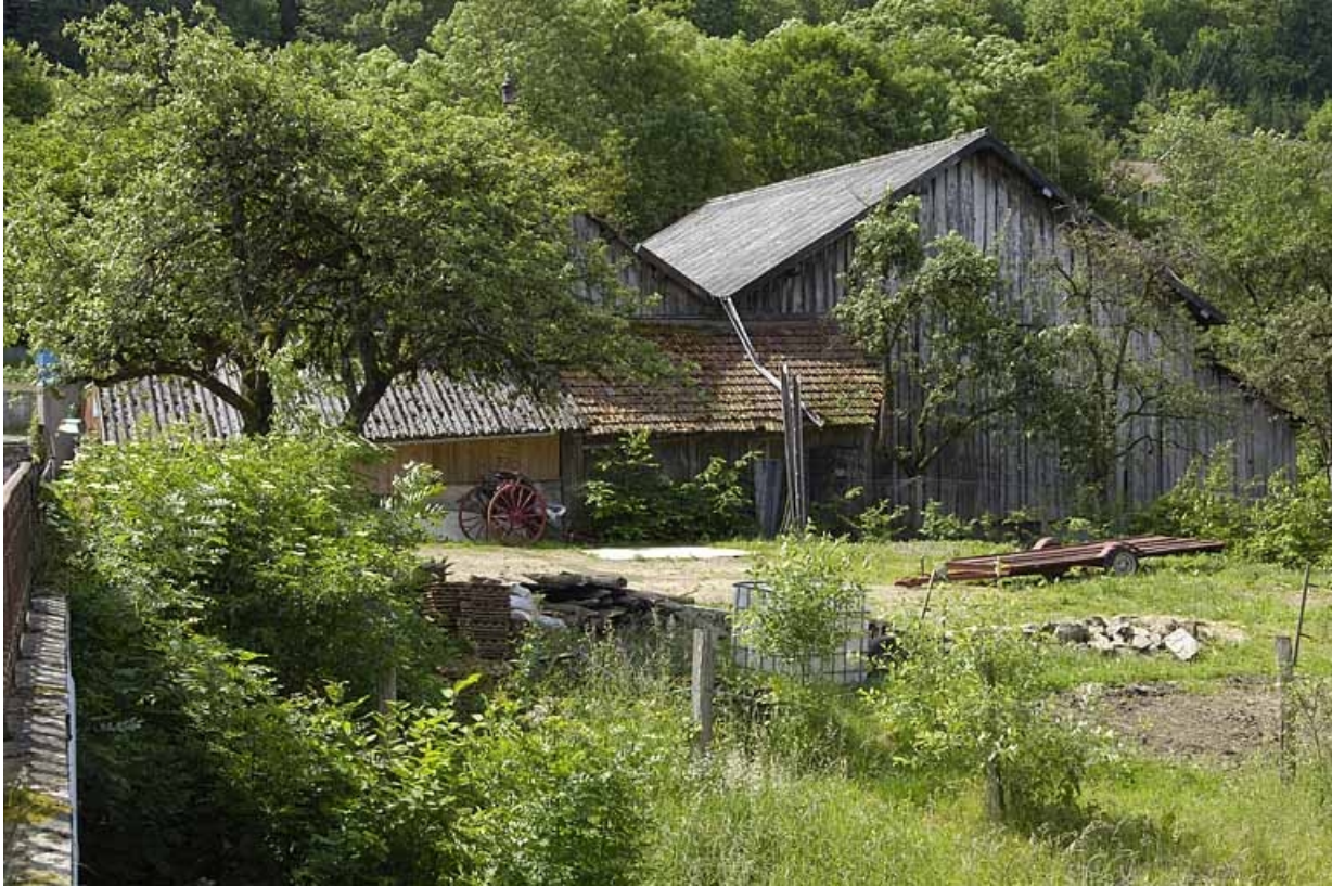
Pignons de l'atelier de scierie.