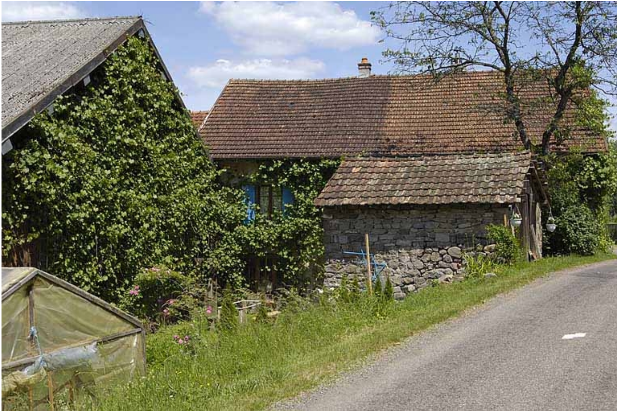
Façade postérieure du logement.