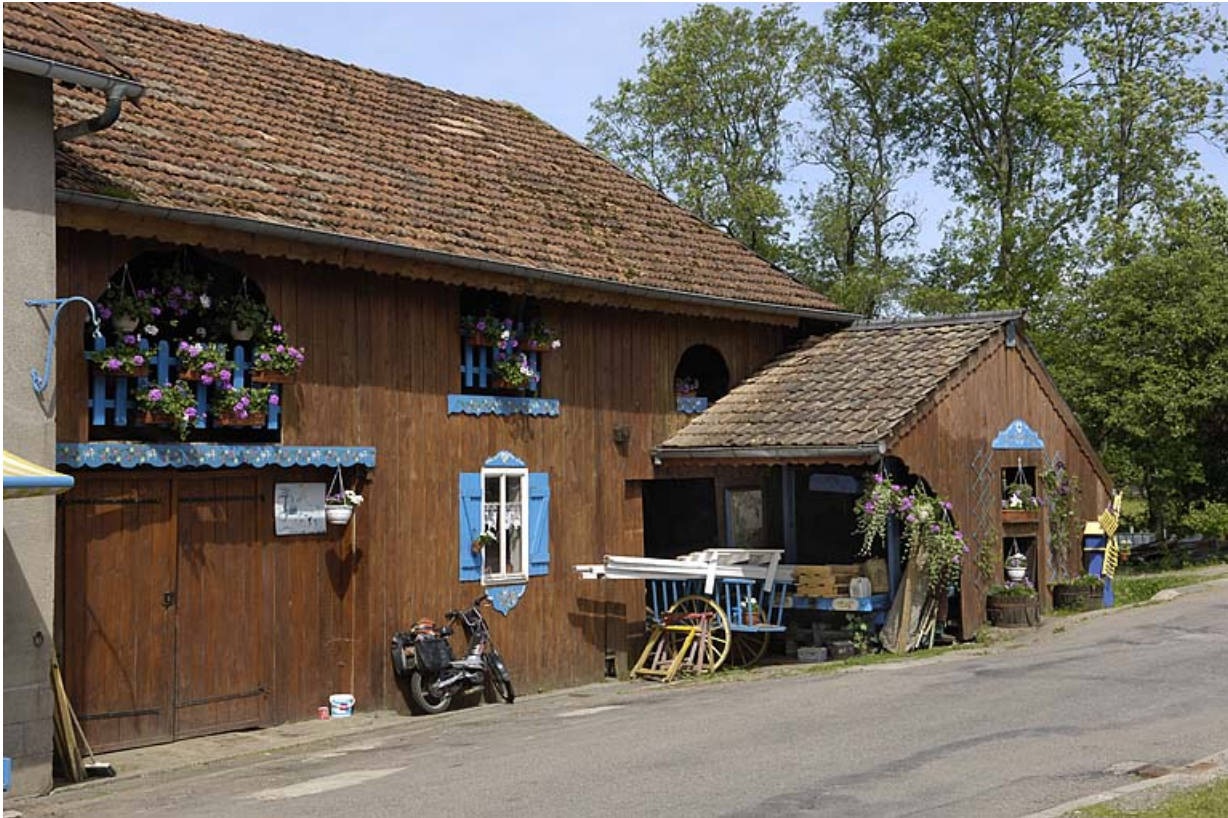
Façade est de l'atelier de scierie.