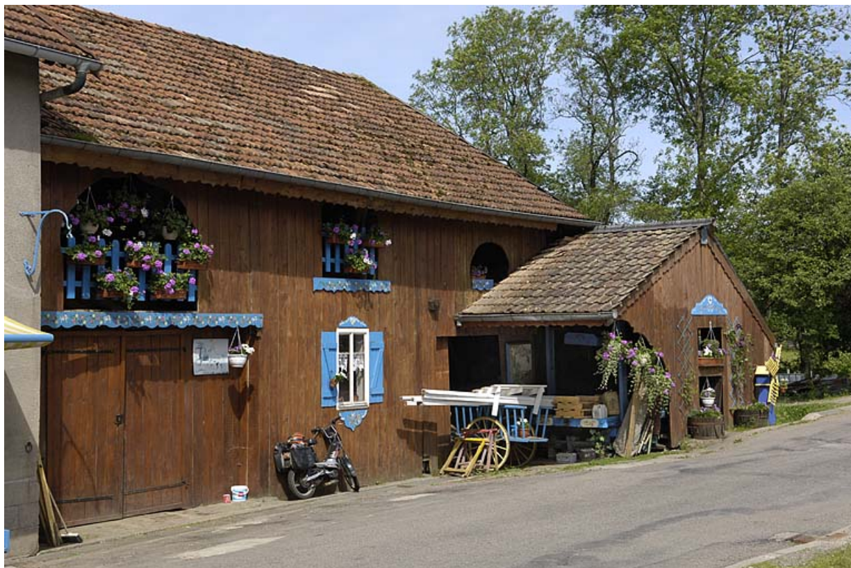
Façade est de l'atelier de scierie.