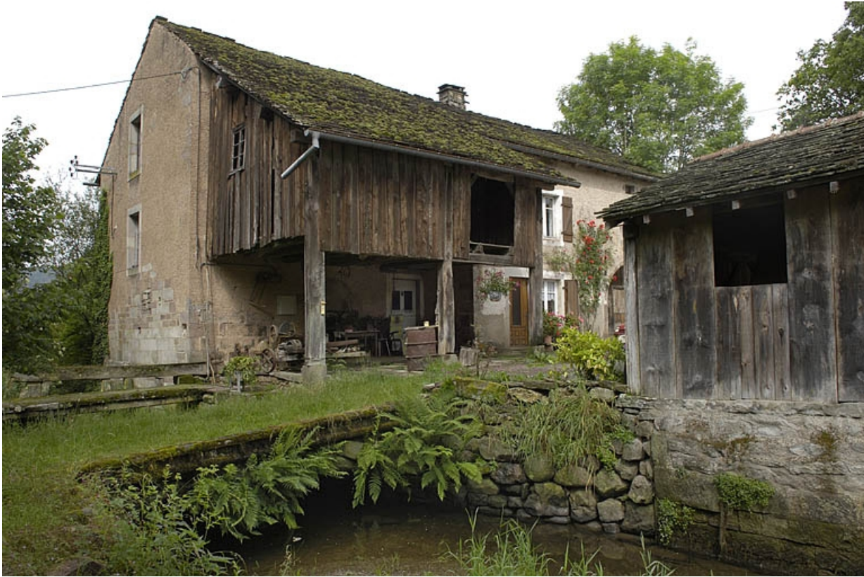
Atelier de saboterie depuis la rive gauche du bief de dérivation.

70, Sainte-Marie-en-Chanois, lieudit : sur le Breuchin