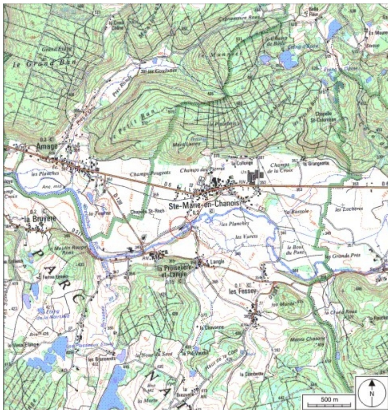
Carte de localisation. Carte topographique au 1:25000, I.G.N., Mélisey, 3520 O. 70, Sainte-Marie-en-Chanois, lieu-dit : sur le Breuchin