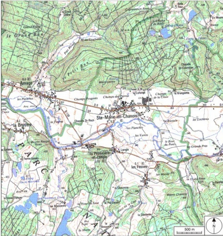
Carte de localisation. Carte topographique au 1:25000, I.G.N., Mélisey, 3520 O. SCAN 25 © IGN - 2008, Licence n°2008CISE29-68. 70, Sainte-Marie-en-Chanois, lieu-dit : sur le Breuchin