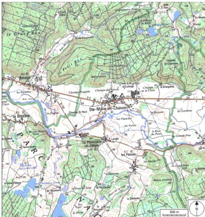
Carte de localisation. Carte topographique au 1:25000, I.G.N., Mélisey, 3520 O. SCAN 25 © IGN - 2008, Licence n°2008CISE29-68. 70, Sainte-Marie-en-Chanois, lieu-dit : sur le Breuchin