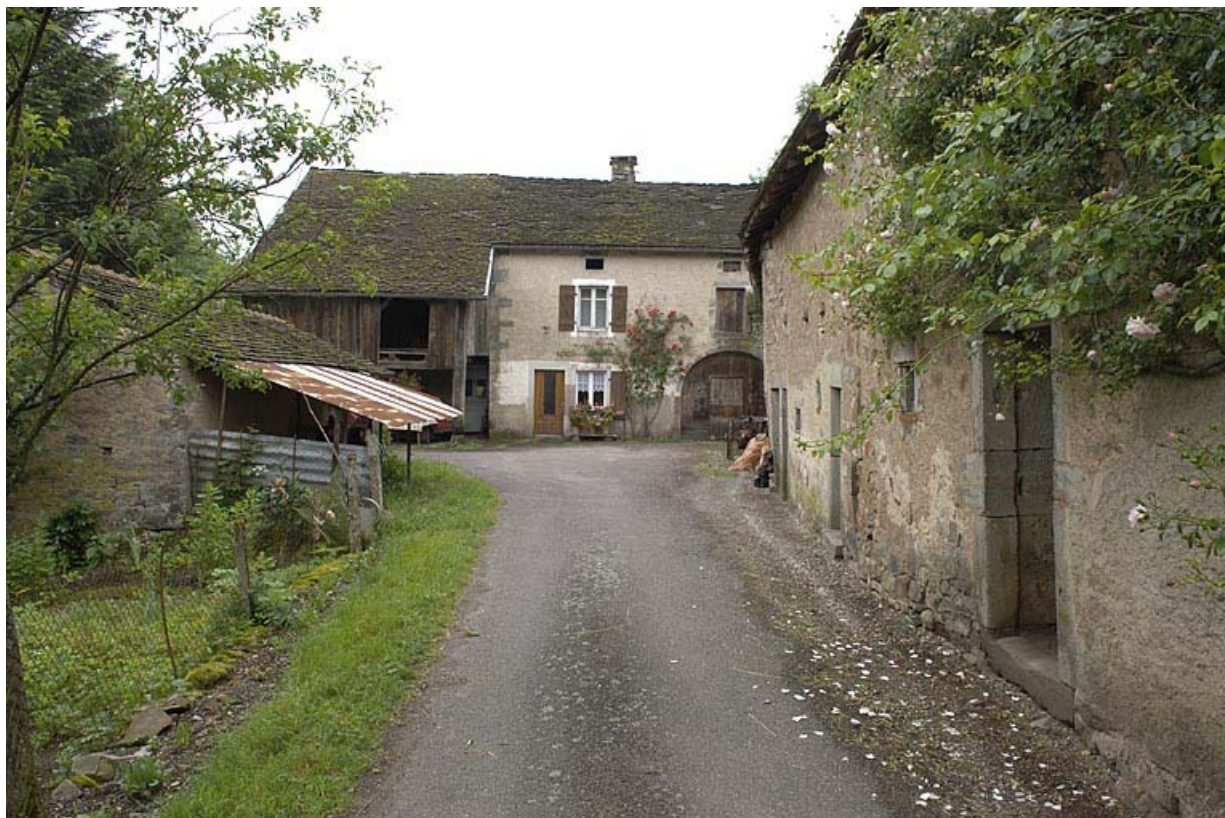
Atelier de saboterie, logis et parties agricoles vus depuis l'entrée. 70, Sainte-Marie-en-Chanois, lieudit : sur le Breuchin