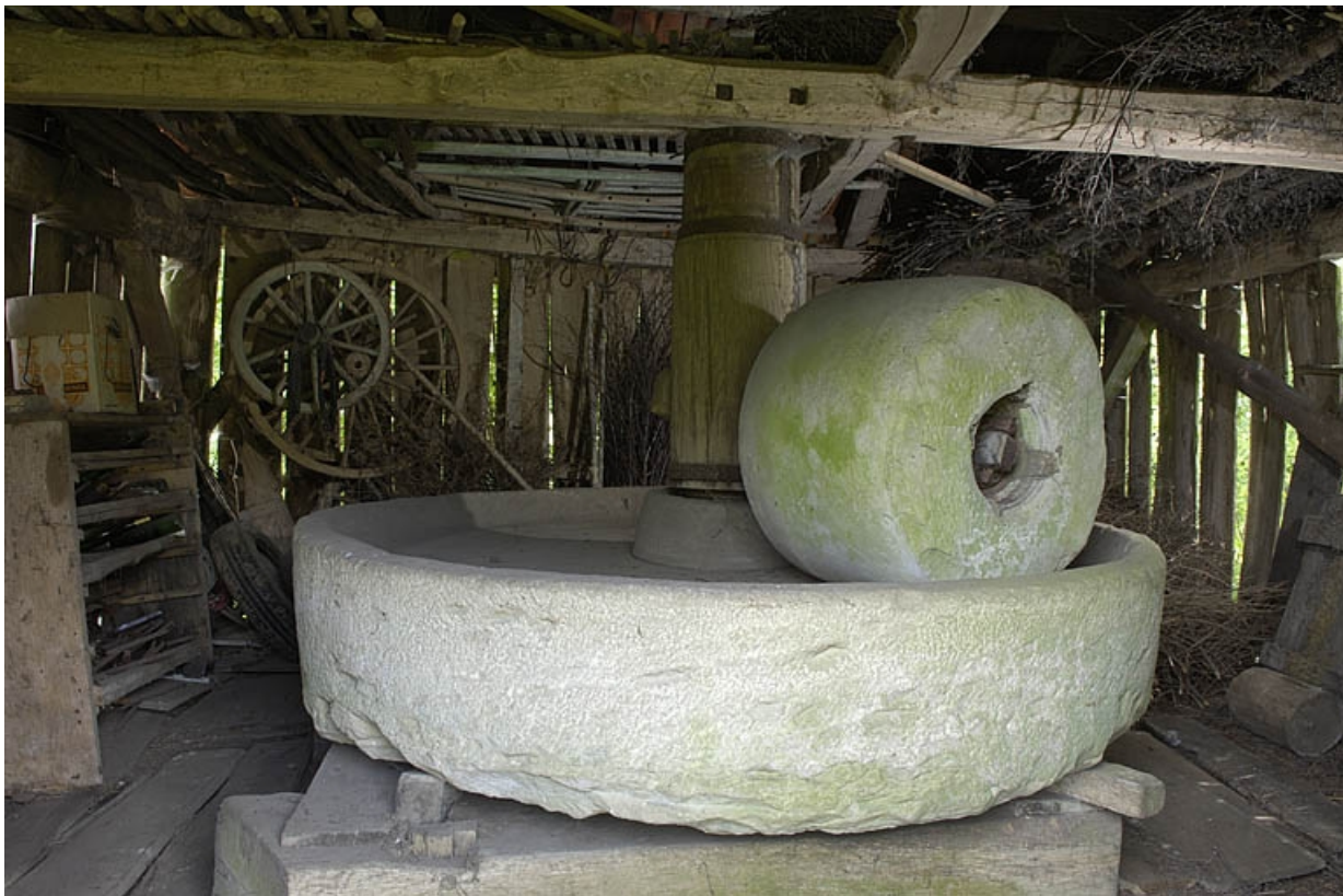
La ribe vue depuis l'entrée.

70, Amont-et-Effreney, lieudit : Es Mottes