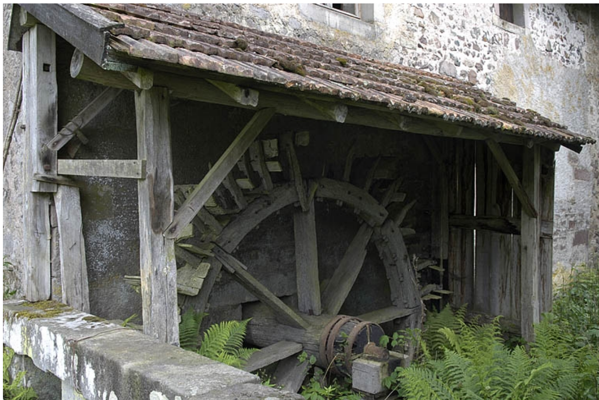
Implantation de la roue hydraulique contre la façade ouest du moulin.

70, Amont-et-Effreney, lieudit : Es Mottes