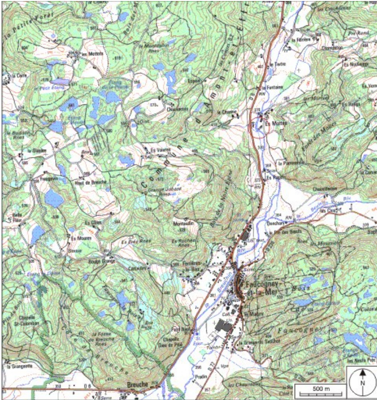
Carte de localisation. Carte topographique au 1:25000, I.G.N., Mélisey, 3520 O. SCAN 25, Licence n°2008CISE29-68. 70, Amont-et-Effrenoy, lieu-dit : Es Mottes