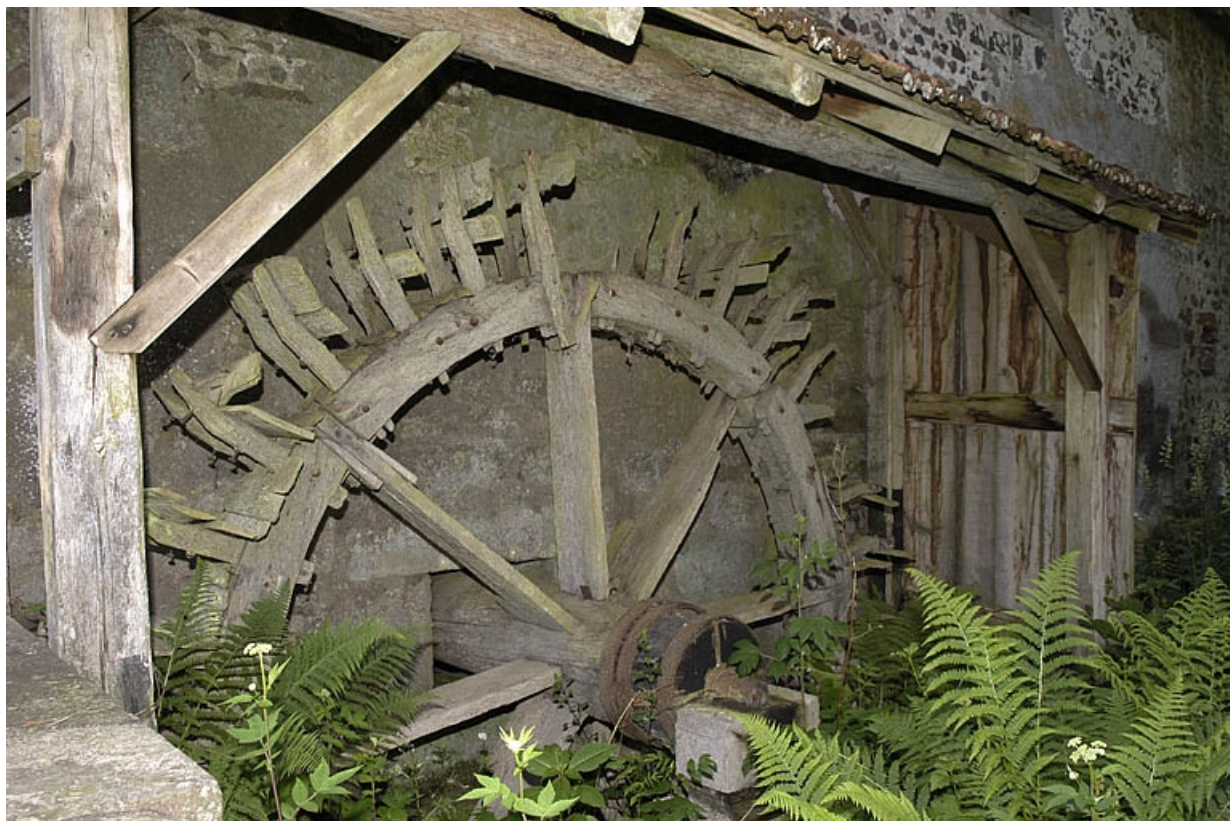
Détail de la roue hydraulique en dessous.

70, Amont-et-Effreney, lieudit : Es Mottes