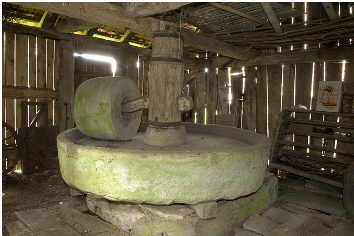
Vue d'ensemble de la ribe.

70, Amont-et-Effreney, lieudit : Es Mottes