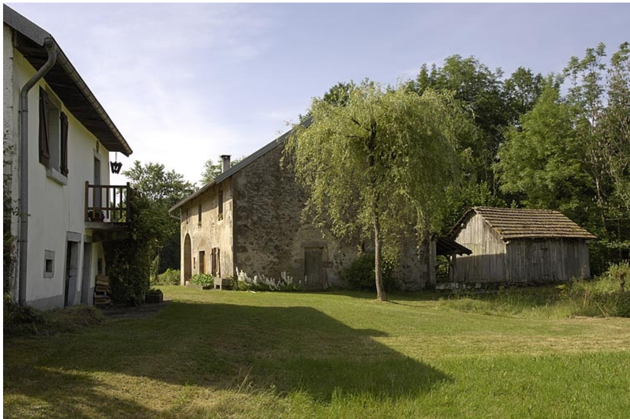
Logement, moulin et huilerie depuis le nord.

70, Amont-et-Effreney, lieudit : Es Mottes