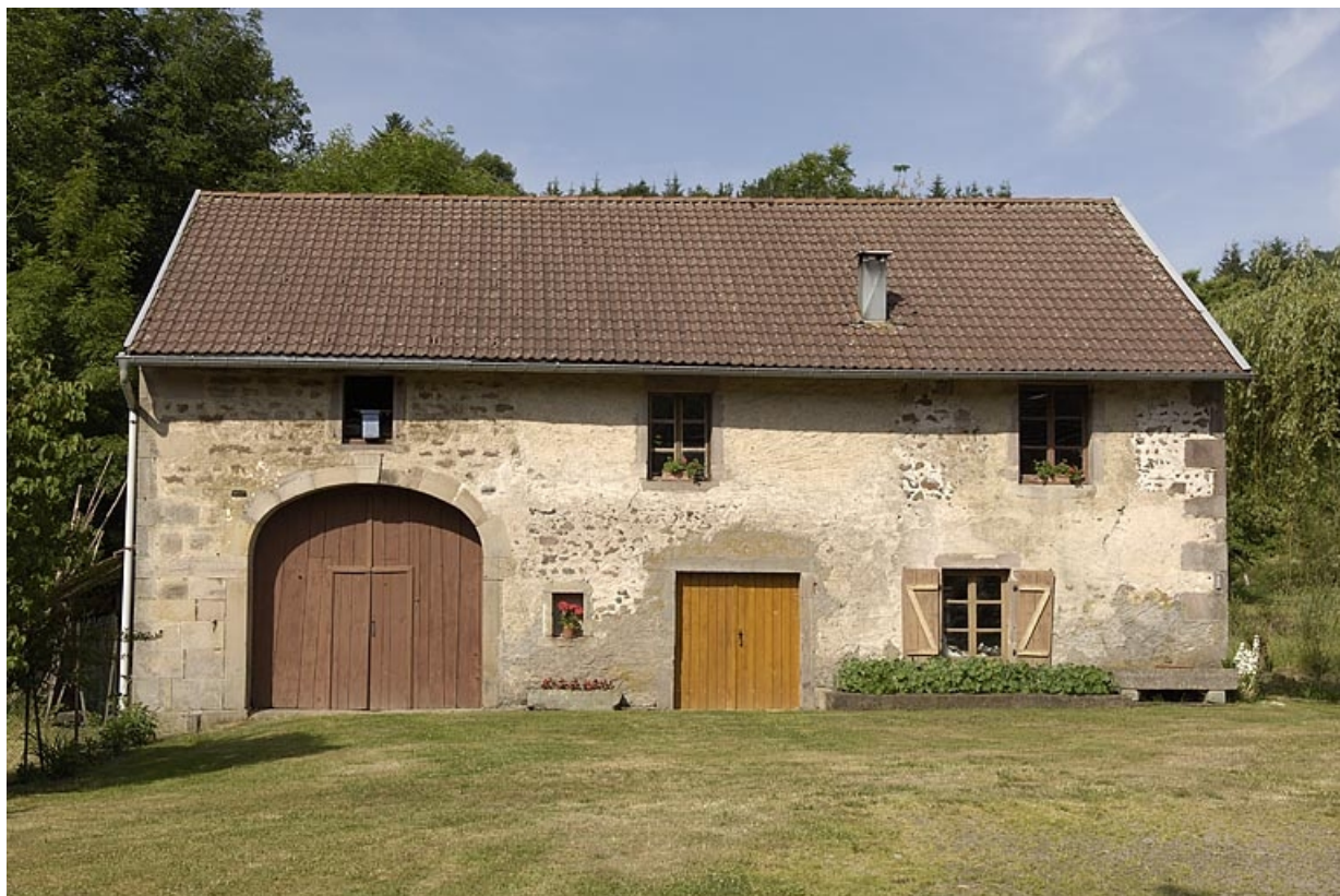
Façade est du moulin.

70, Amont-et-Effreney, lieudit : Es Mottes