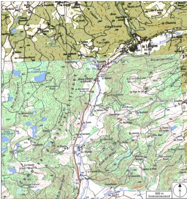
Carte de localisation. Carte topographique au 1:25000, I.G.N., Mélisey, 3520 O. 70, Amont-et-Effreney, lieu-dit : la Rochotte