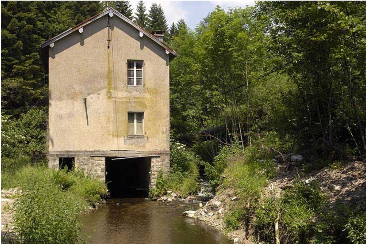
Vue depuis l'aval.

70, La Longine R.D. 138, lieudit : sur la Croslière