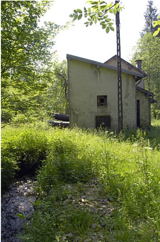
Vue depuis l'amont.

70, La Longine R.D. 138, lieudit : sur la Croslière