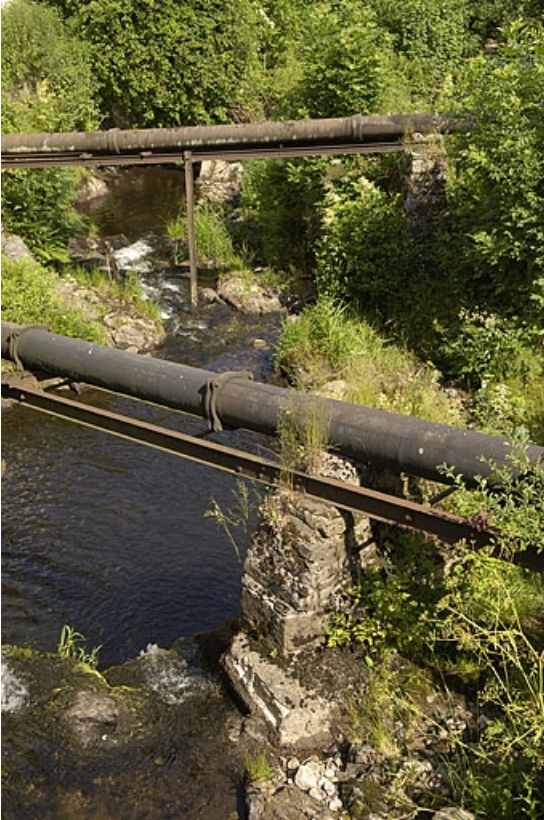
Conduites forcées enjambant le Breuchin.