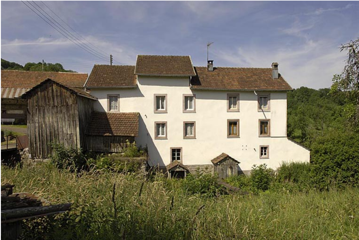
Façade est de la minoterie.