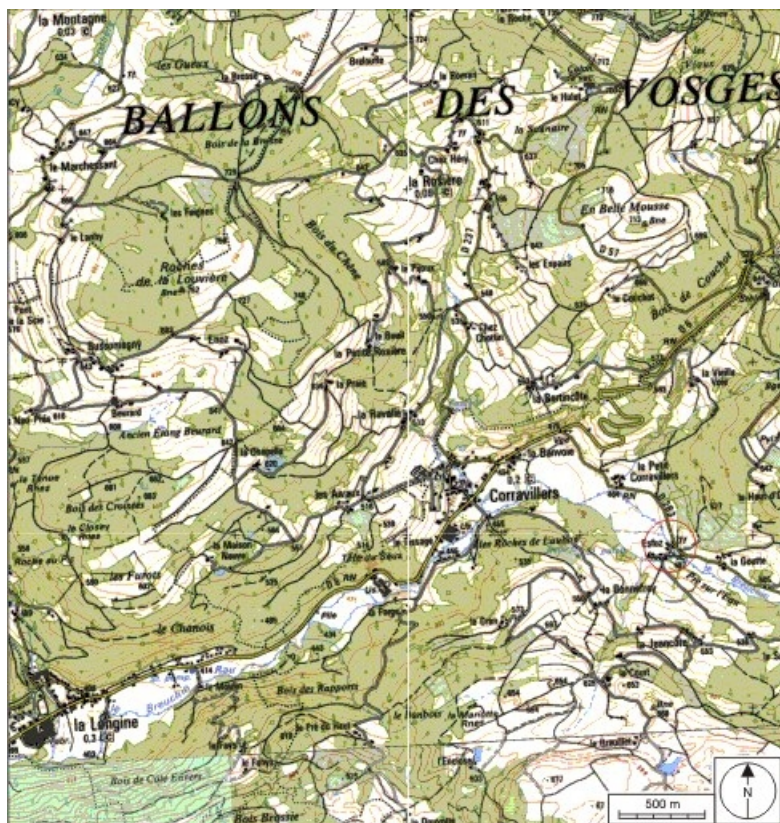
Carte de localisation. Carte topographique au 1:25000, I.G.N., Remiremont, 3519 OT. SCAN 25