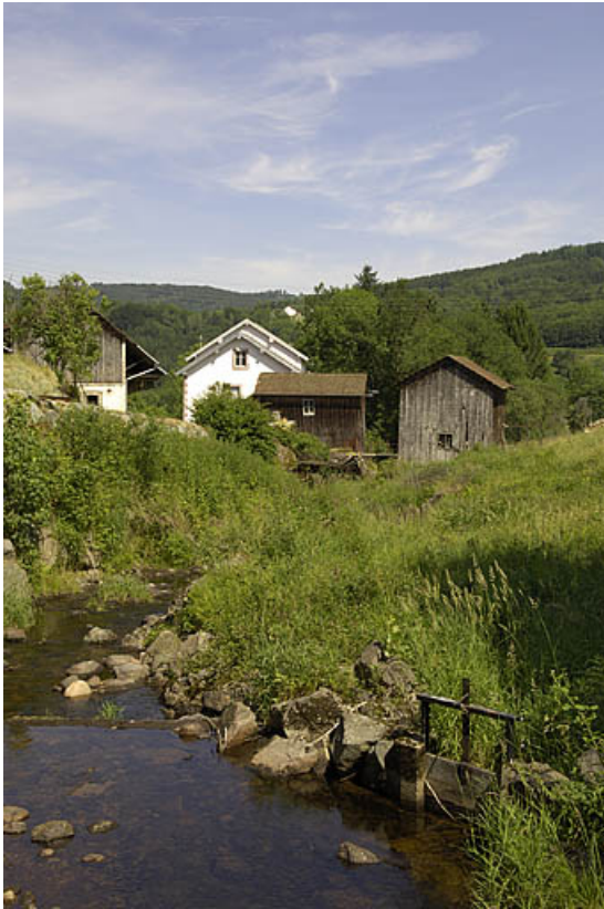
Vue d'ensemble depuis l'amont.