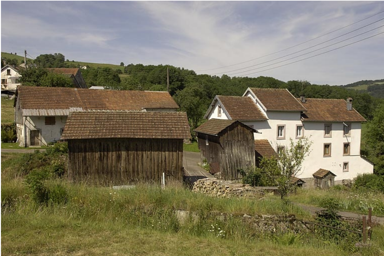
Vue d'ensemble depuis l'est.