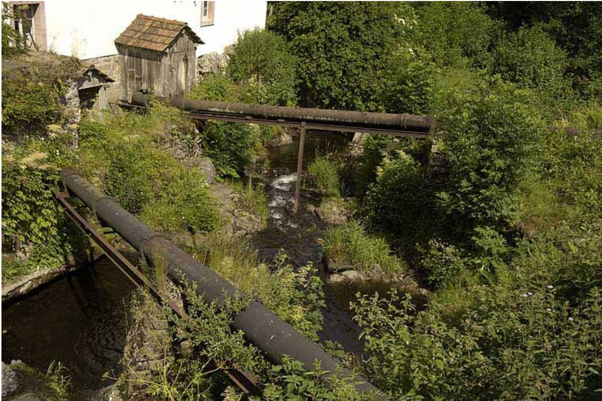
Conduites forcées alimentant les turbines hydrauliques.