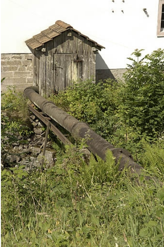
Conduite forcée et bâtiment d'eau abritant la turbine.