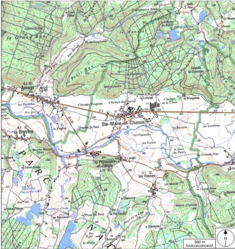
Carte de localisation. Carte topographique au 1:25000, I.G.N., Mélisey, 3520 O. 70, Amage, lieudit : sur le Breuchin