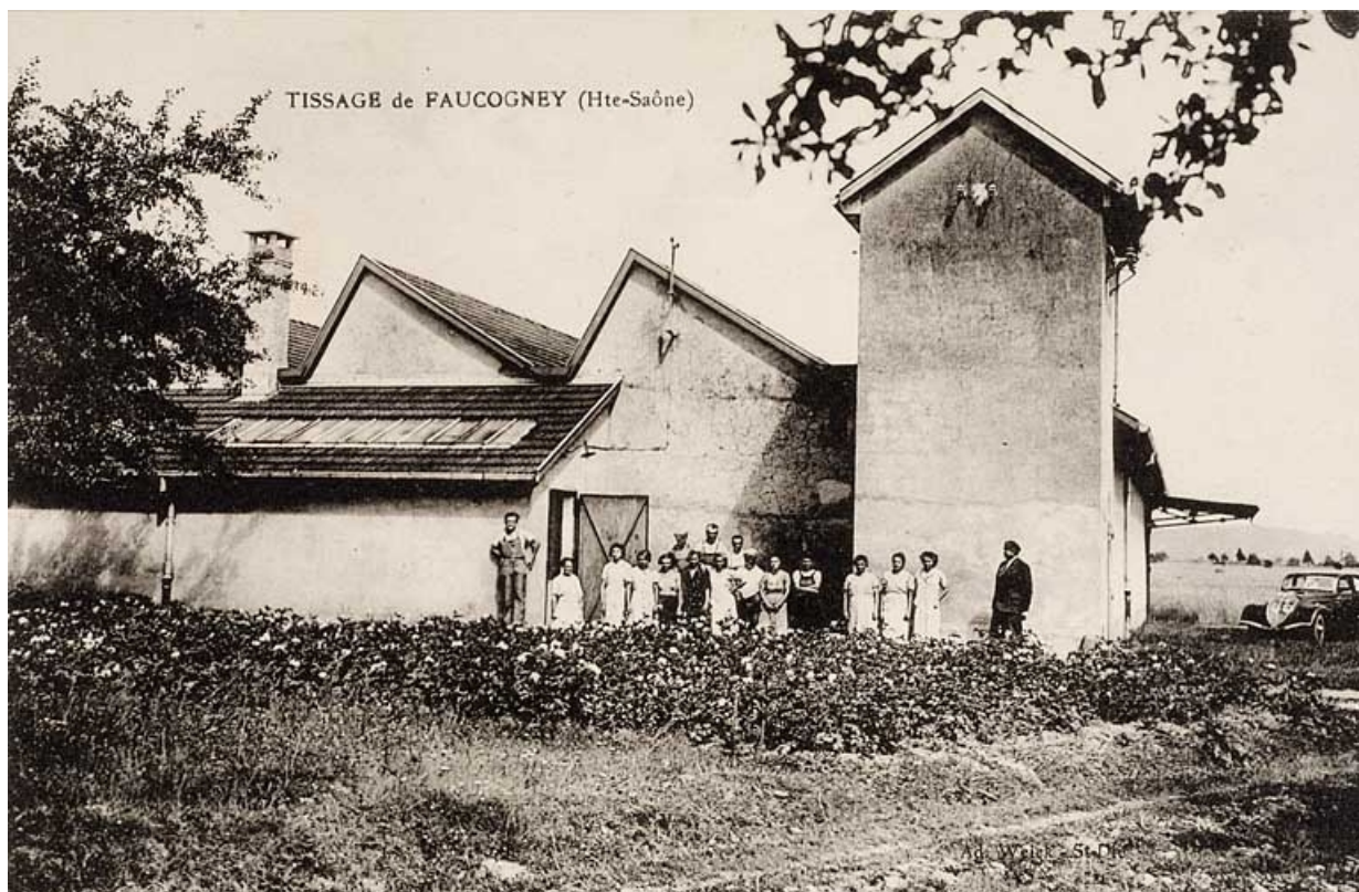
Tissage d'Amage [improprement légendé : Tissage de Faucogney] : vue depuis l'ouest.