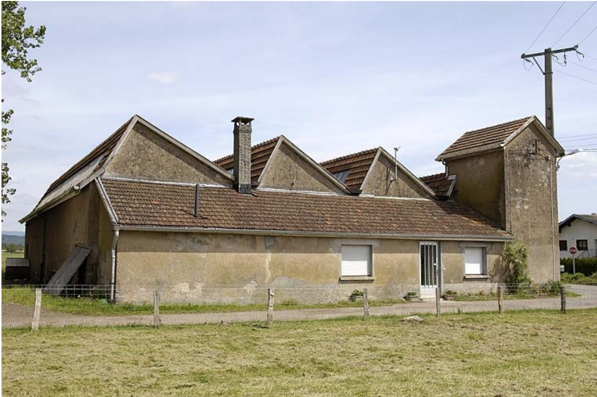
Salle de tissage et transformateur depuis le nord-ouest.