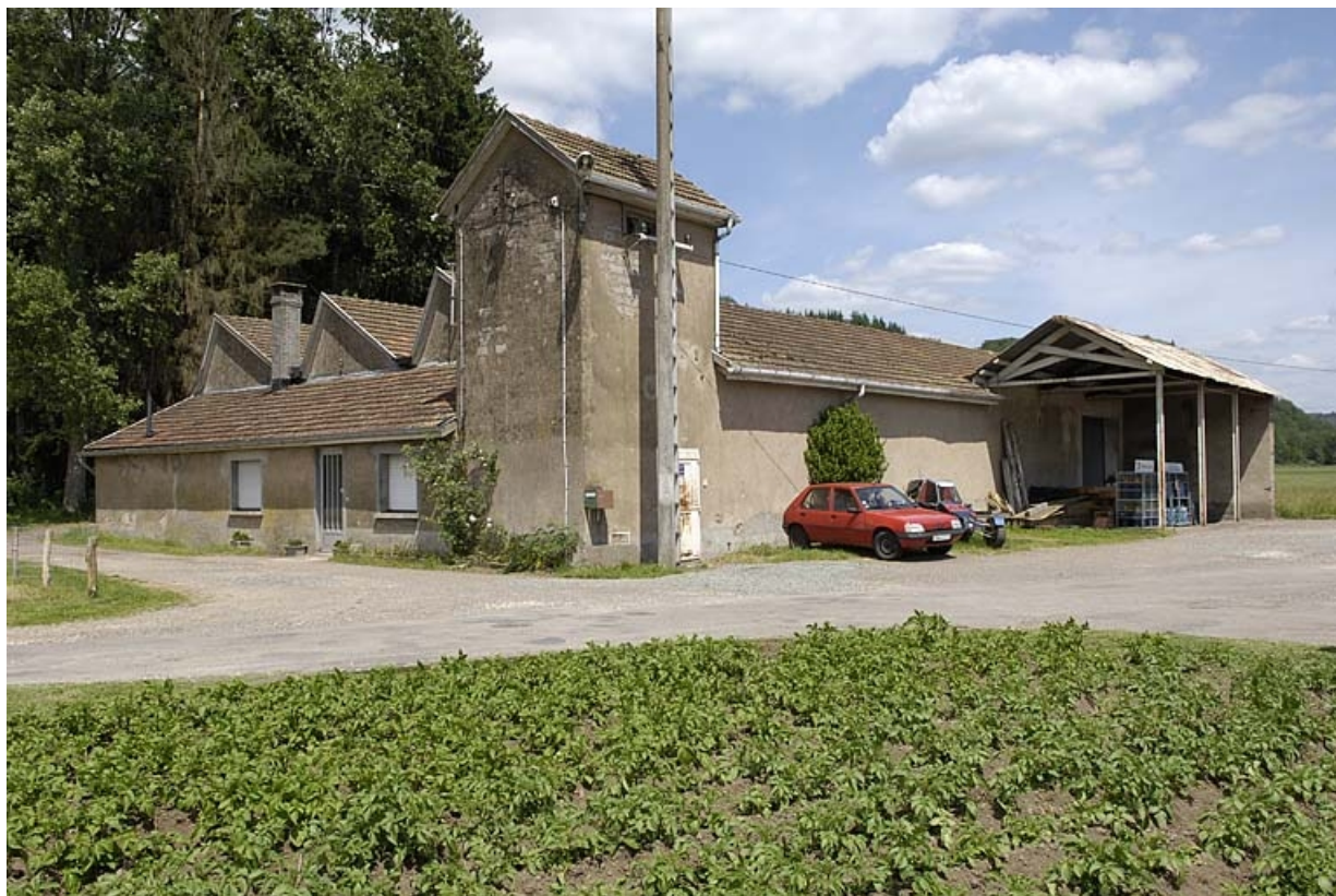
Vue d'ensemble depuis l'ouest. 70, Amage R.D. 6